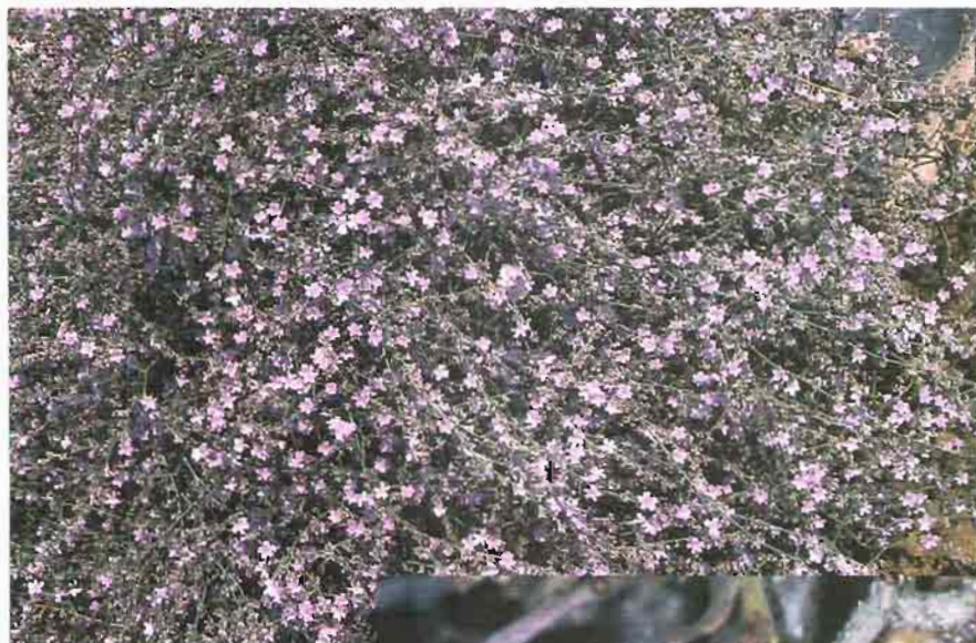
46. Crataegus orientalis Pall. ex M. Bieb. subsp. presliana K.I. Christensen