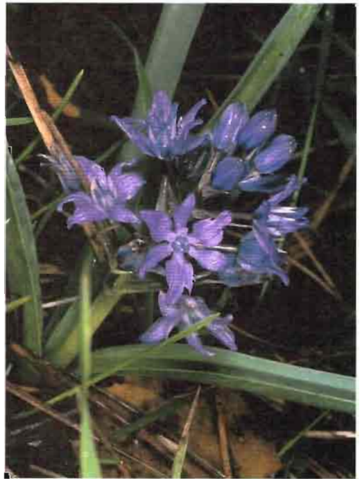
60. Scilla paui Lacaita