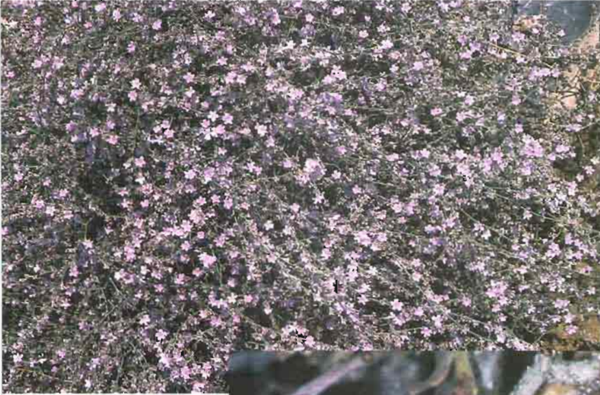
46. Crataegus orientalis Pall. ex M. Bieb. subsp. presliana K.I. Christensen