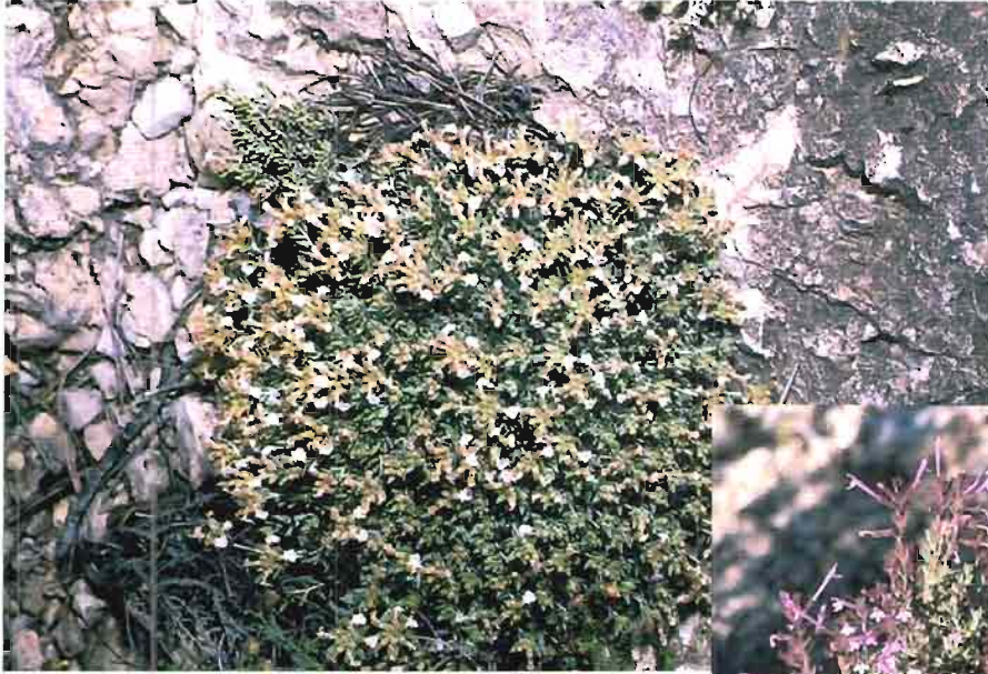
36. Teucrium rivas-martinezii Alcaraz & cols.