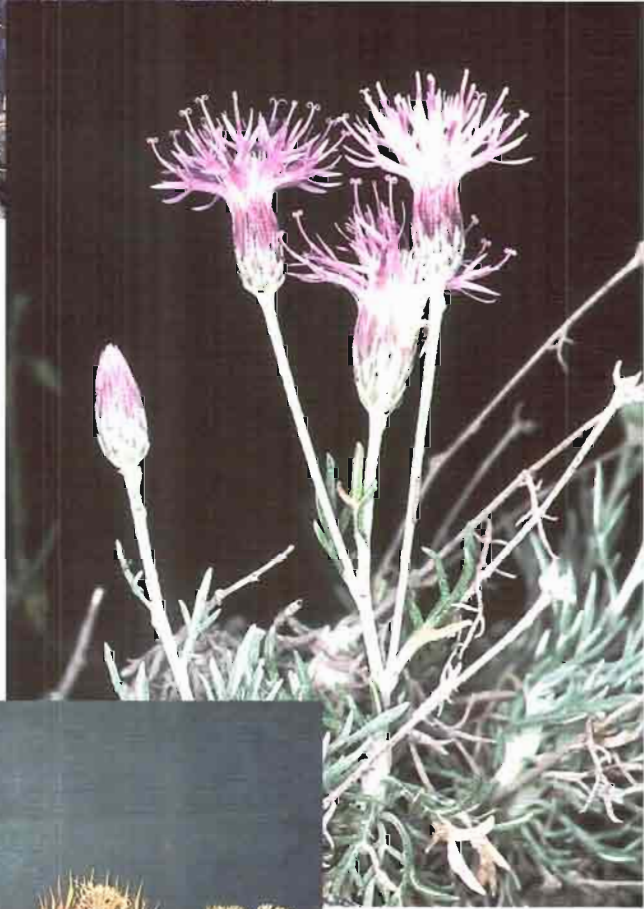
20. Onopordum nervosum Boiss. subsp. castellanum González Sierra, Pérez Morales, Penas & Rivas Mart.