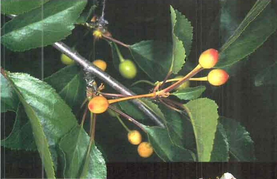
49. Prunus x fruticans Weihe