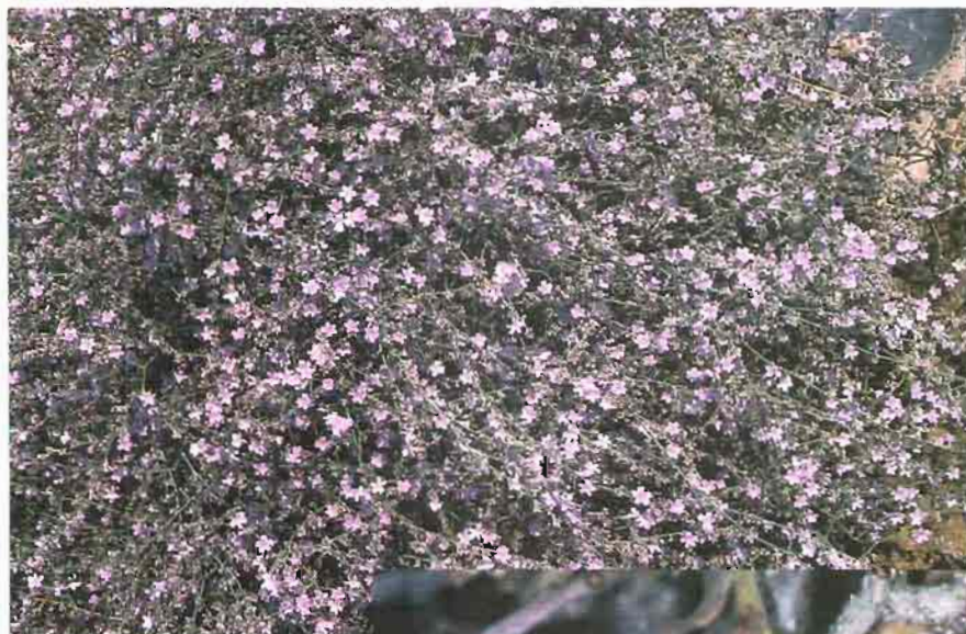
46. Crataegus orientalis Pall. ex M. Bieb. subsp. presliana K.I. Christensen