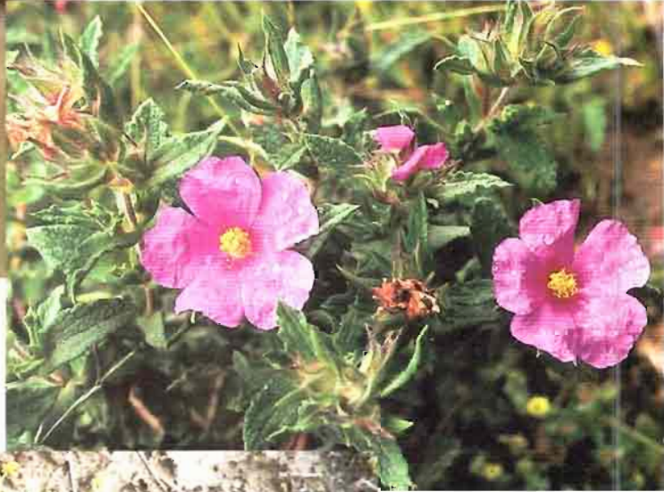
17. Helianthemum polygonoides Peinado, Mart. Parras, Alcaraz & Espuelas