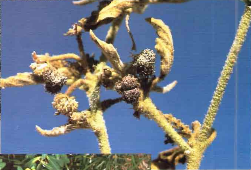
28. Chrozophora tinctoria (L.) Raf.