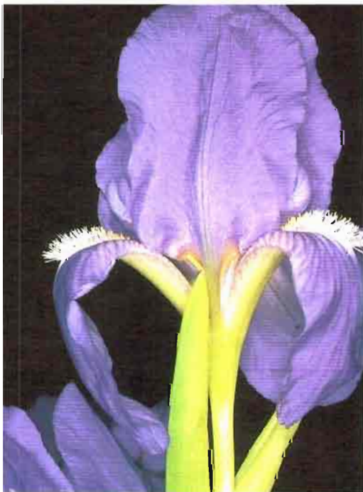
59. Iris subbiflora Brot.