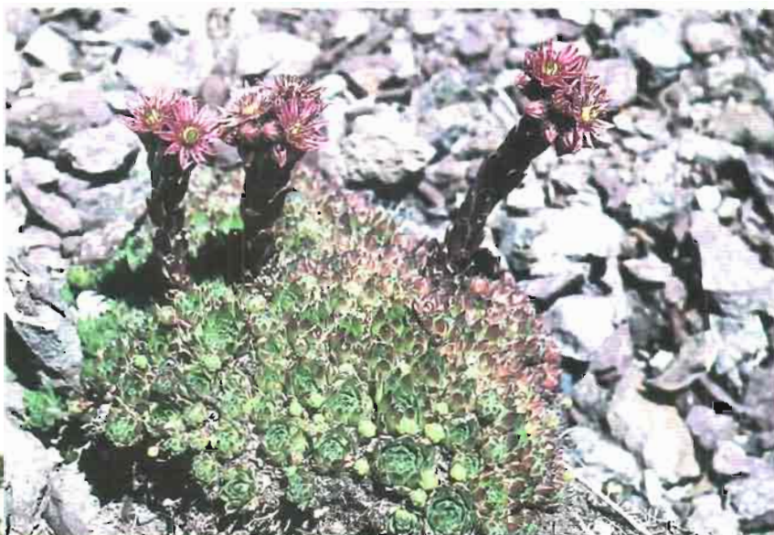
25. Lycocarpus fugax (Lag.) O.E. Schultz in Engl.