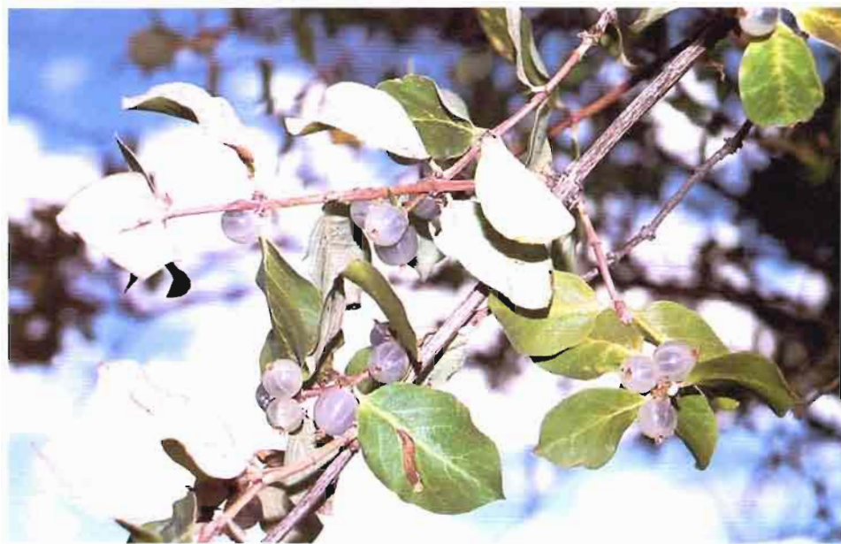
10. Lonicera arborea Boiss.