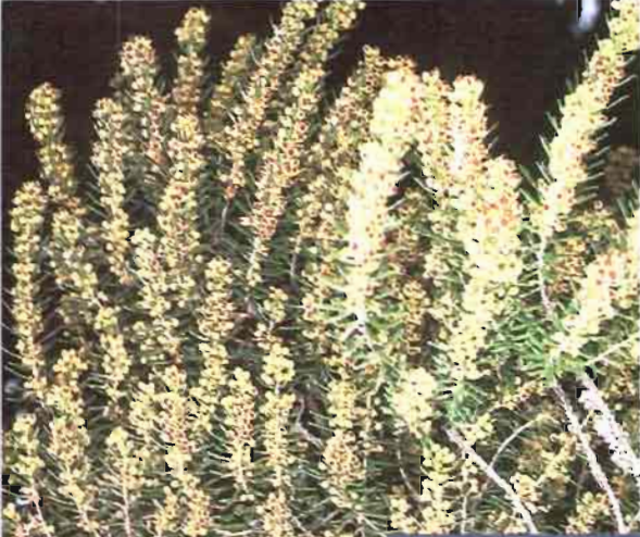
27. Erica scoparia L.