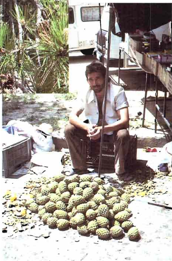
3. Pinus pinea L.