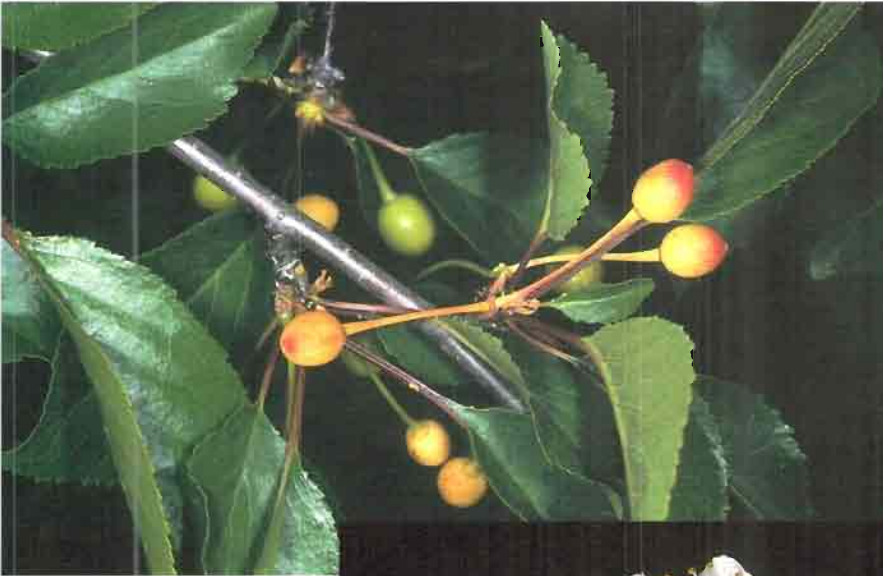
49. Prunus x fruticans Weihe