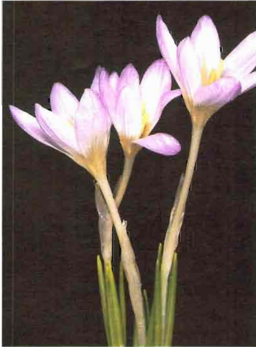
57. Crocus nevadensis Amo