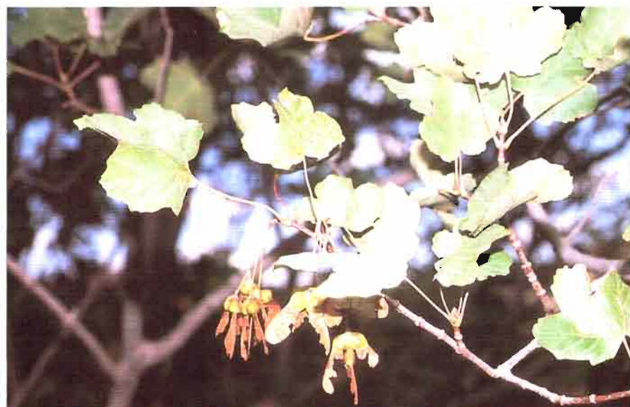
4. Acer granatense Boiss.