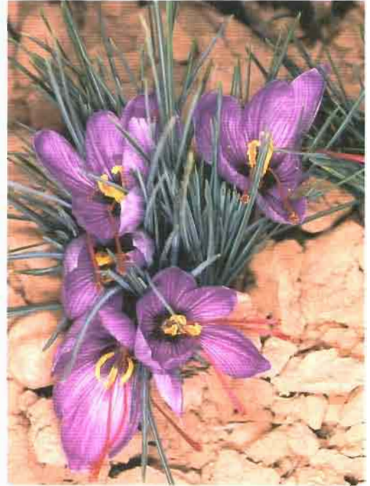
58. Crocus sativus L.