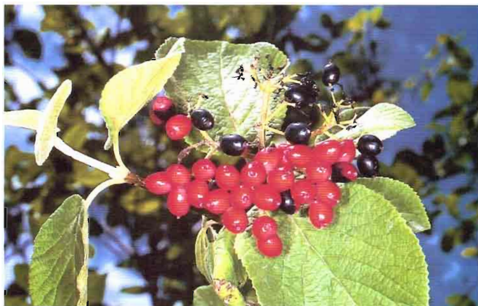
11. Viburnum lantana L.