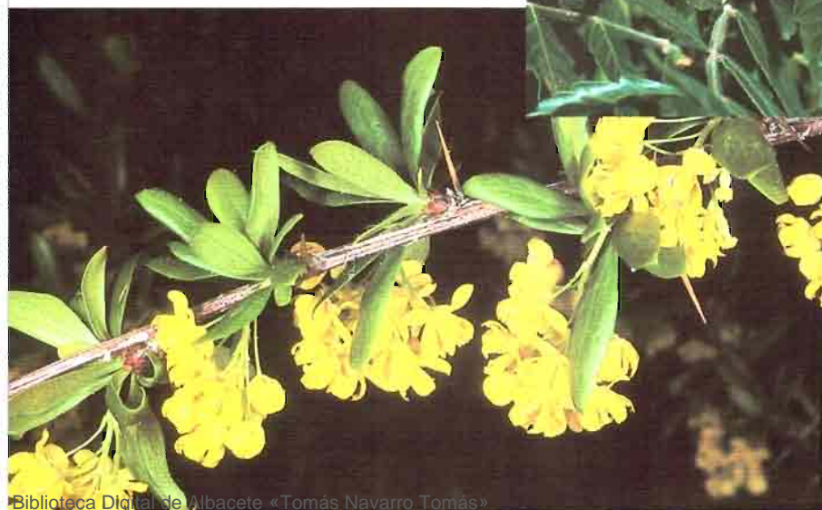
6. Berberis vulgaris L. subsp. australis (Boiss.) Heywood