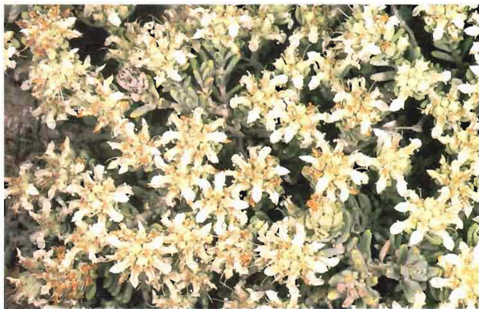
35. Teucrium leonis Sennen