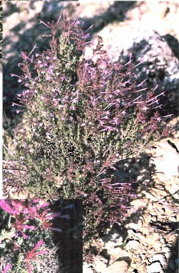
37. Thymus antoninae Rouy & Coincy