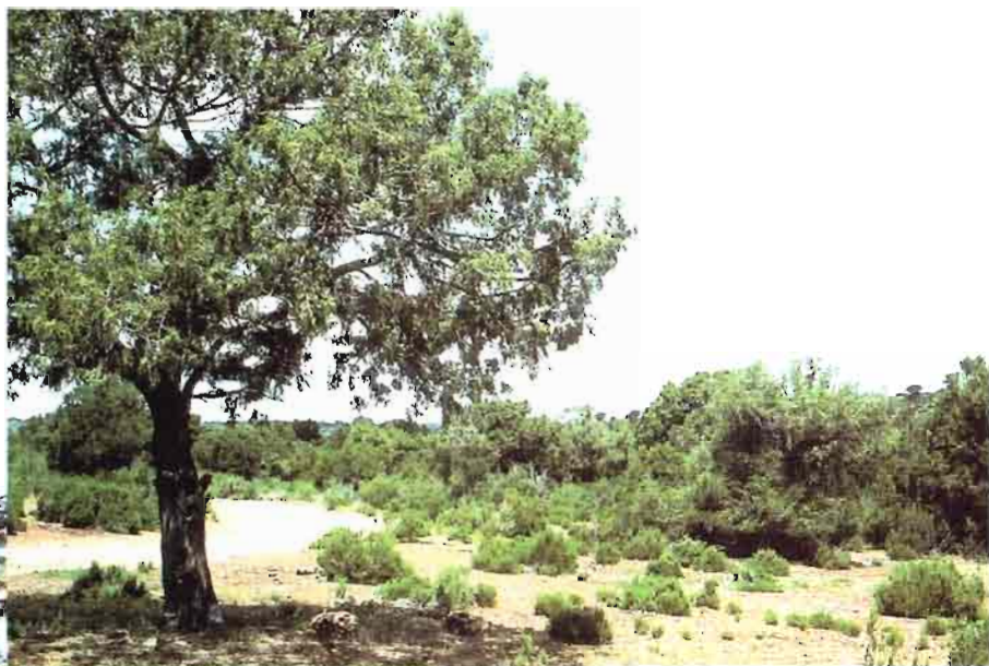
1. Juniperus thurifera L.