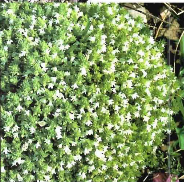
40. Thymus sabulicola Coss.