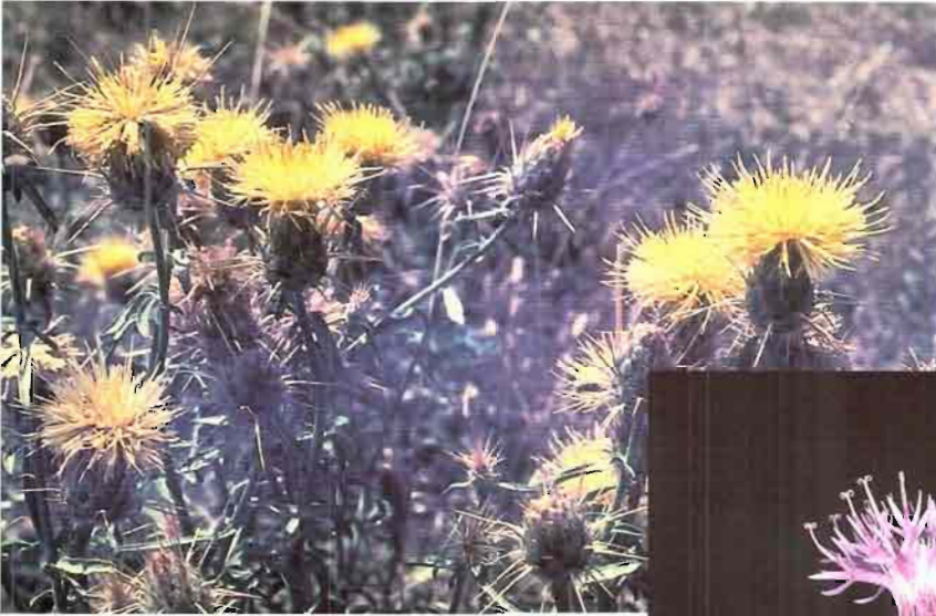
18. Centaurea ornata Willd.