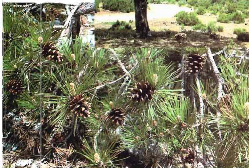
2. Pinus nigra Arnold subsp. mauretanica (Maire & Peyerimh.) Heywood