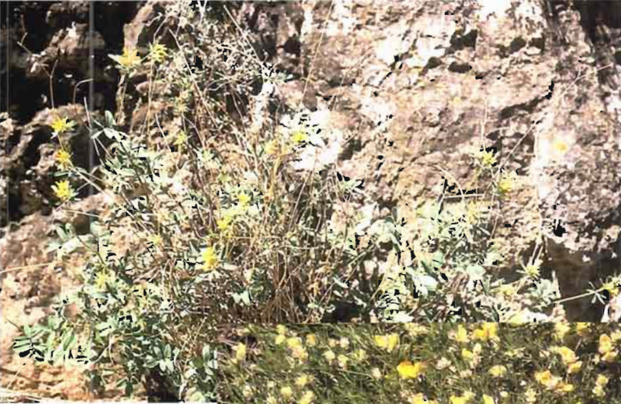
42. Anthyllis ramburei Boiss.