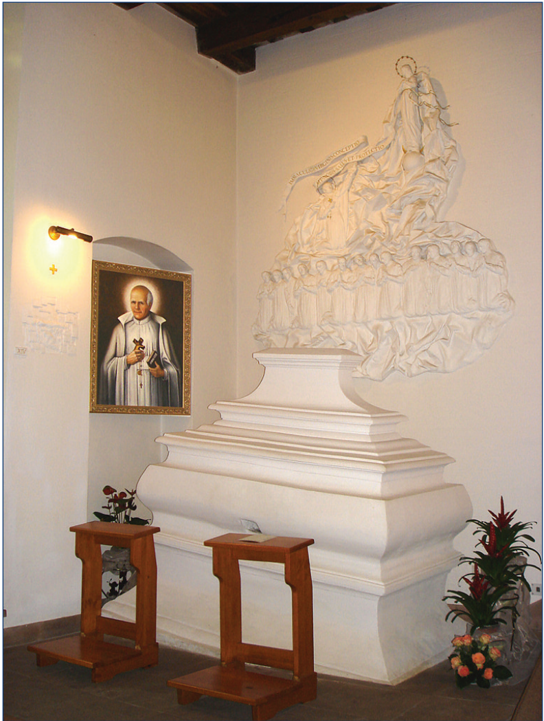
El sarcófago del 1766 en el Cenáculo del Señor, donde se encuentran los restos mortales de Padre Estanislao.