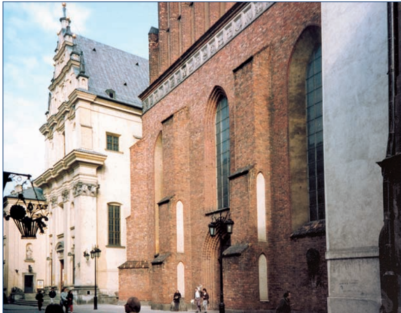
Varsovia — la iglesia de los jesuitas (edificio blanco) donde se encuentra la imagen de Nuestra Señora de la Gracia.