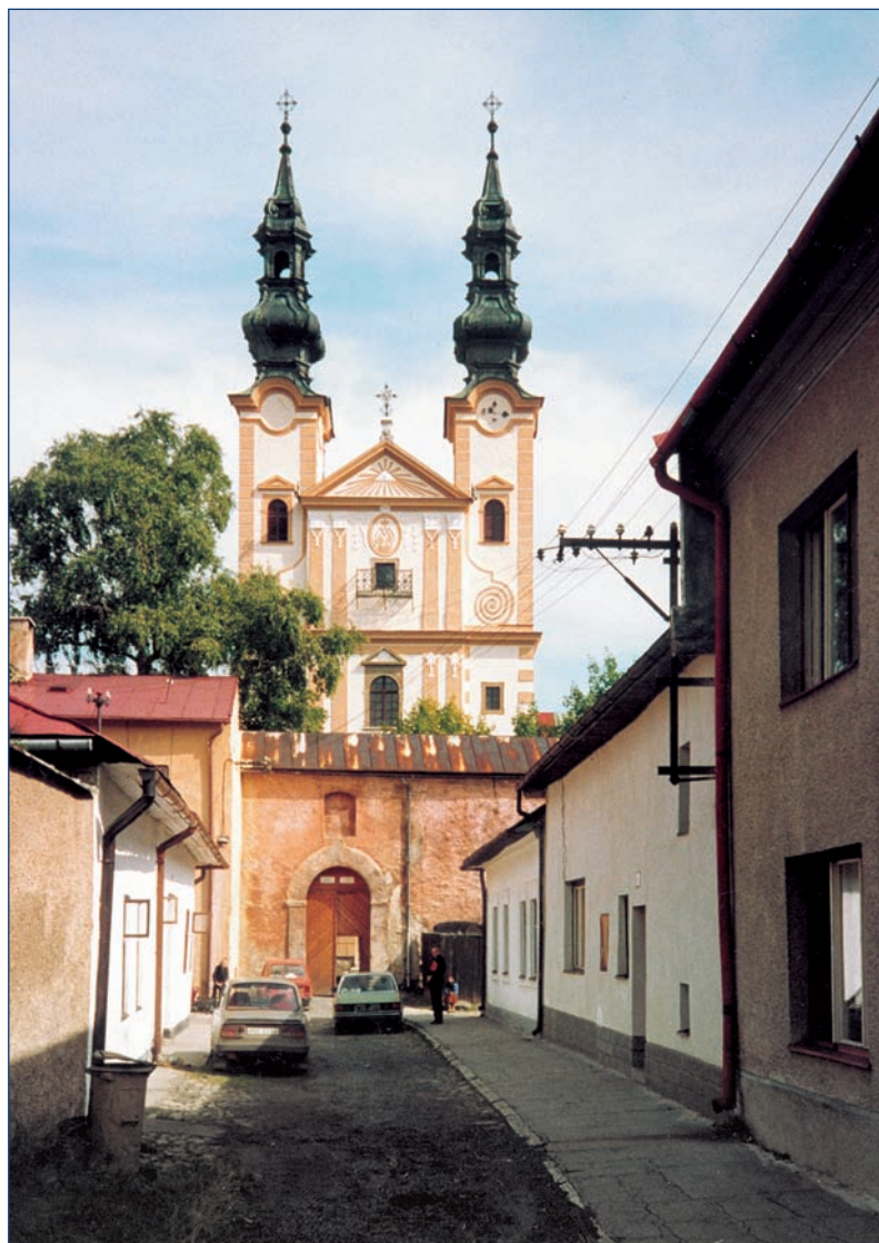
Podoliniec — la iglesia y el colegio de los escolapios. Padre Papczynski varias veces visitaba este lugar desde 1642.