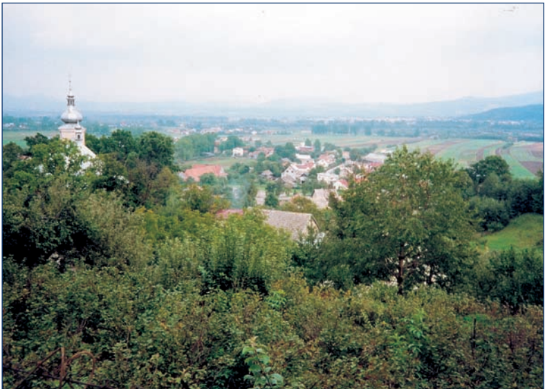
Podegrodzie — una vista de la iglesia parroquial y del pueblo donde nació Padre Estanislao Papczynski y donde pasó los primeros años de su vida.