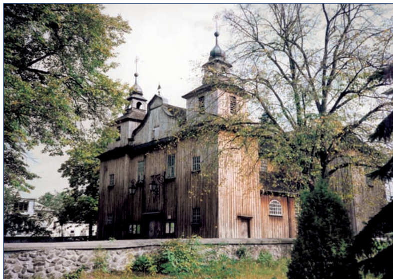
Gozlin — la antigua iglesia parroquial, 1776. Gozlin fue el tercer y último monasterio Mariano establecido durante la vida del Padre Papczynski.