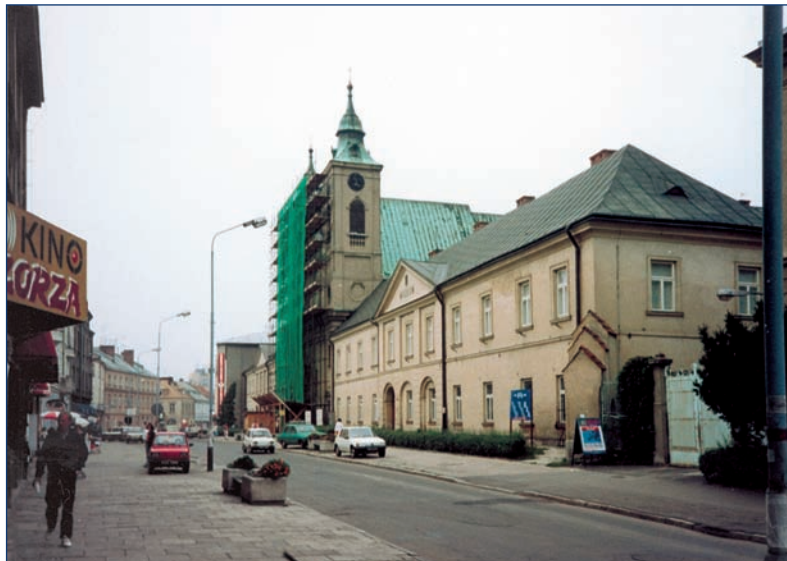
Rzeszow — la iglesia y el colegio de los escolapios. Aquí Padre Papczyński enseñaba retórica.