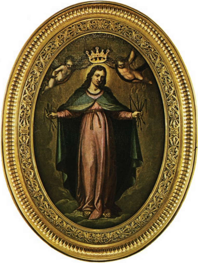
Varsovia — la imagen de Nuestra Señora de la Gracia, antes estuvo en la iglesia de los escolapios.