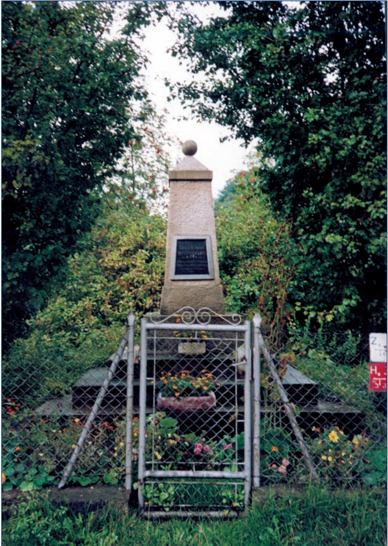
Podegrodzie — el monumento recordatorio donde antes era la casa de la familia de Padre Papczynski. Aquí, 18 de mayo de 1631 nació Padre Papczynski.