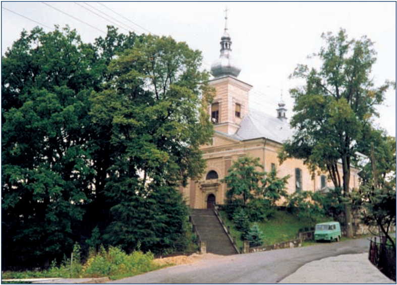
Podegrodzie — la iglesia parroquial, 1832.