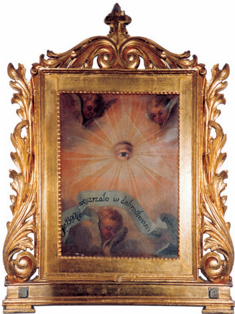
Gora Kalwaria (Marianki) — la imagen del Ojo de la Providencia de Dios, pintada en 1750. El Padre Papczynski le atribuía con frecuencia la fundación de su comunidad religiosa a la Divina Providencia.