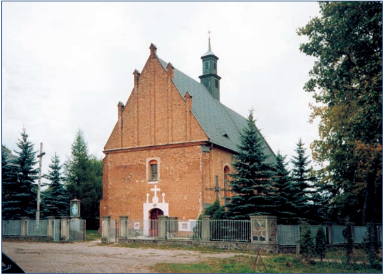
Chojnata — la iglesia de 1653 donde durante la predicación Padre Papczynski dio a conocer, a través de una visión que tuvo, la victoria de Juan III Sobieski en Chocim, 11 de noviembre de 1673.