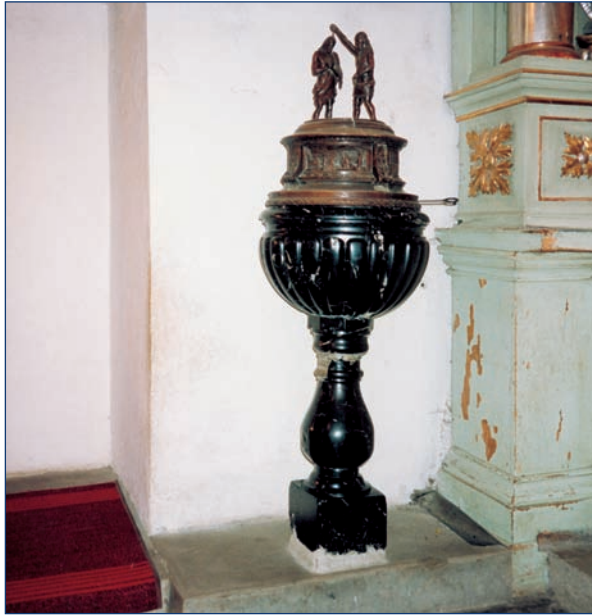
Podegrodzie — la pila bautismal de 1409 donde fue bautizado Padre Papczynski.