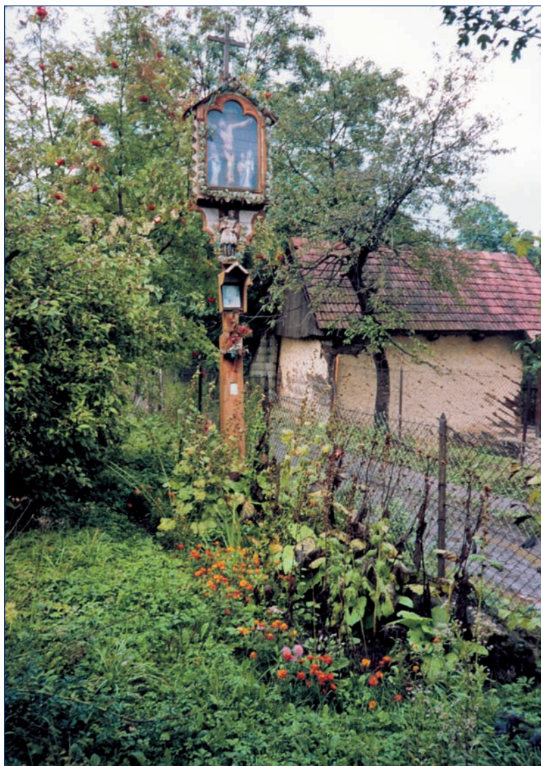
Podegrodzie — una pequeña capilla con la imagen de Cristo crucificado en el terreno que antes pertenecía a la familia de Padre Papczynski.