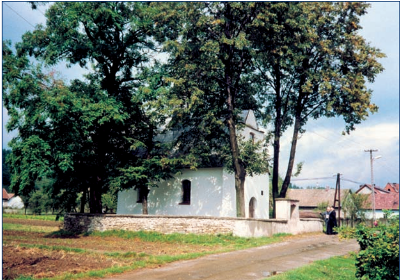
Podegrodzie — la iglesia de Santa Ana, 1631.