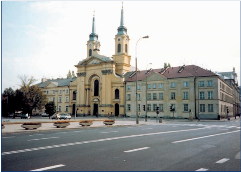
Varsovia — la iglesia de la guarnición, antes fue la iglesia de los escolapios, 1660.