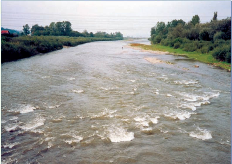
Podegrodzie — El río Dunajec al normal nivel del agua: ancho de 60 cm, con el fondo rocoso, con la corriente impetuosa.