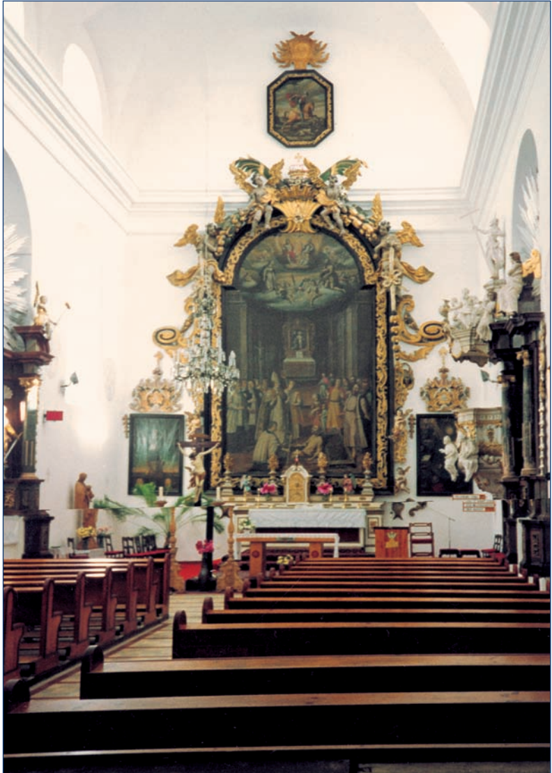
Podoliniec — el interior de la iglesia, con la grande imagen del Santo Estanislao, obispo.