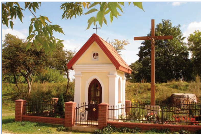
Lubocz — una capilla añeja en el centro del pueblo. El antiguo Lubocz, lugar de estancia de Padre Estanislao, después de irse de los escolapios.