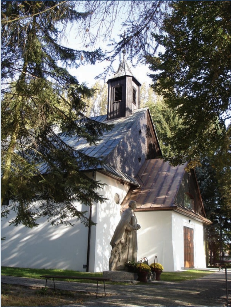
Góra Kalwaria (Marianki) — el frontón de la iglesia de Cenáculo del Señor, 1677. Los restos mortales del Padre Estanislao Papczyński son venerados en esta iglesia.