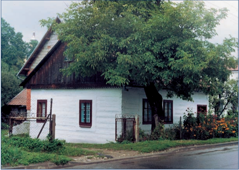
Podegrodzie — una casita vieja de madera que recuerda antigua arquitectura y se encuentra en la vecindad de la propiedad de la familia Papko, los padres de Padre Estanislao.