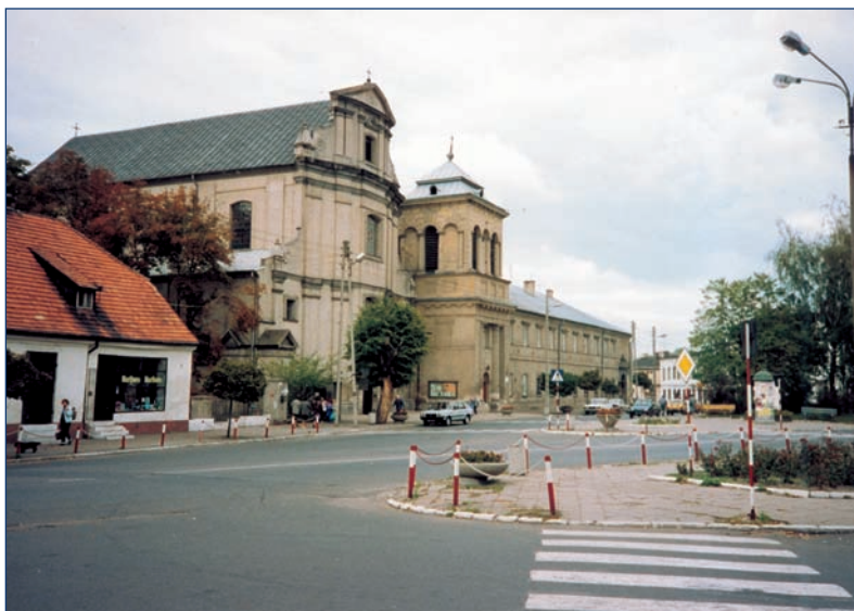
Rawa Mazowiecka — la iglesia y el colegio de los jesuitas de 1613, donde Padre Papczynski terminó la filosofía.