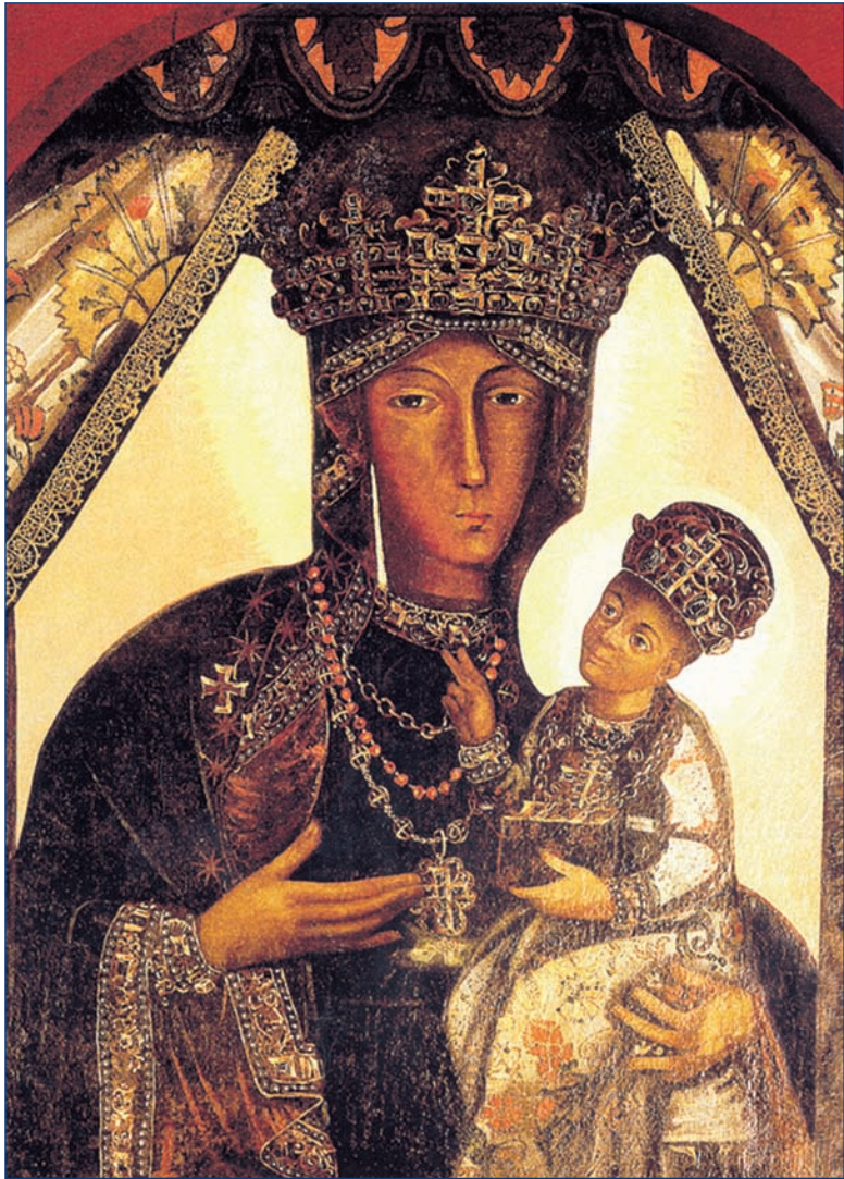
La imagen milagrosa de la Madre de Dios que Padre Papczynski trajo de su hogar.