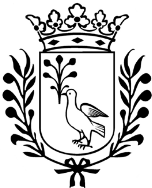
SIGILLUM PRIMUM MARIANORUM A SANCTO STANISLAO DESIGNATUM