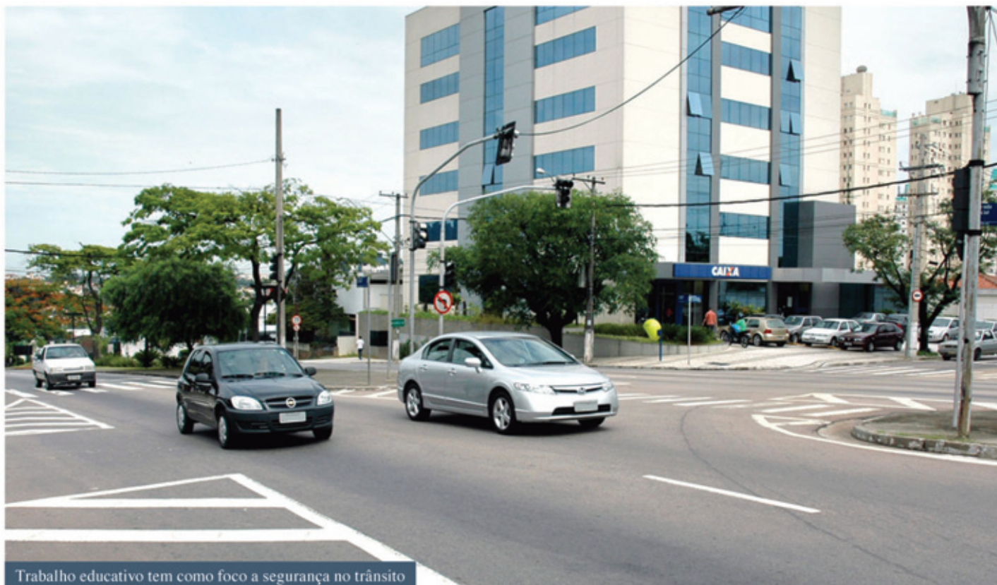
Trabalho educativo tem como foco a segurança no trânsito

A Divisão de Educação e Estatística possui projetos educativos que são desenvolvidos durante todo o ano em parceria com a ong internacional Global Road Safety Partnership (GRSP) e envolve os estudantes da rede municipal (Escola Segura), os motoristas profissionais que atuam com ônibus, táxis e vans escolares (Transporte Seguro) e ainda mantém o projeto Região Progressivamente Segura, nos bairros Almerinda Chaves e Novo Horizonte. A meta é fortalecer a comunicação e a boa convivência entre os usuários do