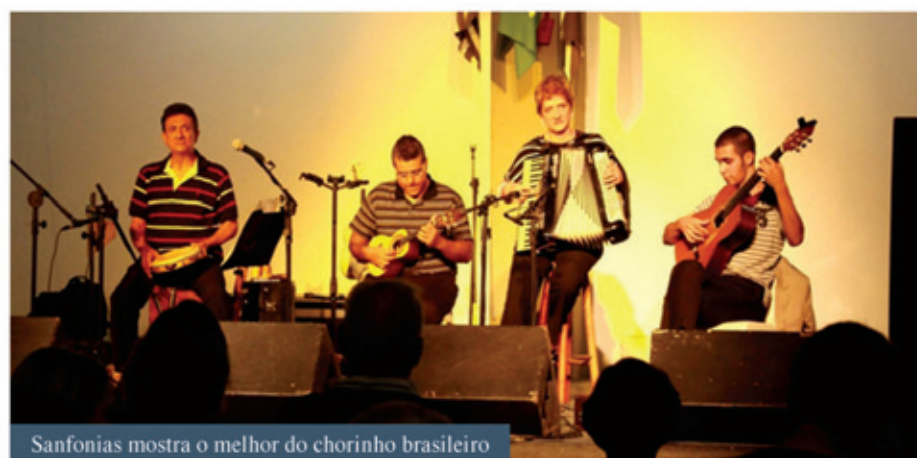
Sanfonias mostra o melhor do chorinho brasileiro