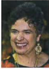
Senadora Beatriz Elena Paredes Rangel