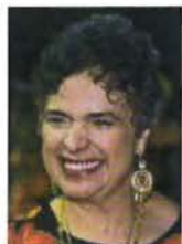
Senadora Beatriz Elena Paredes Rangel