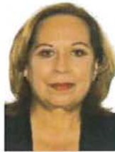
Senadora Bertha Alicia Caraveo Camarena