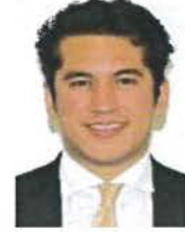
Senador Rogelio Israel Zamora Guzmán