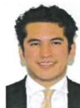
Senador Rogelio Israel Zamora Guzmán