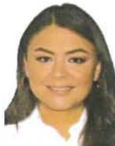
Senadora Sasil de León Villard