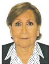
Senadora Ma. Guadalupe Covarrubias Cervantes