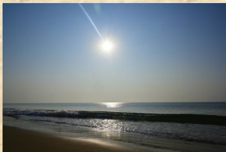
Cover Photo: Sun and sea at Puri