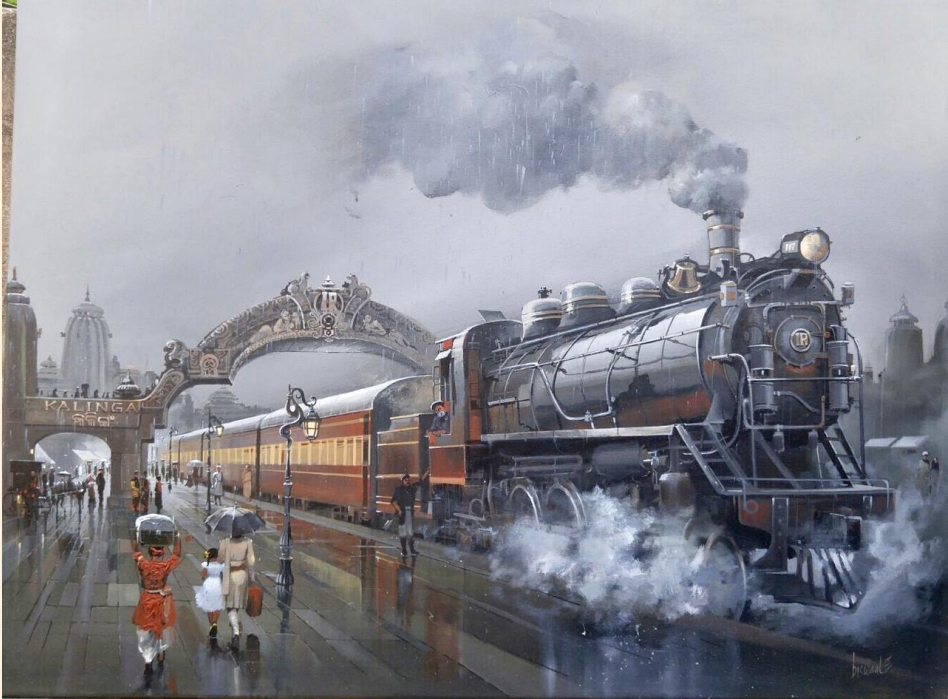
Acrylic on canvas, 36x48 inches