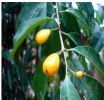
Folhas e frutos