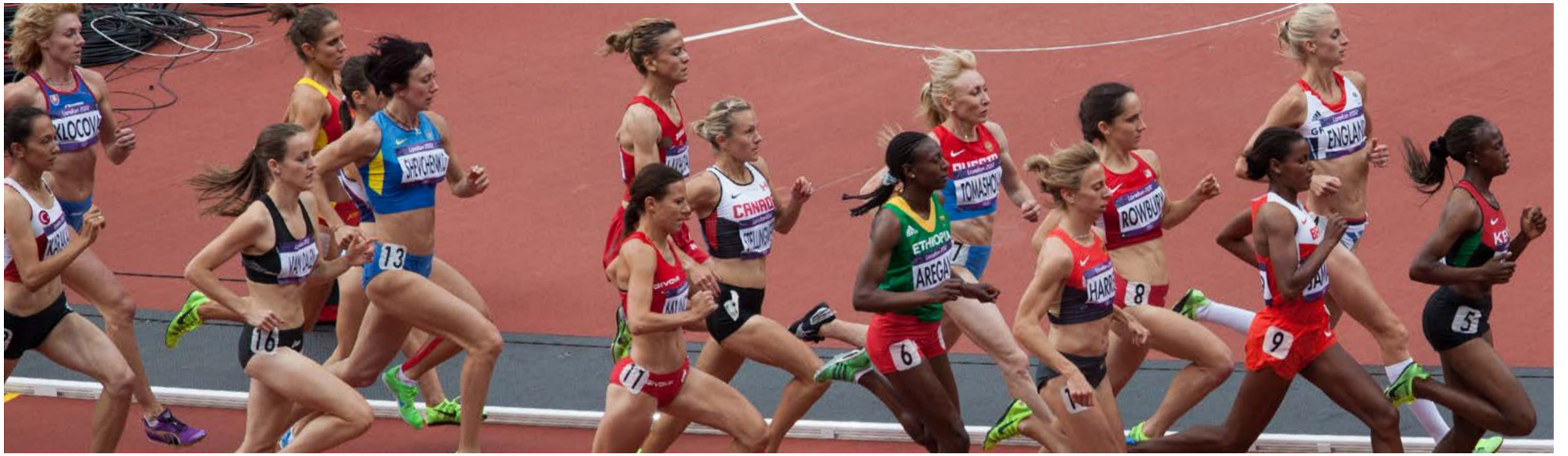
1.500 m femenins als Jocs Olímpics de Londres 2012