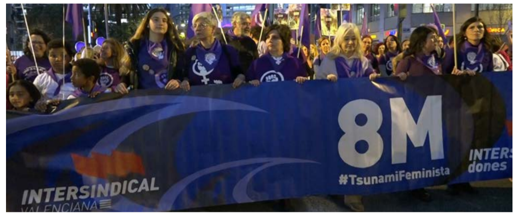
Manifestació a València el 8 de Març de 2023

Per aquests motius, i més, la Coordinadora Feminista de València va convocar una assemblea a la qual assistirem diverses