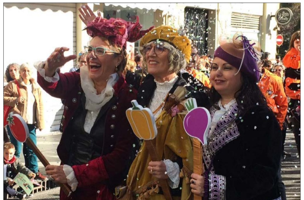
Les Magues de Gener el 2020

El negacionisme, a més, ha impregnat també les institucions valencianes i els pressupostos. Des que l'extrema dreta està en les Corts i en molts ajuntaments, és impossible fer pronunciaments institucionals per al 25 de novembre o el 8 de març. Açò ja fa cinc anys que ocorre. Però que el PP acabe acceptant