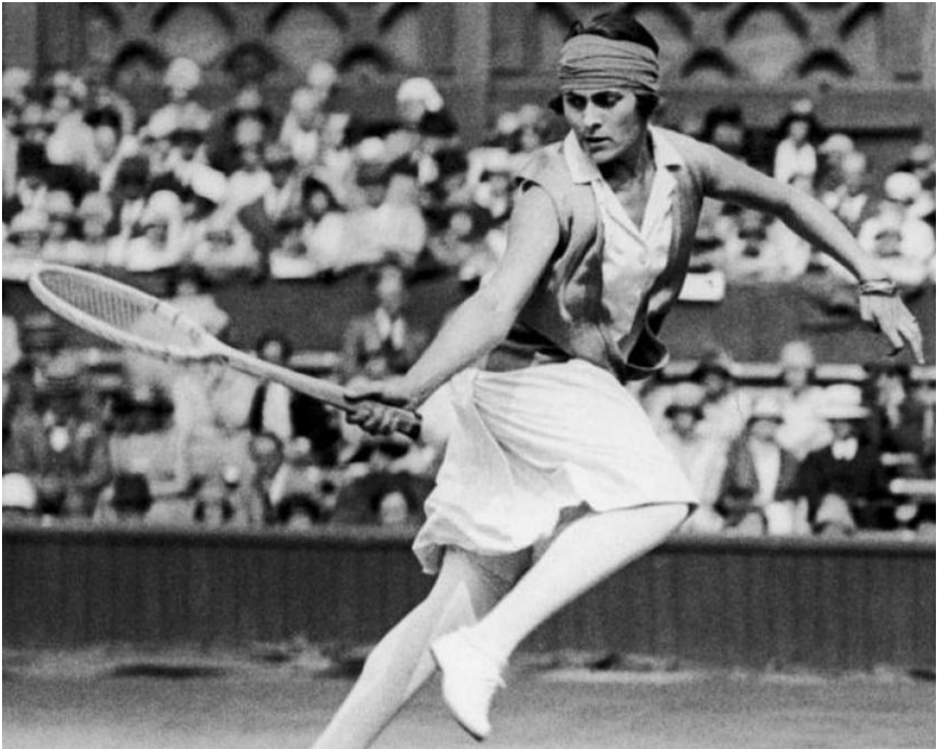
Lili Álvarez.