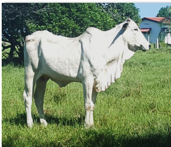
Figure 2. Taureau Nélore Figure 3. Vache Nélore