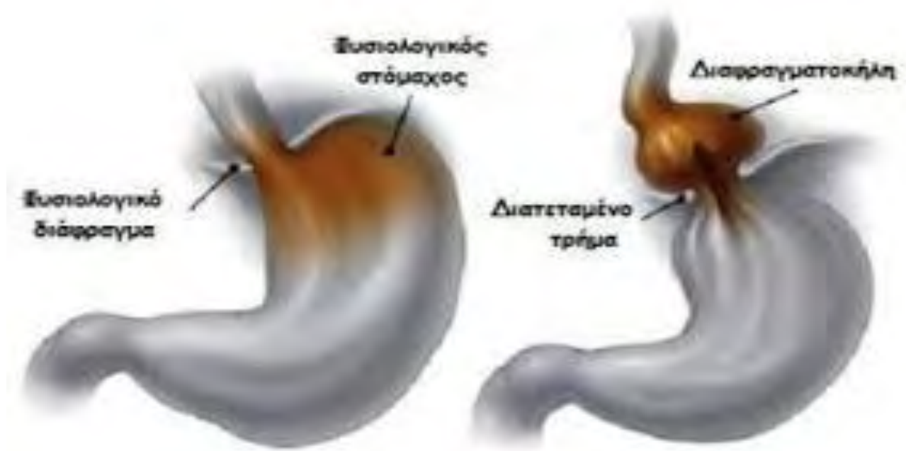
Εικόνα 2: Διαφραγματοκήλη