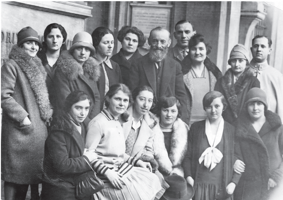
Giuseppe Peano e le allieve delle Conferenze Matematiche nel 1928.