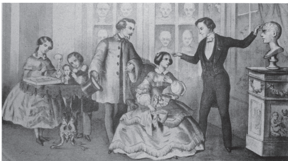
Studi sul cervello maschile e femminile (XIX sec.) all'epoca di Cesare Lombroso e delle sue figlie Gina e Paola.