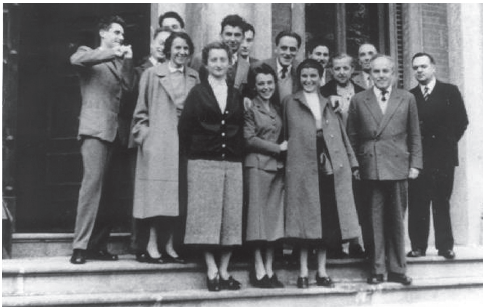
Un gruppo di fisici nel 1954, di fronte al portone dell'Istituto.