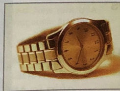
4. su esposo