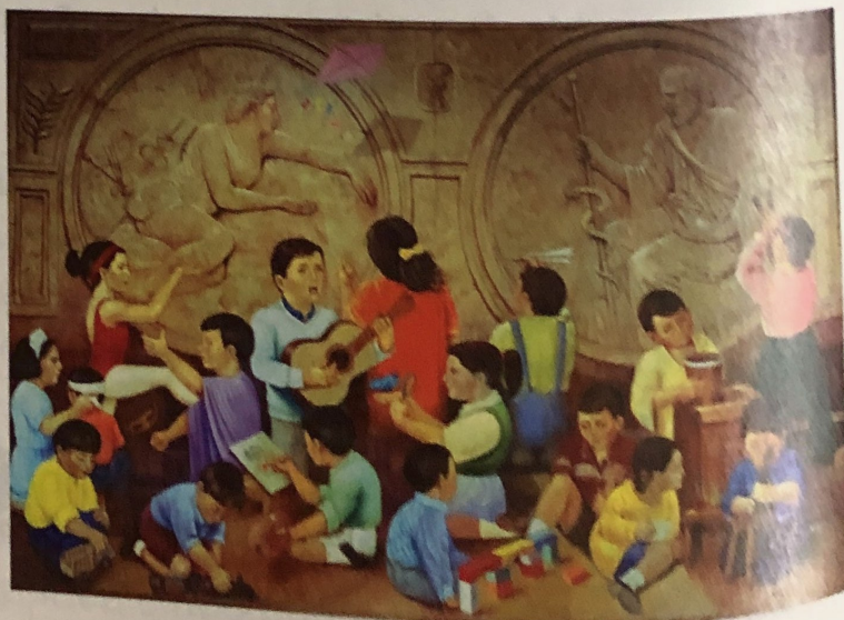
▲ "Los niños del futuro" (1998)