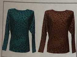
1. mi madre