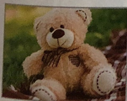
2. mis hermanitas