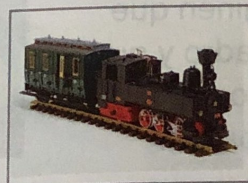
5. mis primos