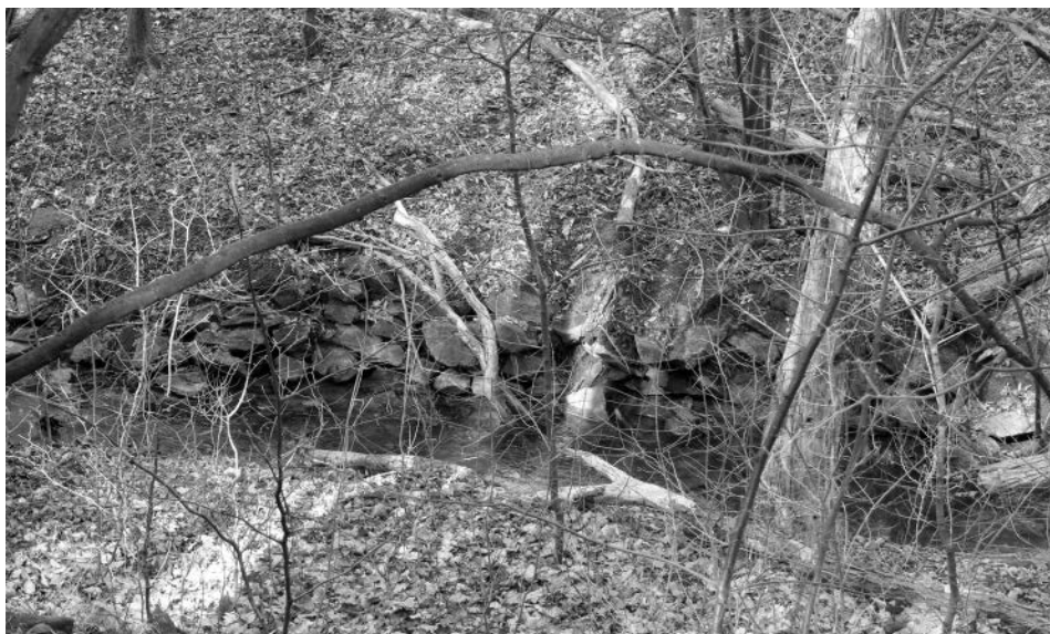
Obr. 4. Porušená hráz bývalého rybníka pod ostrožnou Suchohrdly „Starý zámek“.

dobí se ve staré sídelní krajině stabilizuje sídelní struktura, která s výjimkou zaniklých vsí přetrvává po zbytek středověku a po celý novověk.