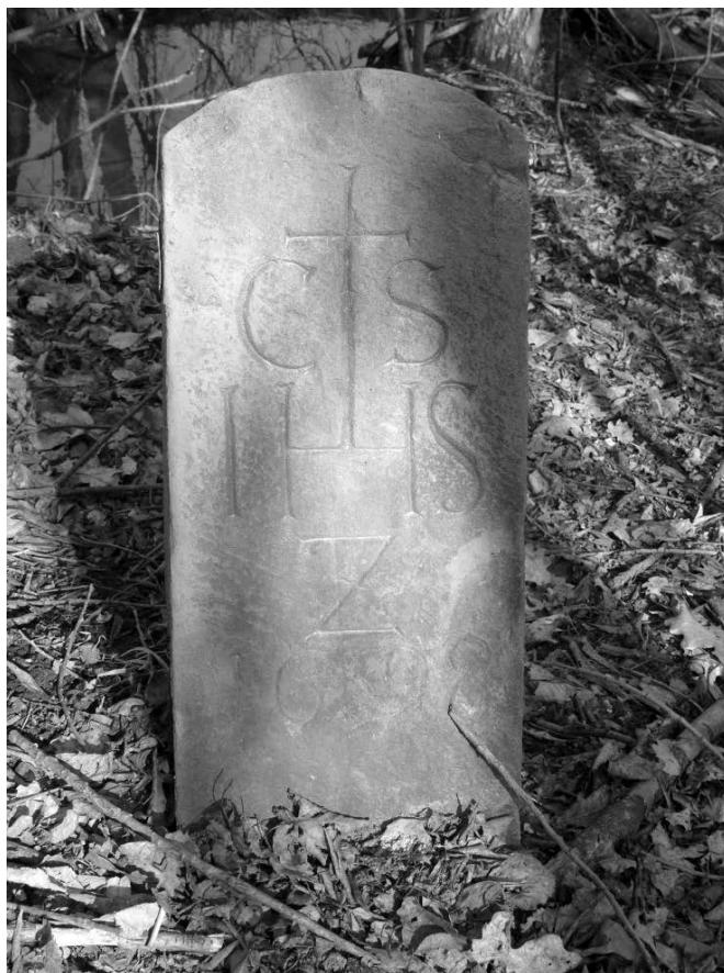
Obr. 3. Suchohrdly. Hraniční kámen se znakem jezuitského řádu a letopočtem 1698.

eneolitu. V prostoru Tvořihrázského lesa jsou ale doloženy i další polohy s blíže nedatovaným osídlením z pozdní doby kamenné (Suchohrdly „u cesty do Kuchařovic). Také ve starší literatuře, ač bez přesnější lokalizace, jsou zmiňovány stopy eneolitického osídlení v Purkrábském lese ( Podborský – Vildomec 1972, 213 ). Z tohoto úseku pravěku je ale v mikroregionu známo osídlení i mimo tyto zvýšené polohy, např. na poloze Těšetice-Kyjovice „Sutny“ (obr. 2: C) 4 .