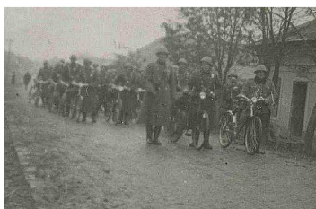
(obr. 13: Ústup vojáků a SOS z Podkarpatské Rusi)

Loučím se s Tebou, Podkarpatské Rusi (15.3.1939)