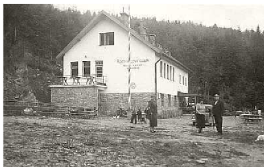
(obr.5.: Rozsypalova chata)

KČST inicioval i vydávání nejrůznějších průvodců, které měly nalákat turisty na Podkarpatskou Rus, protože ve dvacátých letech byla tato oblast ještě hodně na okraji zájmu. Příčinami tohoto stavu byly vedle odlehlosti a špatné dostupnosti, nedostačujícího a málo vyhovujícího ubytování i zakořeněné představy o Podkarpatsku jako o nehostinné zemi podobné Sibiři, kde hrozí nebezpečí divé zvěře a velká pravděpodobnost loupežného přepadení. 53 Časté senzační zprávy v novinách o útocích vlků a medvědů na lidi (tyto zprávy byly z 99,9% vymyšleny) také neprospívali zrovna velkému turistickému zájmu.