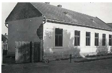
(obr.7: Cikánská škola v Užhorodě)