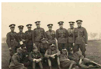
(obr.12: Ze cvičení SOS)