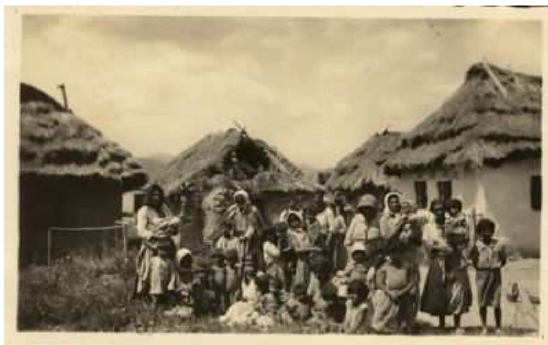
(obr.8: Cikánská čtvrť)

Náklady na vybavení a zařízení školy dosáhly 65 000 Kč, z toho 10 000 přispěl i T.G. Masaryk.