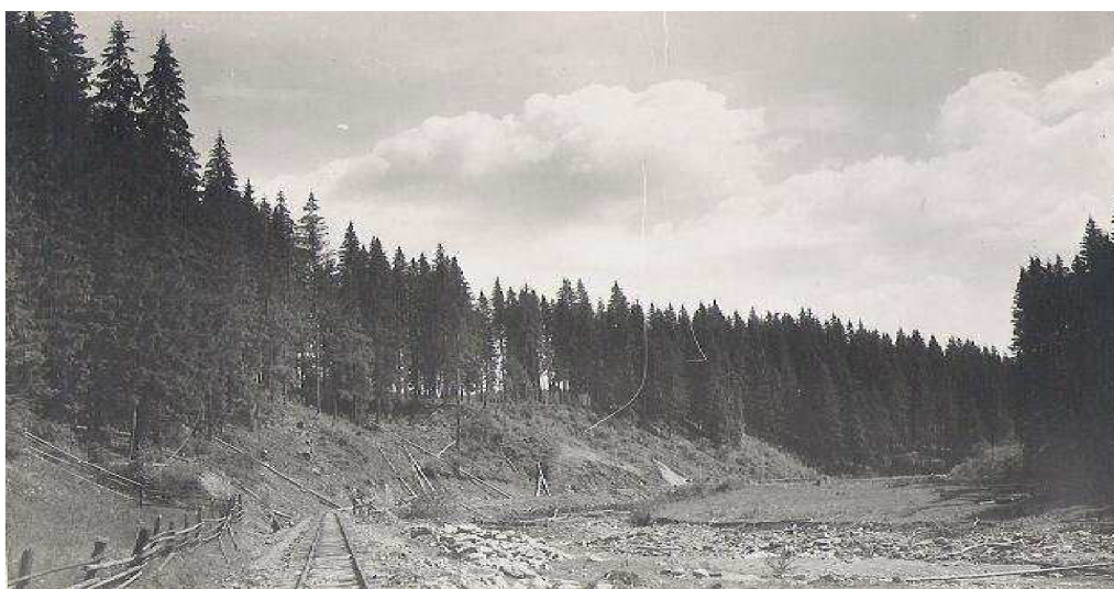
(obr 11: Stavba lesní dráhy v Jasini.)

odlišnými poměry než v Čechách. Řeky měly ponejvíce okolo 70 kilometrů, ale na této trase byl výškový rozdíl 1 000 metrů, neboť tekly z vysokých karpatských hor do nížin. Tím pádem byly velmi prudké a dravé. Do roku 1933 bylo upraveno 100 kilometrů toků, 33 kilometrů bystřin zahrazeno a plošné meliorace byly na 17 000 hektarech, přičemž aktivní v provádění prací byli hlavně nové české kolonie. Přepokládalo se, že po úspěšném vyřešení vodohospodářské meliorace podkarpatoruské nížiny, naše zemědělství bude krýt nejen spotřebu naší země, jak tomu až doposud nebylo, nýbrž Podkarpatská Rus stane se též zemí exportní, stane se jednou ze zásobáren československého státu. 82