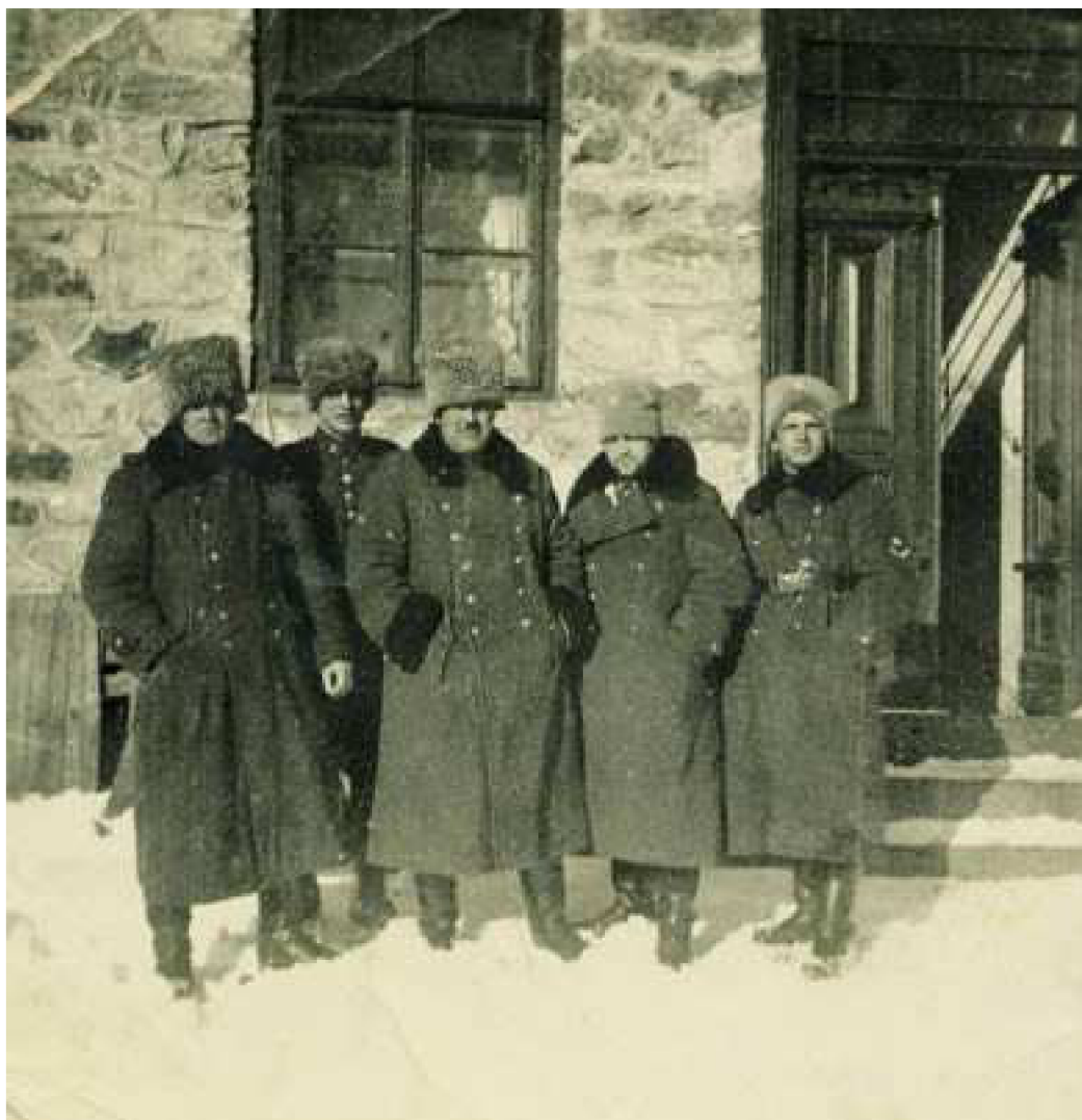
(obr.3: Před služebnou Finanční stráže na Podkarpatské Rusi)