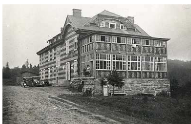
(obr. 6: Turistická chata v Užockém průsmyku)

Velkou plus pro turisty z Československa bylo, že se na Podkarpatské Rusi dorozuměli česky, jak potvrzuje i turistický průvodce Jaroslava Dostála: Úplně vystačíme s češtinou. Židé se rychle přizpůsobili novým poměrům, jejich děti prošly novými (českými pozn.-aut.) školami, Rusínům dobře rozumíme, mnozí pracovali v historických zemích v lesích, mladší byli na vojně a hovoří česky. 54