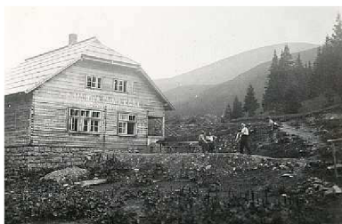
(Obr.4.: Chata klubu českých turistů na Hoverle)

Takto pochmurnou báseň napsal S.K. Neumann za svého prvního putování po Podkarpatské Rusi. On sám se považoval za zdatného turistu, on je tedy ten „chodec neznavený, co hlubina ho láká“. I když sám rád chodil, o druhých většinou valného mínění neměl, to dokazuje i to, že turisty dělil do dvou skupin. První skupinu nazýval lovci kilometrů. Takoví turisté chodí jen proto, aby chodili, nekochají se krásami přírody, naopak se ženou za rekordy v počtu ujitých kilometrů a navštívených míst. Druhá skupina jsou výpravy s průvodcem. Za deset dní projdou Podkarpatskou Rus a navštíví všechny pamětihodnosti. Neumann o nic tvrdil, že efekt by byl stejný, kdyby prodáván byl těm lidem balíček pohlednic, které by si mohli doma pozorně prohlédnouti, , nebo byl pro ně pořízen dobrý film, (...) ovšem nemohli by si pak říci, že byli v Jasine, Rachově, Užhorodu, Užoku atd., což je pro ně bezpochyby to nejdůležitější. 51