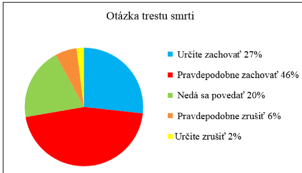
Graf 5: Percentuálne vyjadrenie sa respondentov na alternatívnu formu otázky ohľadom trestu smrti 71

Po preformulovaní v základe rovnakej otázky je možné vidieť značný spád z 83% respondentov, ktorých vláda rada označuje ako zástancov trestu smrti.