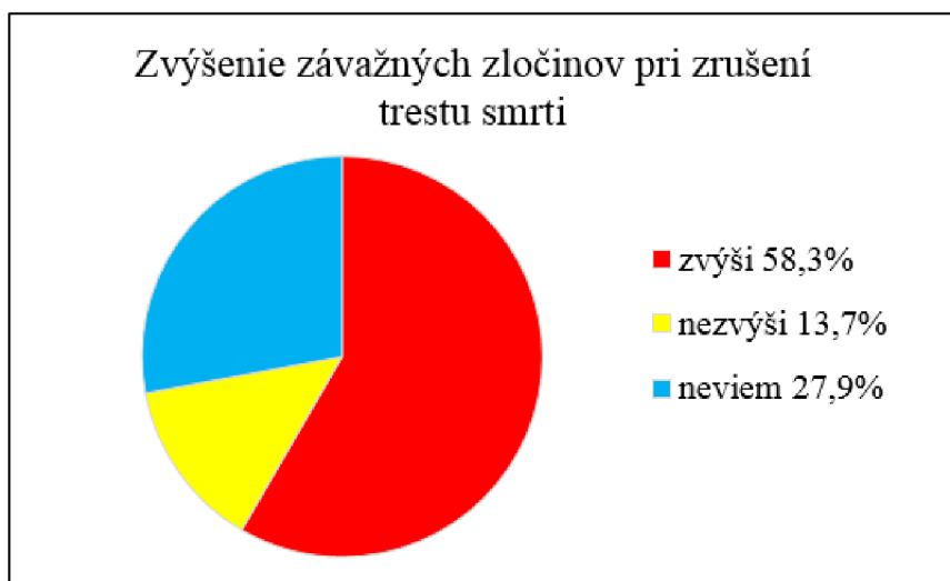
Graf 4: Percentuálne vyjadrenie sa japonskej verejnosti k otázke zvýšenia závažných zločinov po zrušení trestu smrti 56

Druhá oblasť prieskumu skúma mienku ohľadom jej funkcie odradenia druhých od páchania trestných činov: „Zvýši sa podľa Vás počet závažných zločinov v prípade zrušenia trestu smrti, alebo nie?“ 55