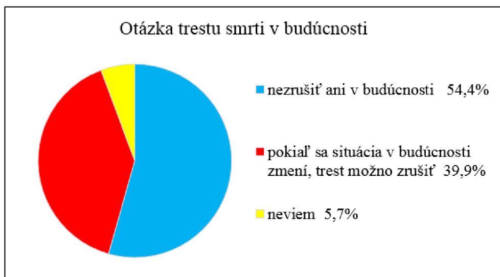
Graf 3: Percentuálne vyjadrenie sa japonskej verejnosti k otázke trestu smrti v budúcnosti

Túto otázku pokladám za problematickú z dôvodu jej abstraktnosti. Prieskum totiž bližšie nešpecifikuje, čo si má respondent vyložiť pod slovným spojením „zmena situácie“ ( džókjó ga kawareba ). Je ťažké odhadnúť, čo presne prieskum sleduje takouto nekonkrétnou otázkou, a ešte ťažšie odhadnúť, na základe čoho respondenti vyjadrili svoj názor v odpovedi. Za oveľa lepšie položenú otázku považujem jednu z nadchádzajúcich otázok prieskumu, ktorá zisťuje u respondentov ich názor na ponechanie či zrušenie trestu smrti v prípade zavedenia doživotného trestu bez možnosti podmieneného prepustenia. Táto otázka v sebe predkladá konkrétnu „zmenu situácie“ v budúcnosti, na základe ktorej si respondenti môžu utvoriť svoj názor.