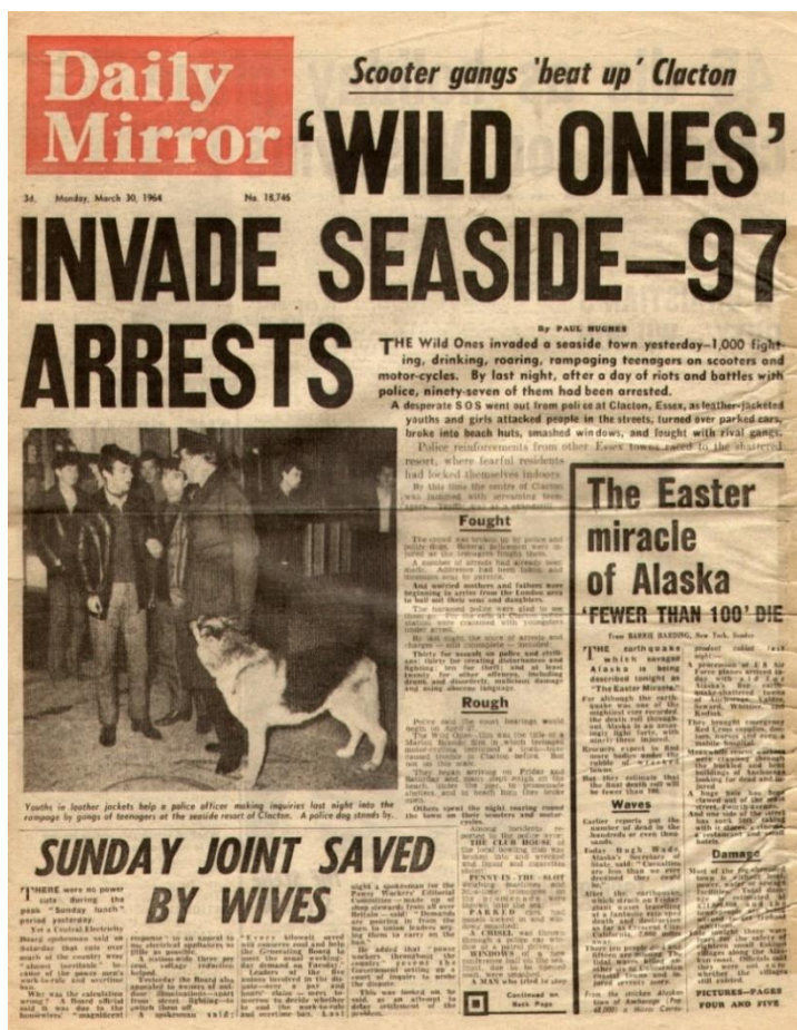
Obr. 2 Titulní strana deníku Daily Mirror z pondělí 30. března 1964 47

Nepokoje mladých a vandalismus byly ústředním tématem Britského tisku ještě následující 3 roky. Každý další případ nepokoju odstartoval další mediální sen- zaci a smršť článků, které stále opakovaly stejná fakta, i za cenu toho, že byla ne- pravdivá.