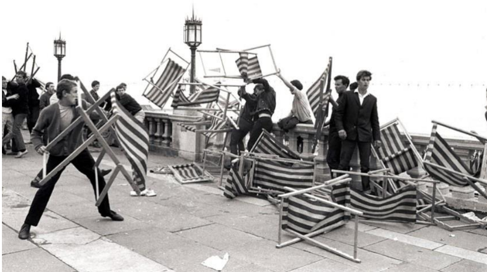
Obr. 1 Plážové nepokoje mezi Mods a Rockery na Whitsun Bank Holiday 42 1964. 43