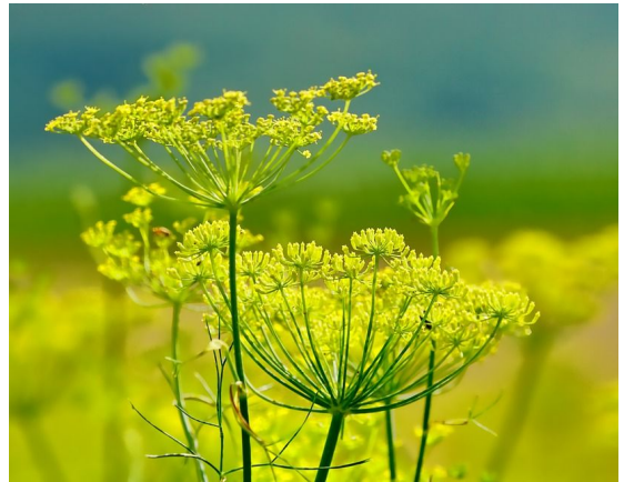
Foeniculum vulgare ssp vulgare