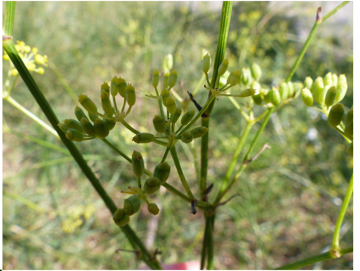
Foeniculum vulgare ssp. pipéritum