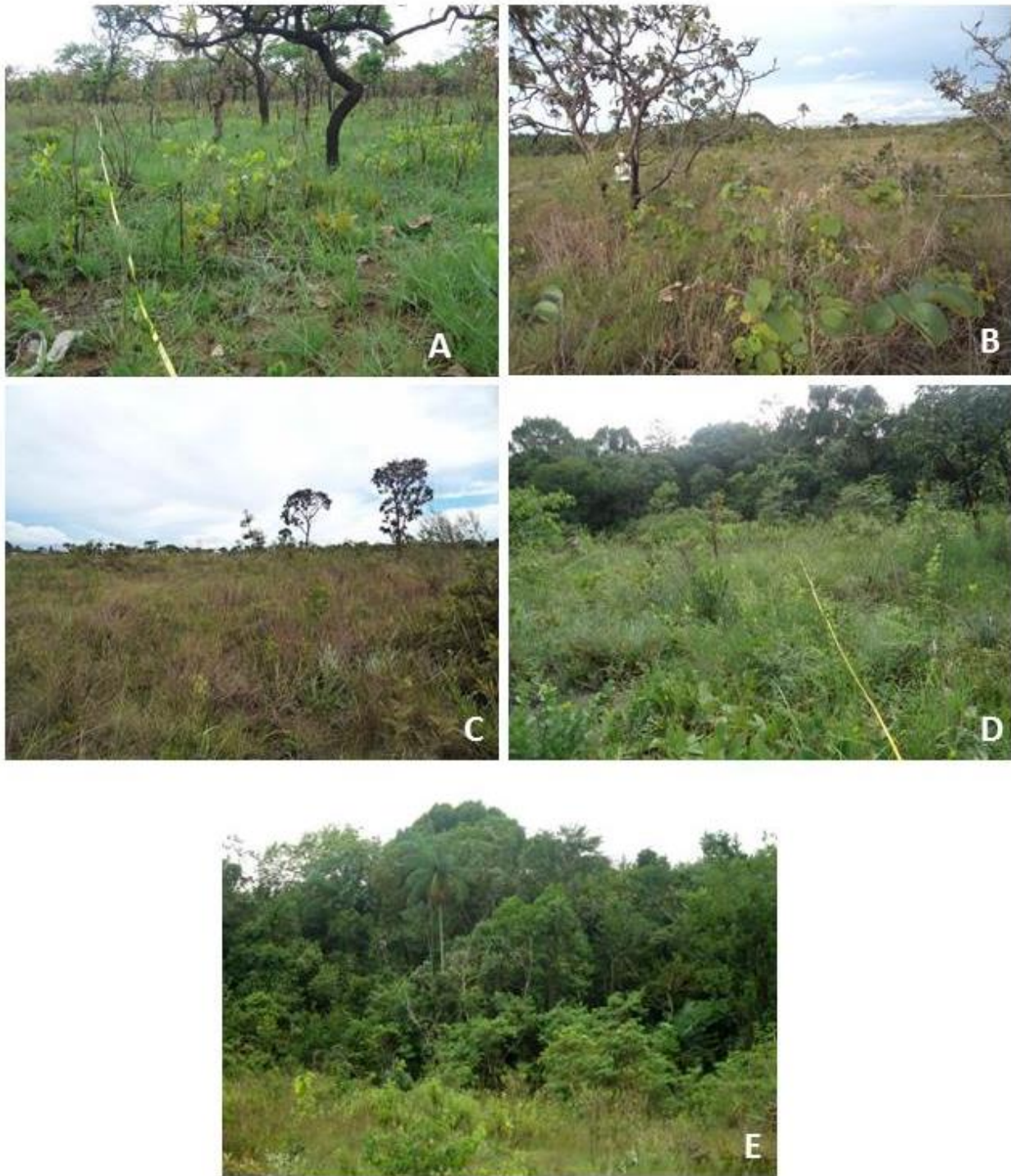
Figura 2. A. Cerrado sentido restrito na parcela 7. B - C. Campo de murundum nas parcelas 8 e 9. D. Campo sujo na parcela 10. E. Mata de galeria na parcela 11.

As amostras coletadas foram depositadas no herbário do Jardim Botânico de Brasília (HEPH). As plantas foram identificadas in loco e, quando não, foram comparadas com os acervos dos herbários da Embrapa Recursos