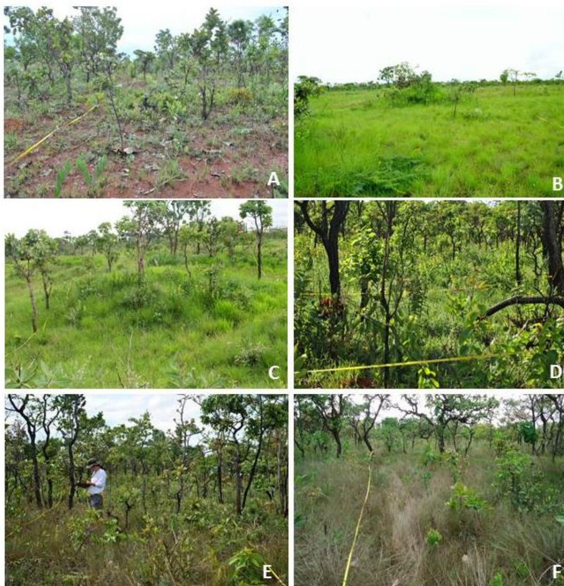
Figura 1. A, D, E e F. Cerrado sentido restrito nas parcelas 1, 4, 5 e 6. B e C. Campo com murundum nas parcelas 2 e 3.

estratificada e aleatória (Figuras 1 e 2, Tabela 1). A estratificação foi embasada nas fisionomias, ao dividir os estratos em fisionomias savânicas e campestres, cinco parcelas foram sorteadas no cerrado sentido restrito e as outras cinco nas áreas de campo sujo e campo com murunduns. Nas áreas florestais não foram estabelecidas parcelas, o levantamento foi realizado através do método de caminhamento (Filgueiras 1994).