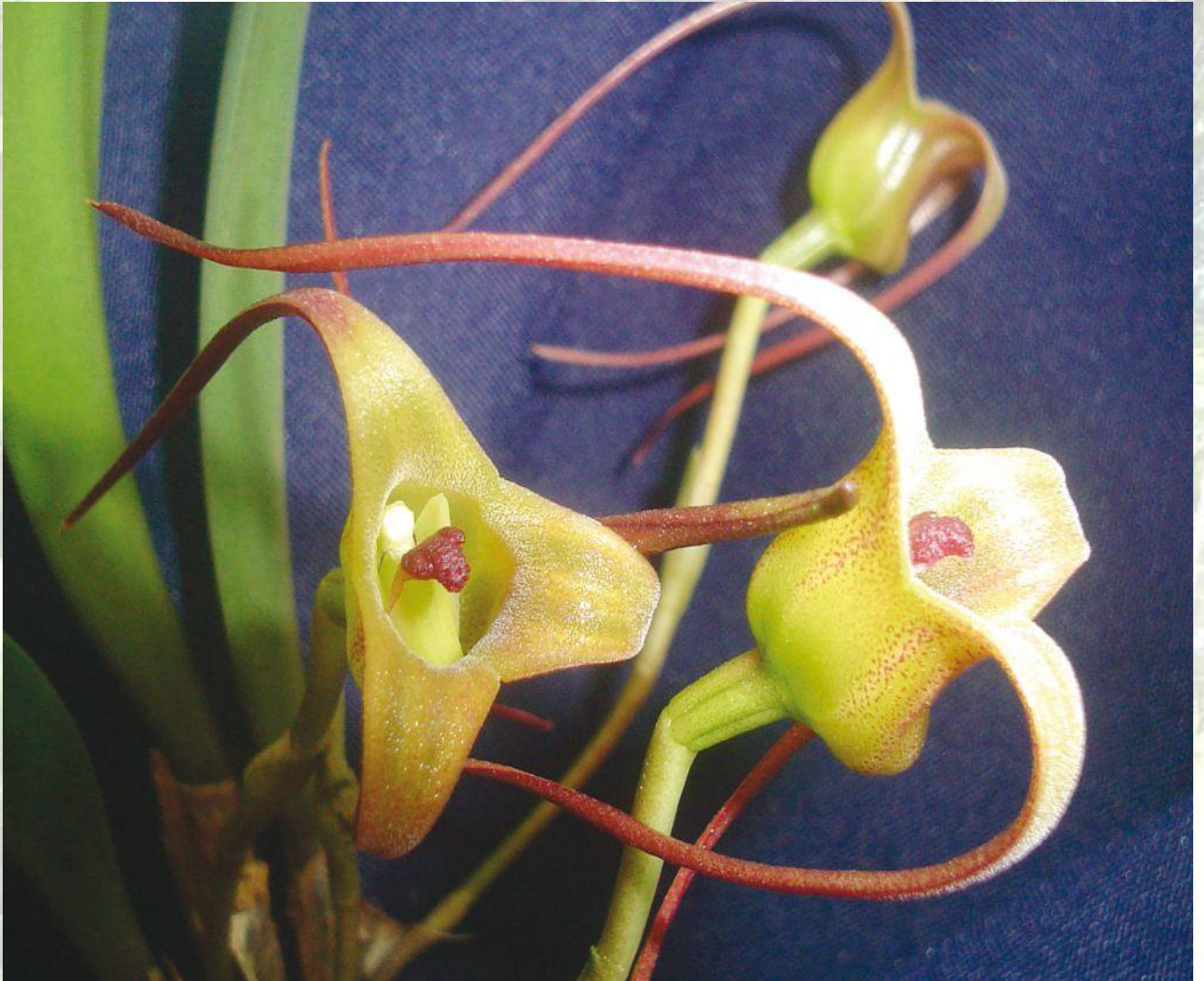
Nombre: Masdevallia fractiflexa F. Lehm. & Kraenzl. Procedencia: Montañas de Loja. Altitud: 2200 – 2600 msnm. Colección del JBRE, 2160 msnm.