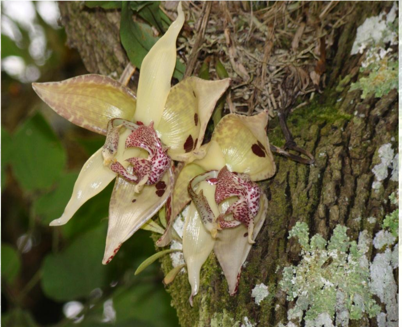
Nombre: Embreea rodigasiana (Claess. ex Cogn.) Dodson Procedencia: Montañas de Zamora. Altitud: 800 – 1400 msnm. Colección del JBRE, 2160 msnm.