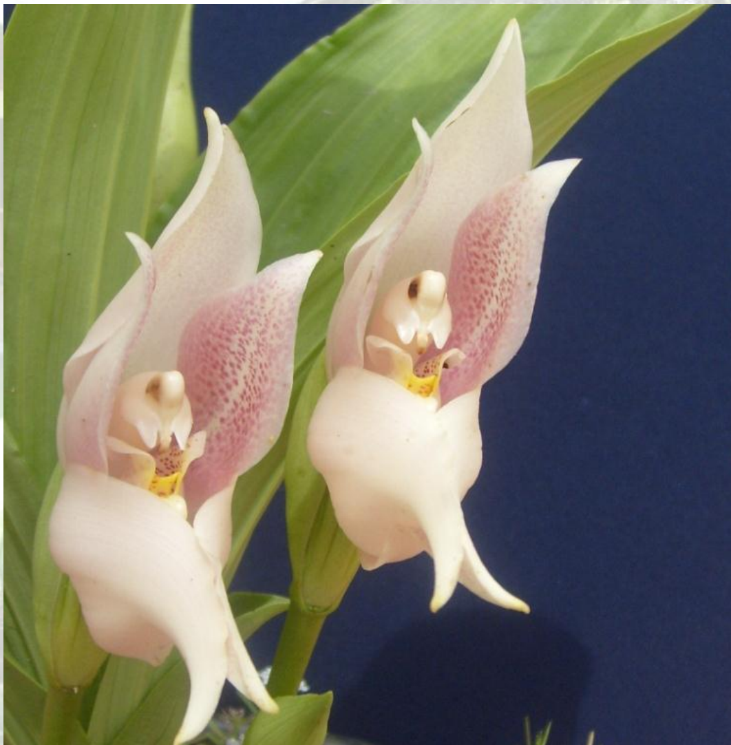
Nombre: Anguloa virginalis Linden ex B. S. Willians Procedencia: Montañas de Zamora. Altitud: 1400 – 1800 msnm. Colección del JBRE, 2160 msnm.