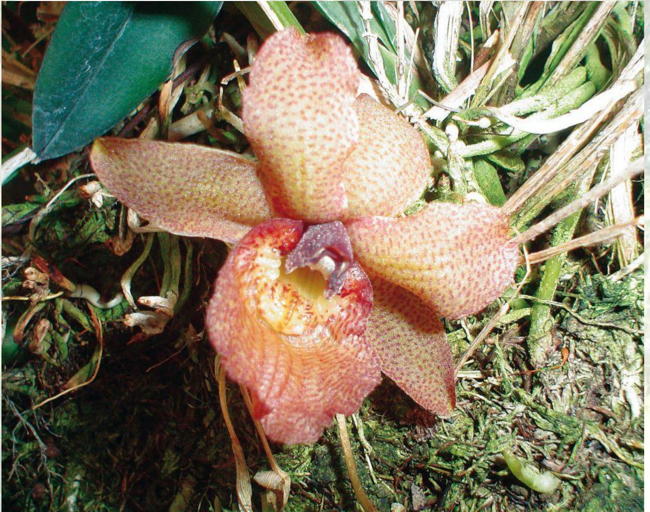
Nombre: Chaubardiella dalessandroi Dodson & Dalström Sitio: Montañas de Zamora. Altitud: 1200 – 1800 msnm. Colección del JBRE, 2160 msnm.