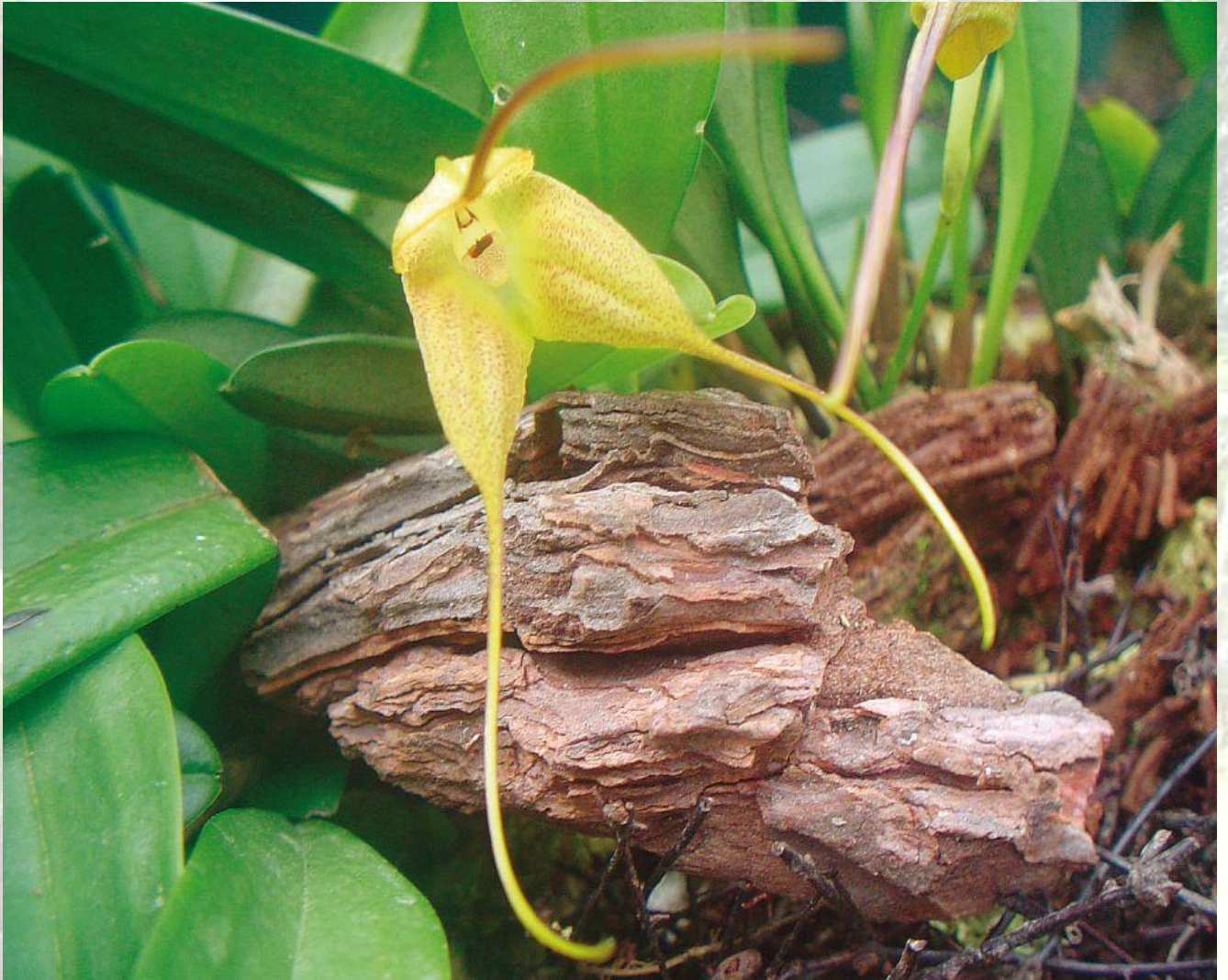
Nombre: Masdevallia instar Luer & Andretta Procedencia: Montañas de Loja. Altitud: 2200 – 2800 msnm. Colección del JBRE, 2160 msnm.