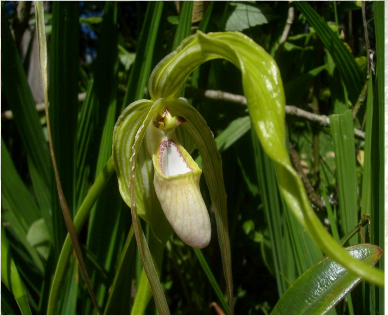
Nombre: Phragmipedium wallisi Rchb. f. (Garay) Procedencia: Montañas de Zamora. Altitud: 800 – 1400 msnm. Colección del JBRE, 2160 msnm.