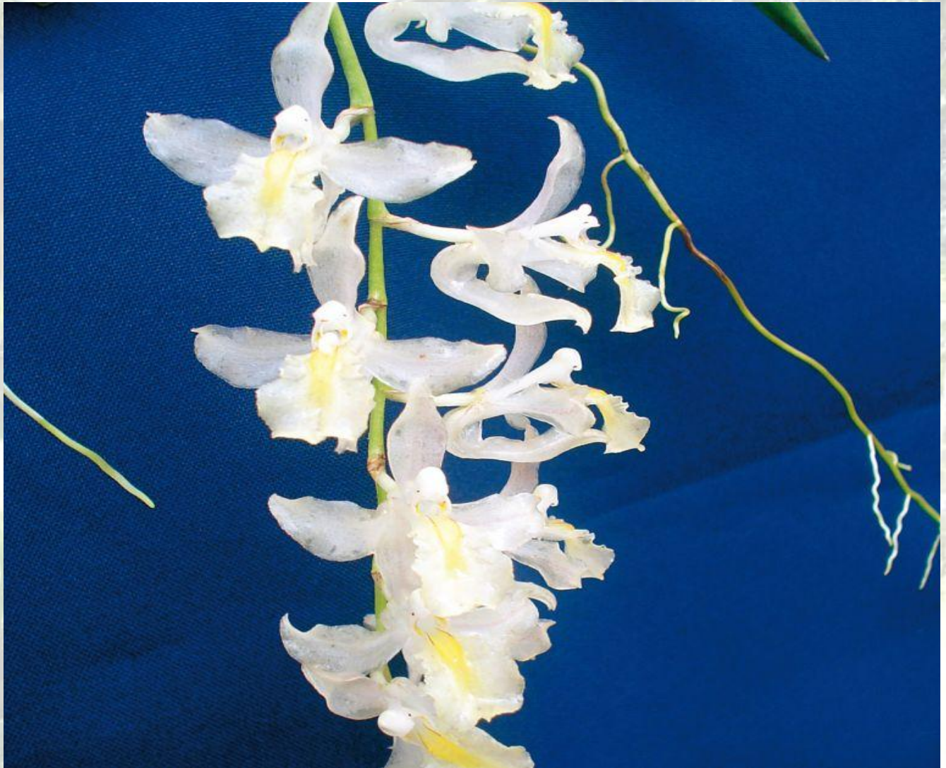
Nombre: Rodriguezia venusta Rchb. f. Procedencia: Montañas de Zamora. Altitud: 800 – 1400 msnm. Colección del JBRE, 2160 msnm.