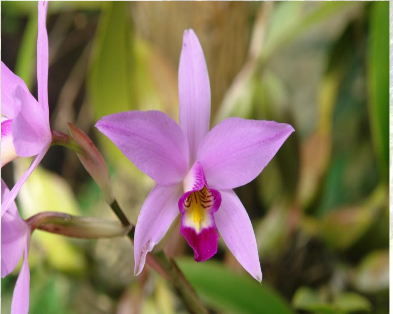
Nombre: Laelia anceps Lindl. Procedencia: México. Altitud: 2200 msnm. Colección del JBRE, 2160 msnm.