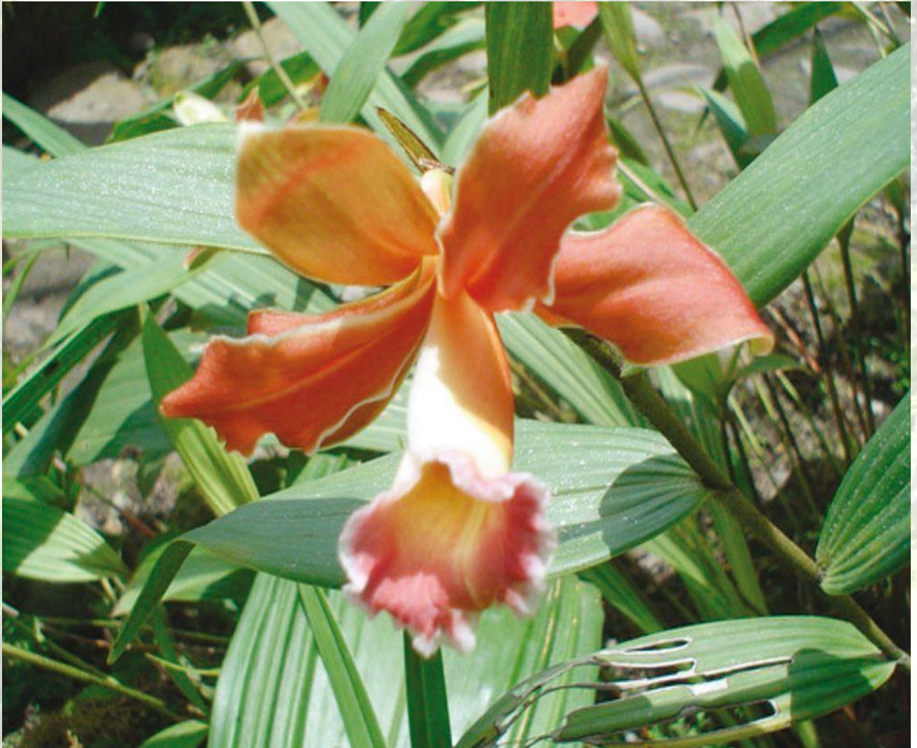
Nombre: Sobralia atropubescens Ames & C. Schweinf. Procedencia: Montañas de Zamora. Altitud: 1000 – 1600 msnm. Colección del JBRE, 2160 msnm.