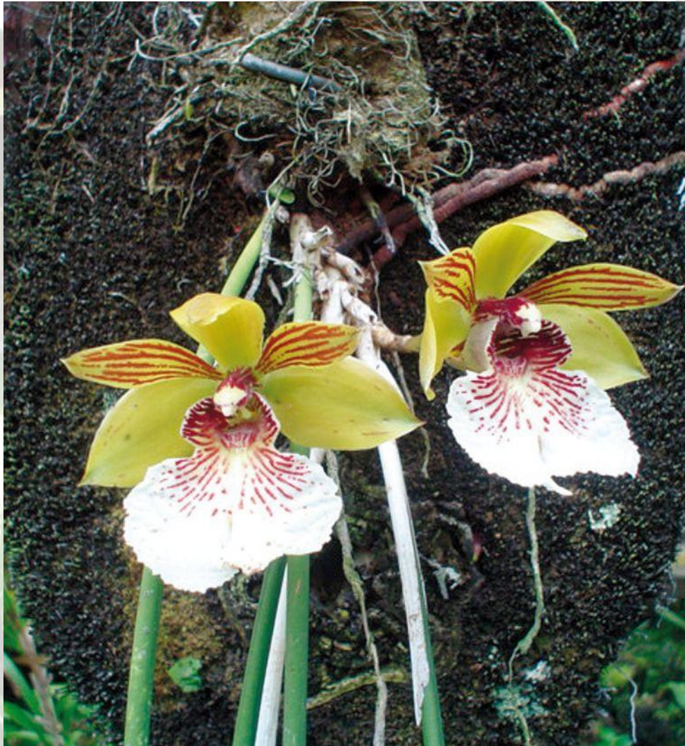
Nombre: Scuticaria salesiana Dressler Procedencia: Montañas de Zamora. Altitud: 800 – 1300 msnm. Colección del JBRE, 2160 msnm.