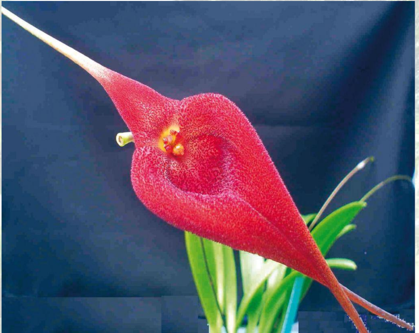
Nombre: Masdevallia ayabacana Luer. Procedencia: Montañas de Zamora. Altitud: 800 – 1400 msnm. Colección del JBRE, 2160 msnm.