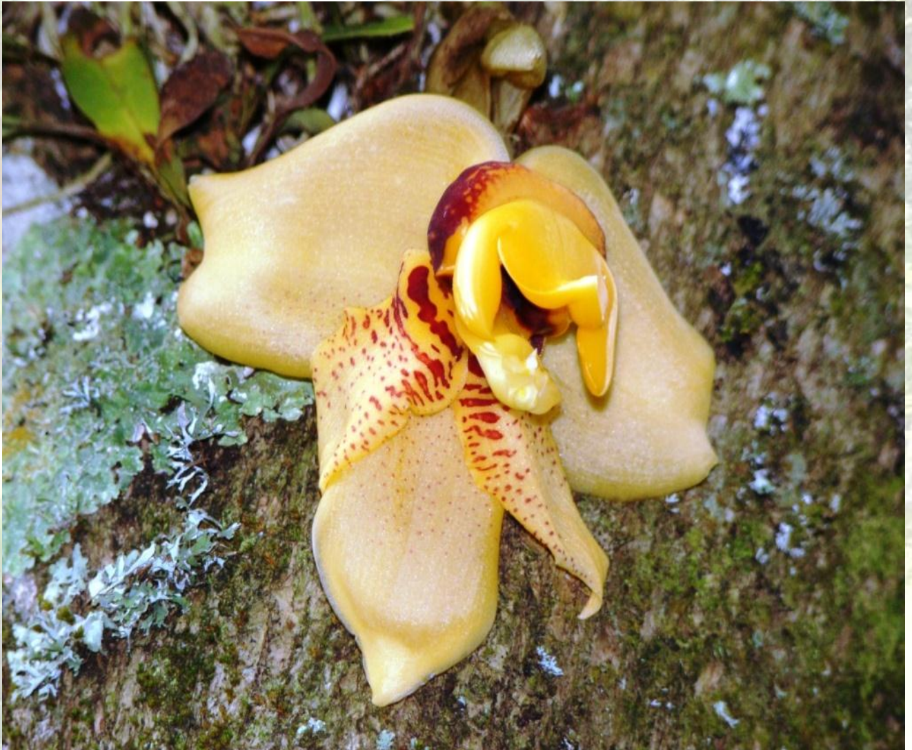
Nombre: Stanhopea connata Klotzsch Procedencia: Montañas de Zamora. Altitud: 600 – 1400 msnm. Colección del JBRE, 2160 msnm.