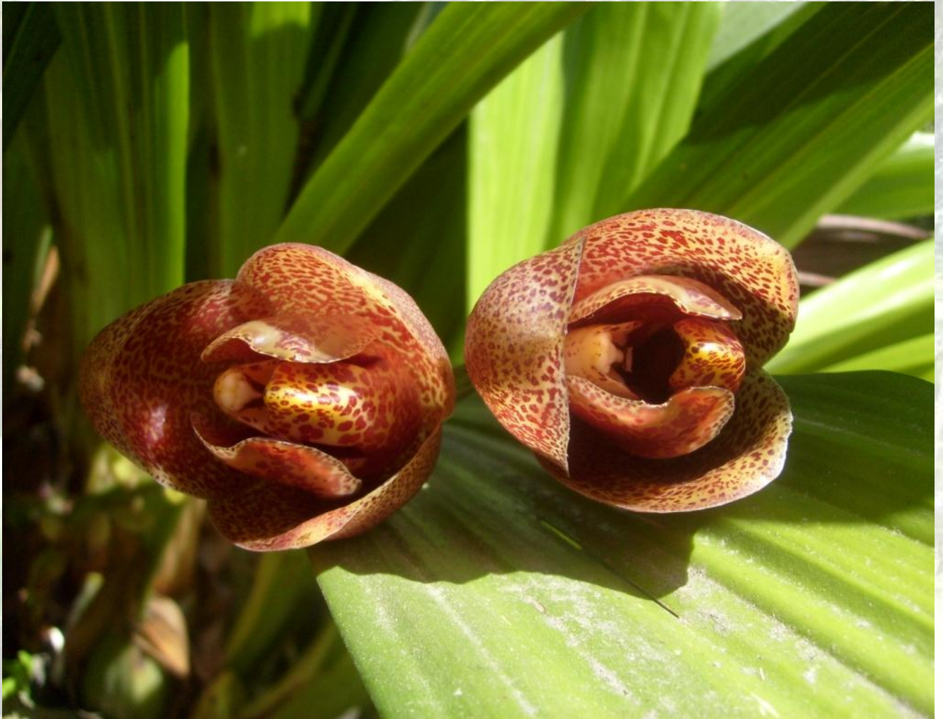
Nombre: Acineta superba (Kunth) Rchb. f. Procedencia: Montañas de Zamora. Altitud: 1200 – 1700 msnm. Colección del *JBRE, 2160 msnm.

*JBRE Jardín Botánico "Reinaldo Espinosa"