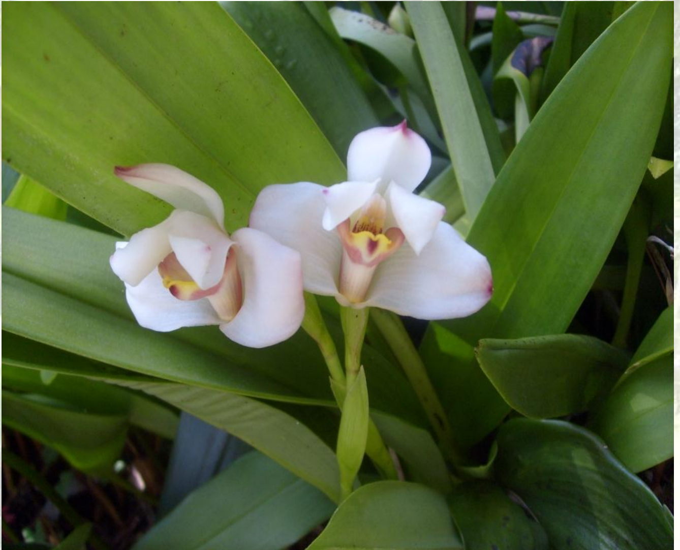
Nombre: Maxillaria sp. Procedencia: Montañas de Loja. Altitud: 2000 – 2400 msnm. Colección del JBRE, 2160 msnm.