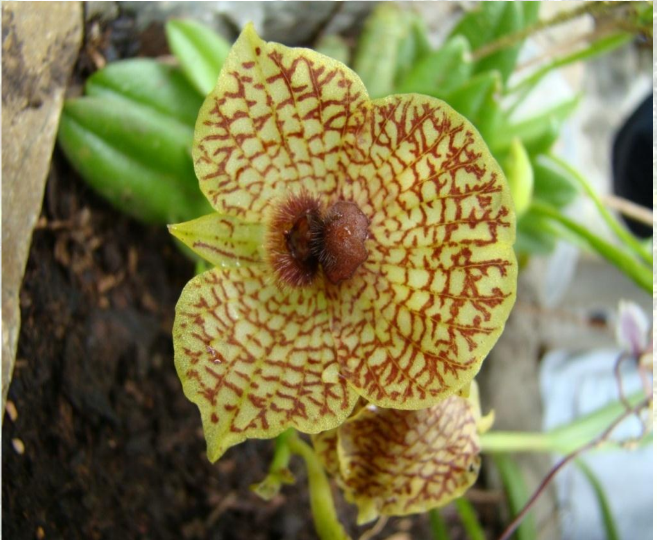
Nombre: Telipogon papillo Rchb. f.& Warsz. Procedencia: Montañas de Loja. Altitud: 2400 – 3000 msnm. Colección del JBRE, 2160 msnm.