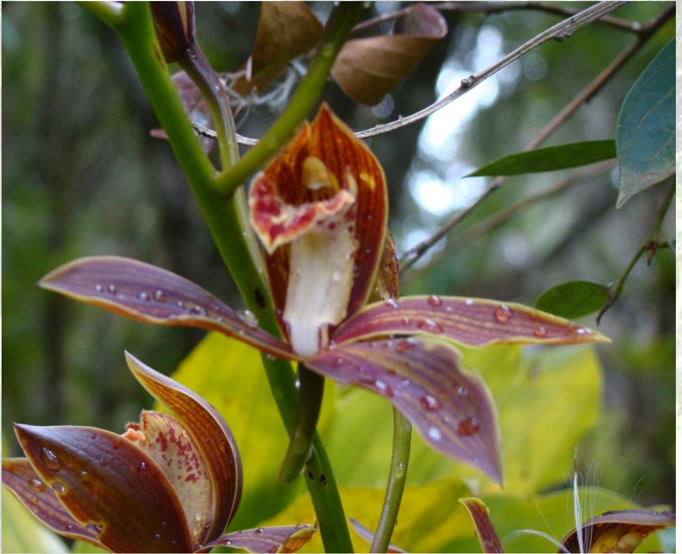
Nombre: Cymbidium sp. Colección del JBRE, 2160 msnm.