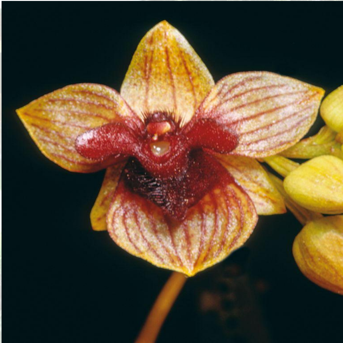
Nombre: Trichoceros platyceros Rchb. f. Procedencia: Montañas de Loja. Altitud: 2200 – 2600 msnm. Colección del JBRE, 2160 msnm.