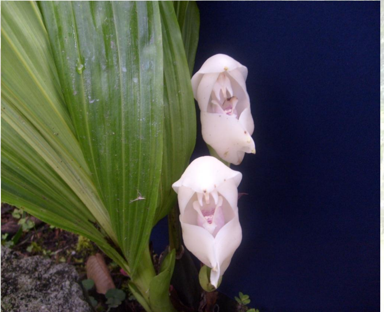
Nombre: Anguloa uniflora Ruiz y Pav. Procedencia: Montañas de Zamora. Altitud: 1000 – 1800 msnm. Colección del JBRE, 2160 msnm.