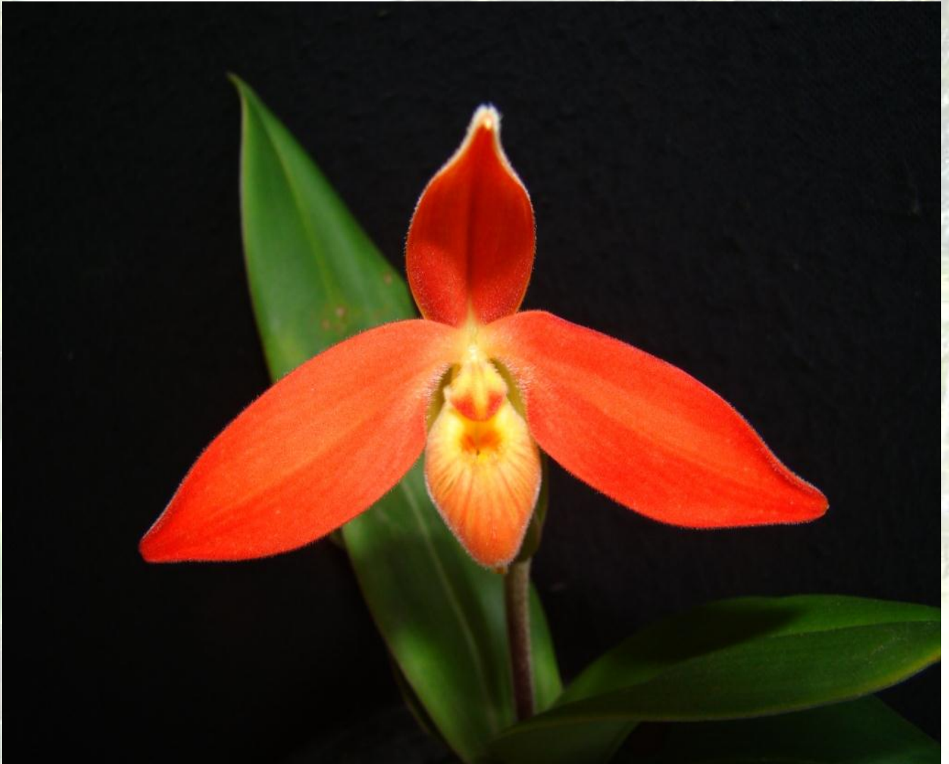
Nombre: Phragmipedium dalessandroi Dodson & Gruss. Procedencia: Montañas de Zamora Chinchipe. Altitud: 1000 – 1600 msnm. Colección del JBRE, 2160 msnm.