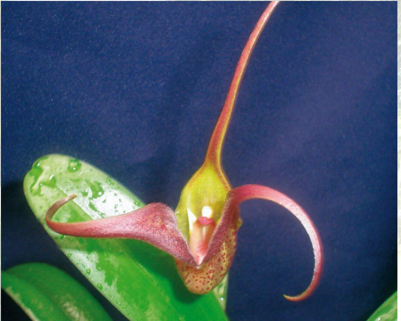
Nombre: Masdevallia colosus Luer Procedencia: Montañas de Loja. Altitud: 2000 – 2600 msnm. Colección del JBRE, 2160 msnm.