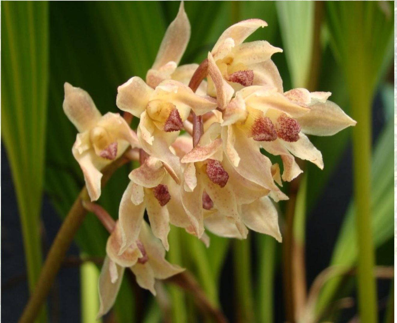
Nombre: Xylobium leontoglossum (Rchb. f.) Rolfe Procedencia: Montañas de Zamora. Altitud: 1600 – 2200 msnm. Colección del JBRE, 2160 msnm.