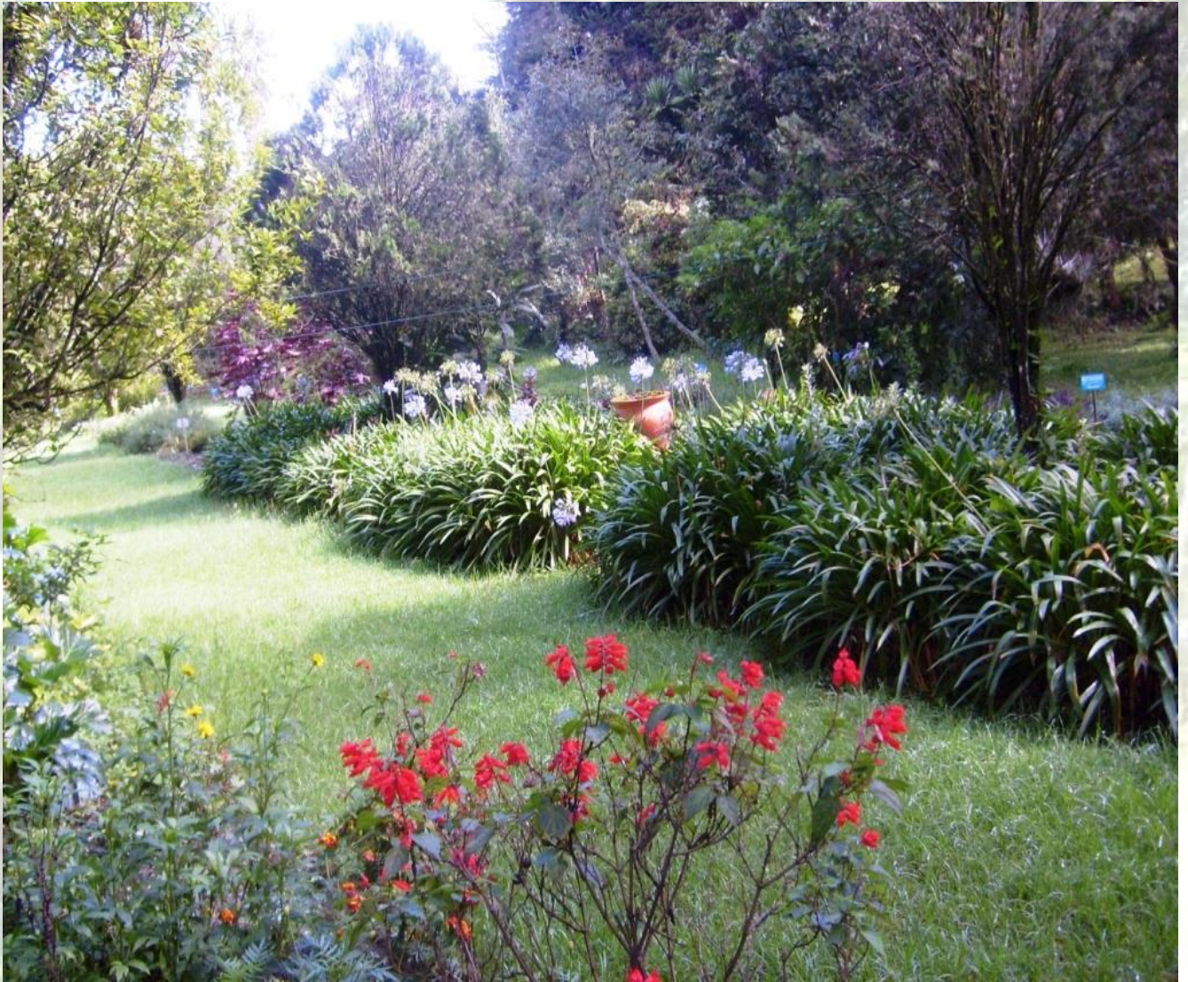
Sección del Jardín Botánico Reinaldo Espinosa de la Universidad Nacional de Loja.