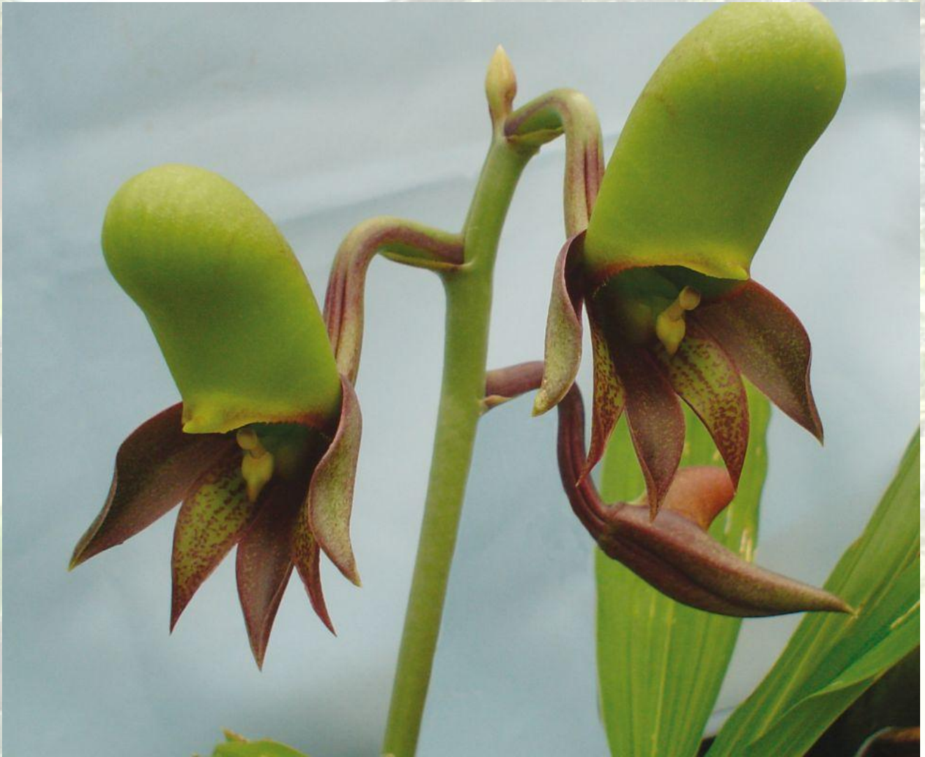
Nombre: Catasetum sacatum Lindl. (Flor femenina) Procedencia: Montañas de Zamora. Altitud: 600 – 1000 msnm. Colección del JBRE, 2160 msnm.