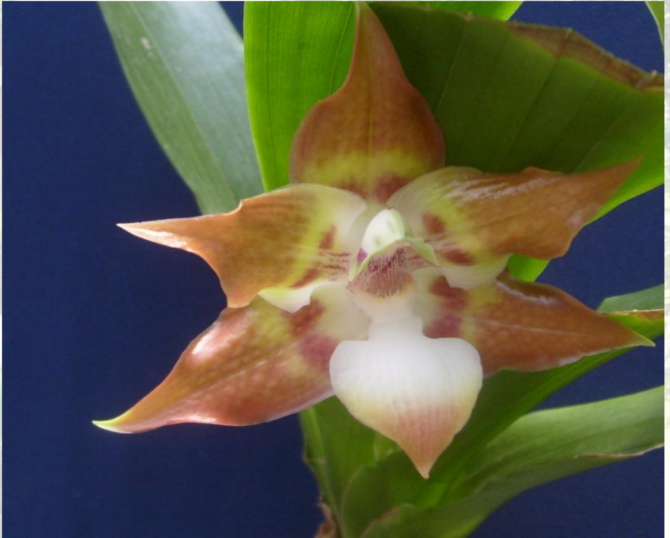
Nombre: Huntleya wallisii (Rchb. f.) Rolfe Procedencia: Montañas de Zamora. Altitud: 500 – 1000 msnm. Colección del JBRE, 2160 msnm.