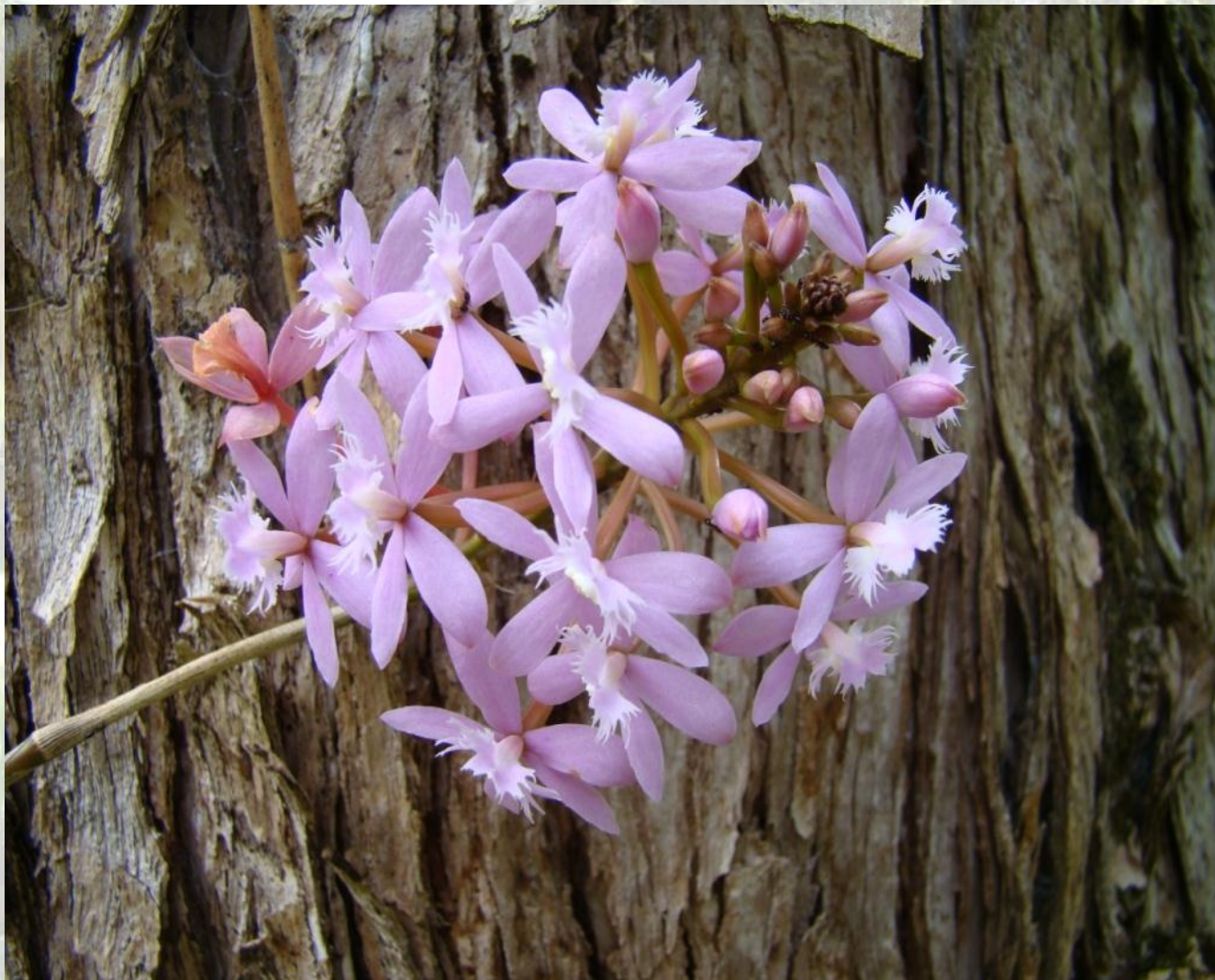
Nombre: Epidendrum jamiesonis Rchb. f. Procedencia: Montañas de Loja. Altitud: 1000 – 2800 msnm. Colección del JBRE, 2160 msnm.