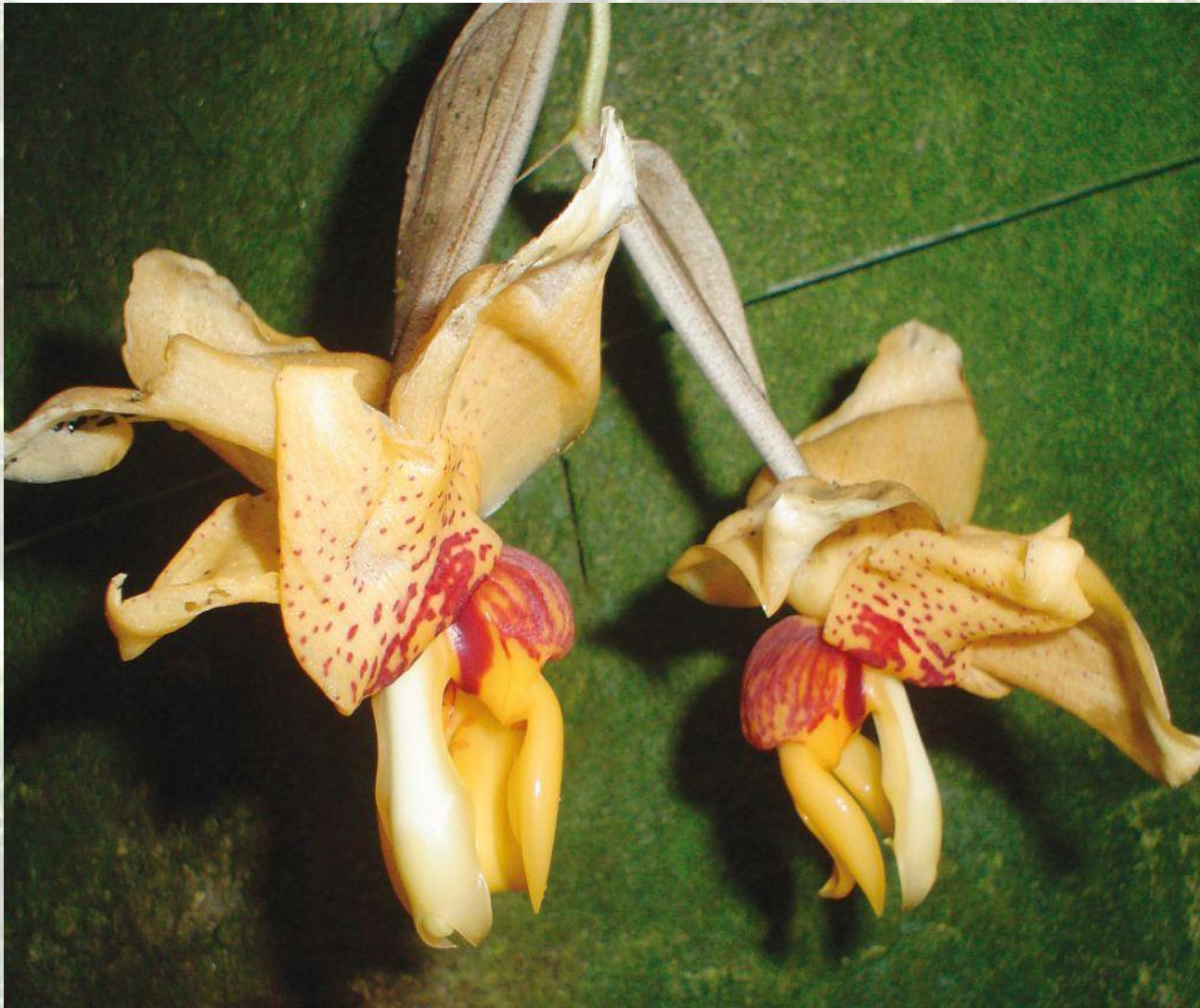
Nombre: Stanhopea connata Klotzsch Procedencia: Montañas de Zamora. Altitud: 600 – 1400 msnm. Colección del JBRE, 2160 msnm.