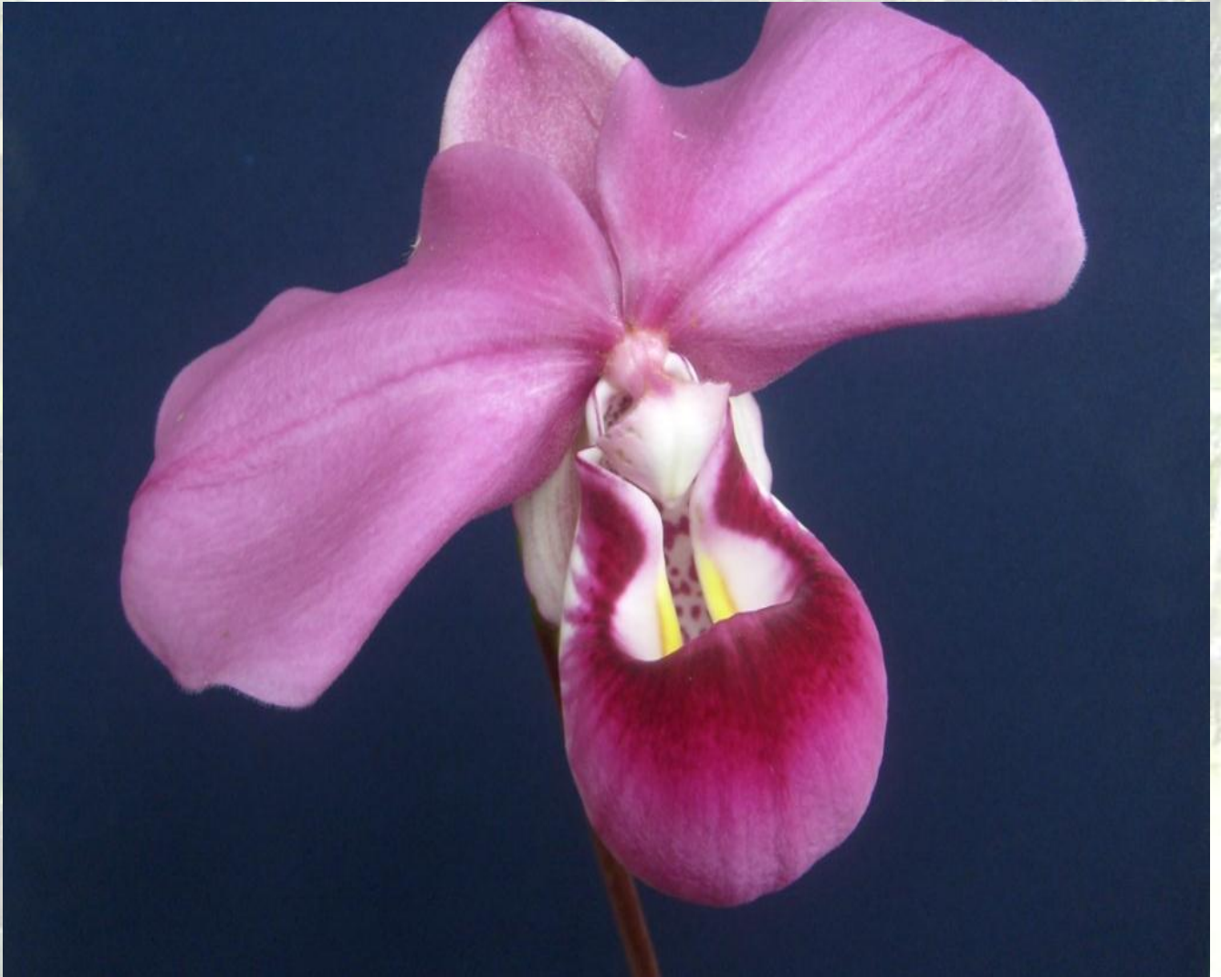
Nombre: Phragmipedium kovaqui Atwood, Dolström & Fernández Procedencia: Montañas de Zamora Chinchipe – Limite con el Perú. Altitud: 2200 – 2400 msnm. Colección del JBRE, 2160 msnm.