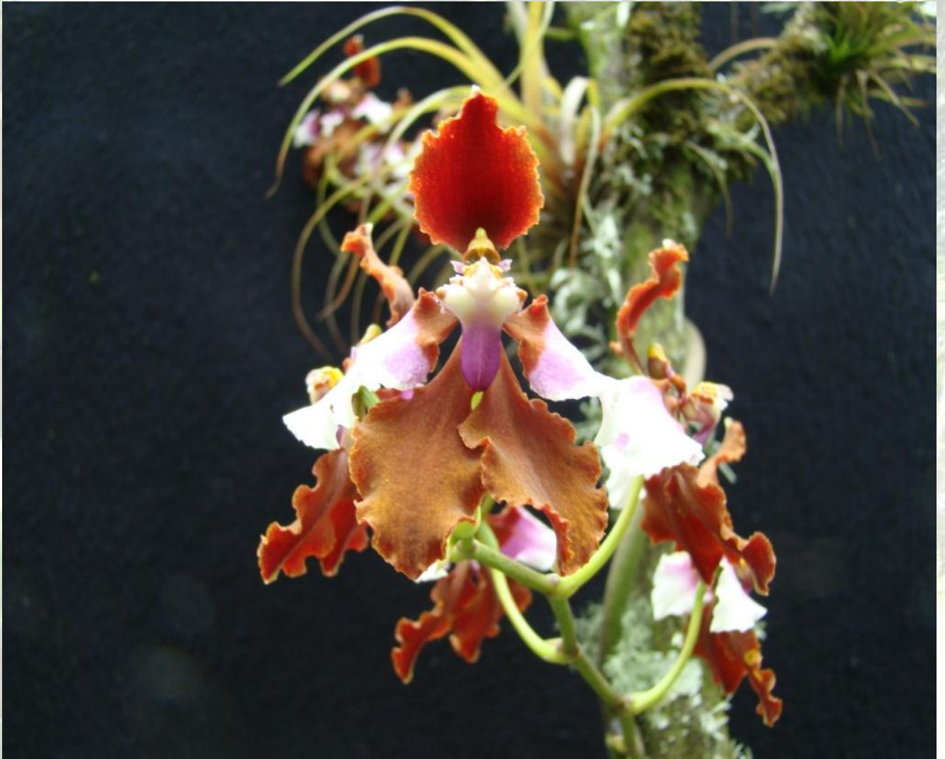
Nombre: Cyrtorchilum pastazae (Rchb. f.) Kraenzl. Procedencia: Montañas de Zamora. Altitud: 1000 – 1600 msnm. Colección del JBRE, 2160 msnm.