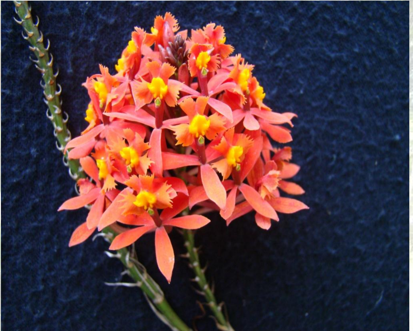
Nombre: Epidendrum incisum Velloso Procedencia: Montañas de Loja. Altitud: 1800 – 2500 msnm. Colección del JBRE, 2160 msnm.