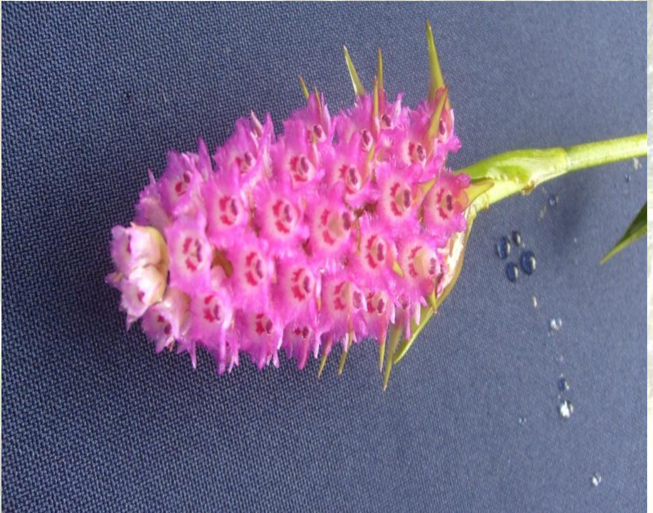
Nombre: Elleanthus amethystinoides Garay Procedencia: Montañas de Loja. Altitud: 2000 – 2600 msnm. Colección del JBRE, 2160 msnm.