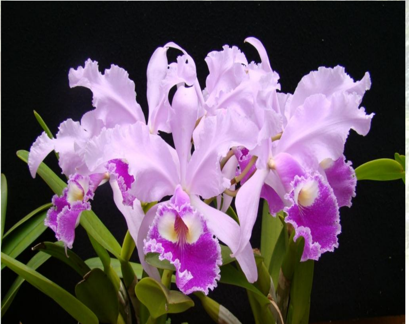
Nombre: Cattleya gigas 'San Juan' Procedencia: Colombia. Altitud: 800 -1400 msnm. Colección del JBRE, 2160 msnm.