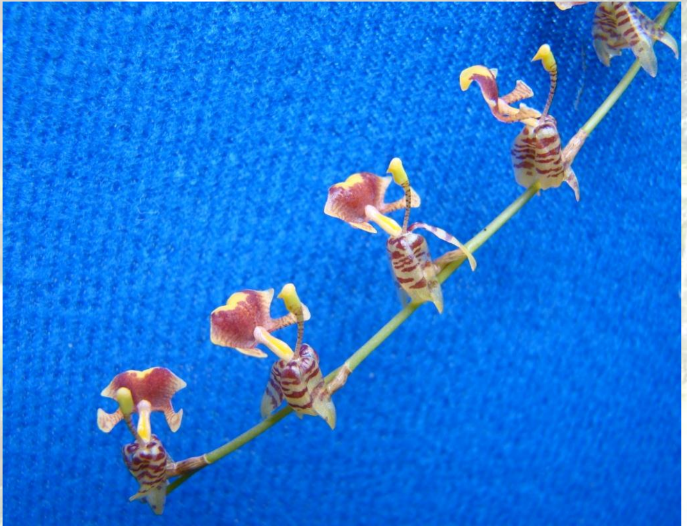
Nombre: Sigmatostalix eliae Rolfe Procedencia: Montañas de Zamora. Altitud: 800 – 1800 msnm. Colección del JBRE, 2160 msnm.