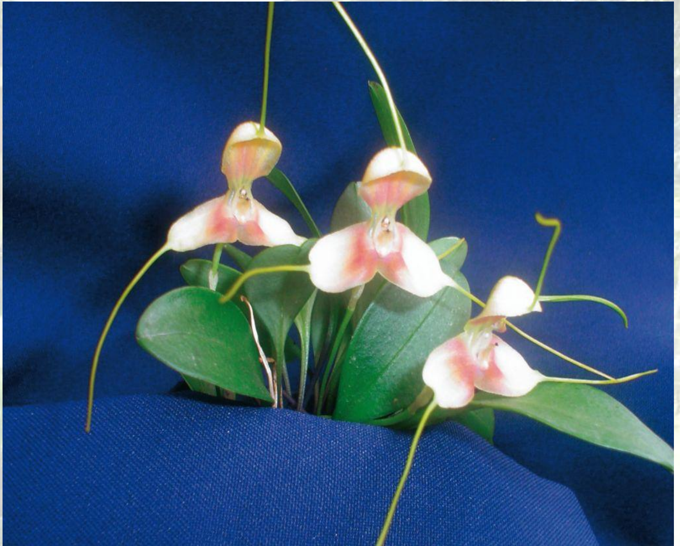
Nombre: Masdevallia xanthina Rchb. f. Procedencia: Montañas de Zamora. Altitud: 1200 – 1800 msnm. Colección del JBRE, 2160 msnm.