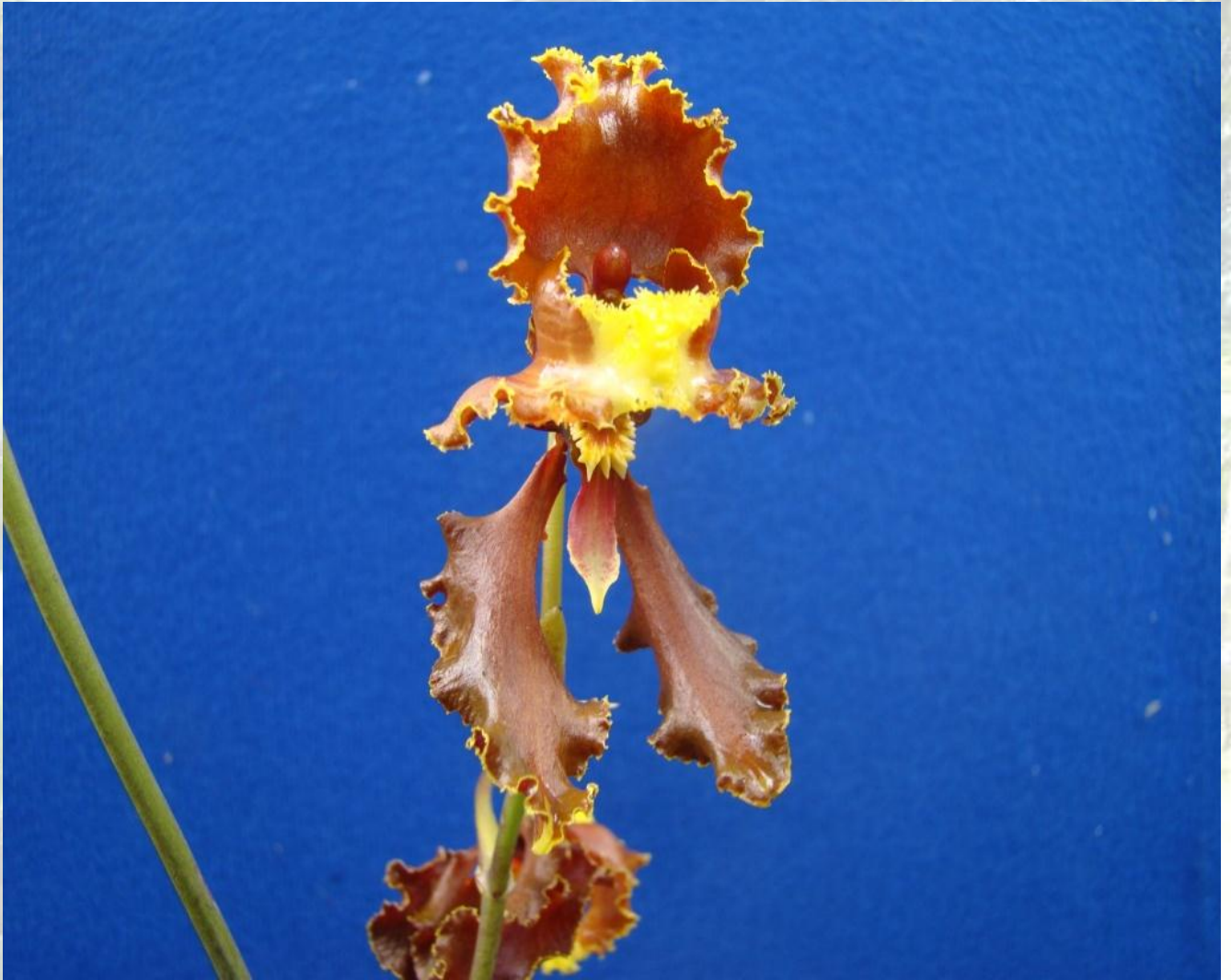
Nombre: Cyrtorchillum serratum (Lindl.) Kraenzl. Procedencia: Montañas de Loja. Altitud: 2200 – 2600 msnm. Colección del JBRE, 2160 msnm.