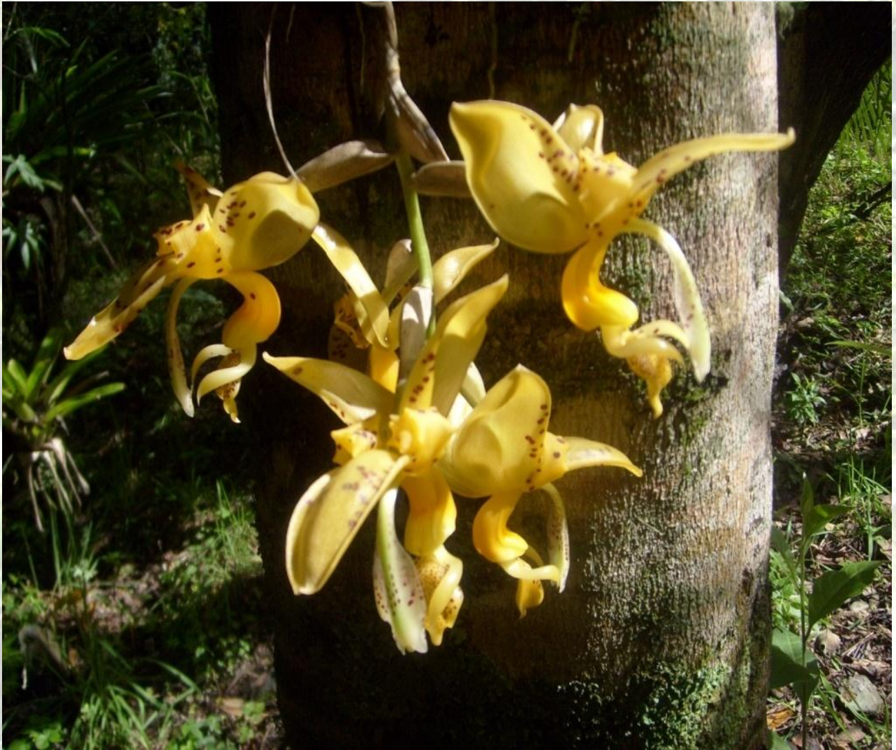
Nombre: Stanhopea jenishiana Kramer ex Rchb. f. Procedencia: Montañas de Loja. Altitud: 1000 – 1800 msnm. Colección del JBRE, 2160 msnm.