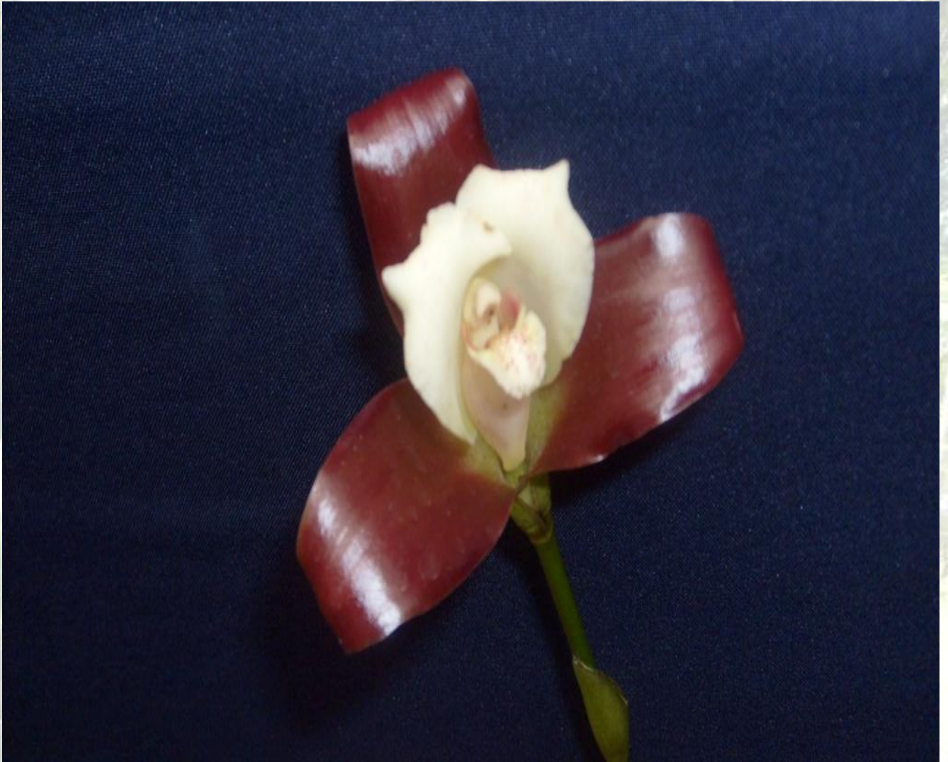
Nombre: Lycaste macrophylla (Poepp. & Endl.) Lindl. Sitio: Montañas de Loja. Altitud: 1000 – 1400 msnm. Colección del JBRE, 2160 msnm.