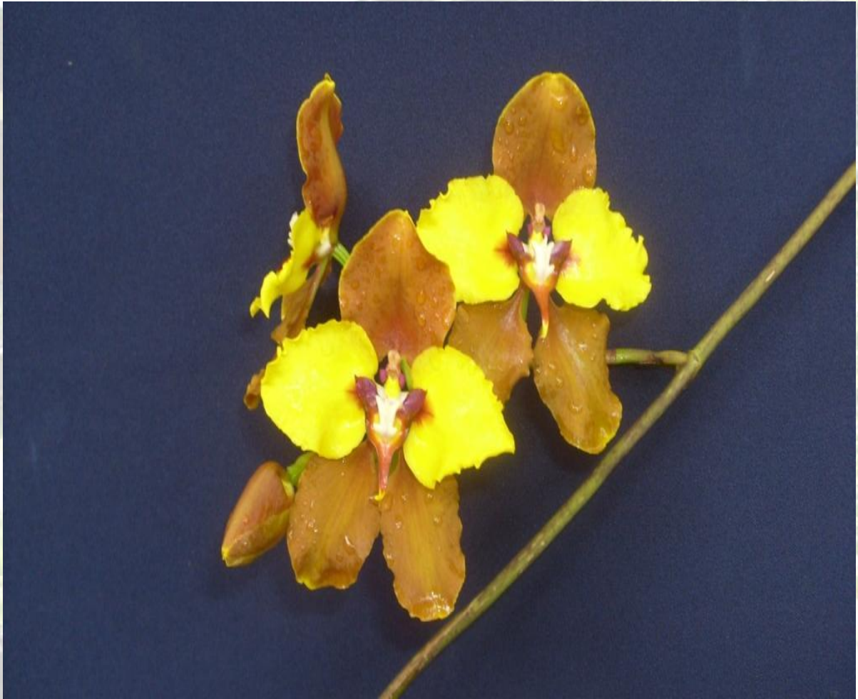
Nombre: Cyrtochilum macranthum (Lindl.) Kraenzl. Procedencia: Montañas de Loja. Altitud: 2000 – 2500 msnm. Colección del JBRE, 2160 msnm.