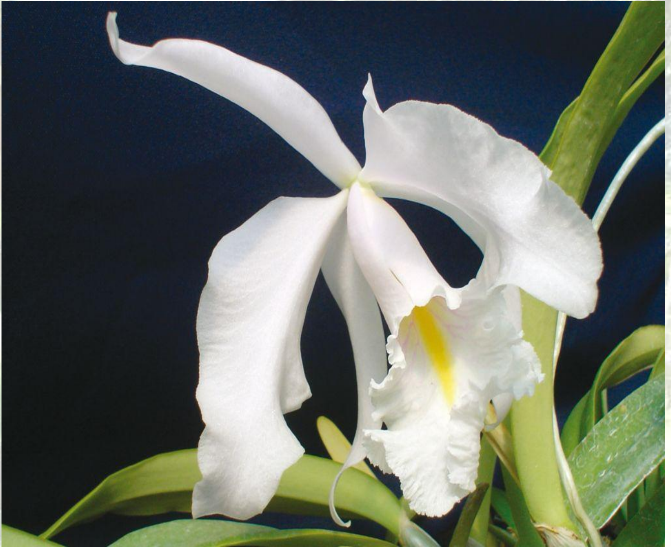
Nombre: Cattleya maxima `Alba´ Procedencia: Loja. Altitud: 800 – 1400 msnm. Colección del JBRE, 2160 msnm.