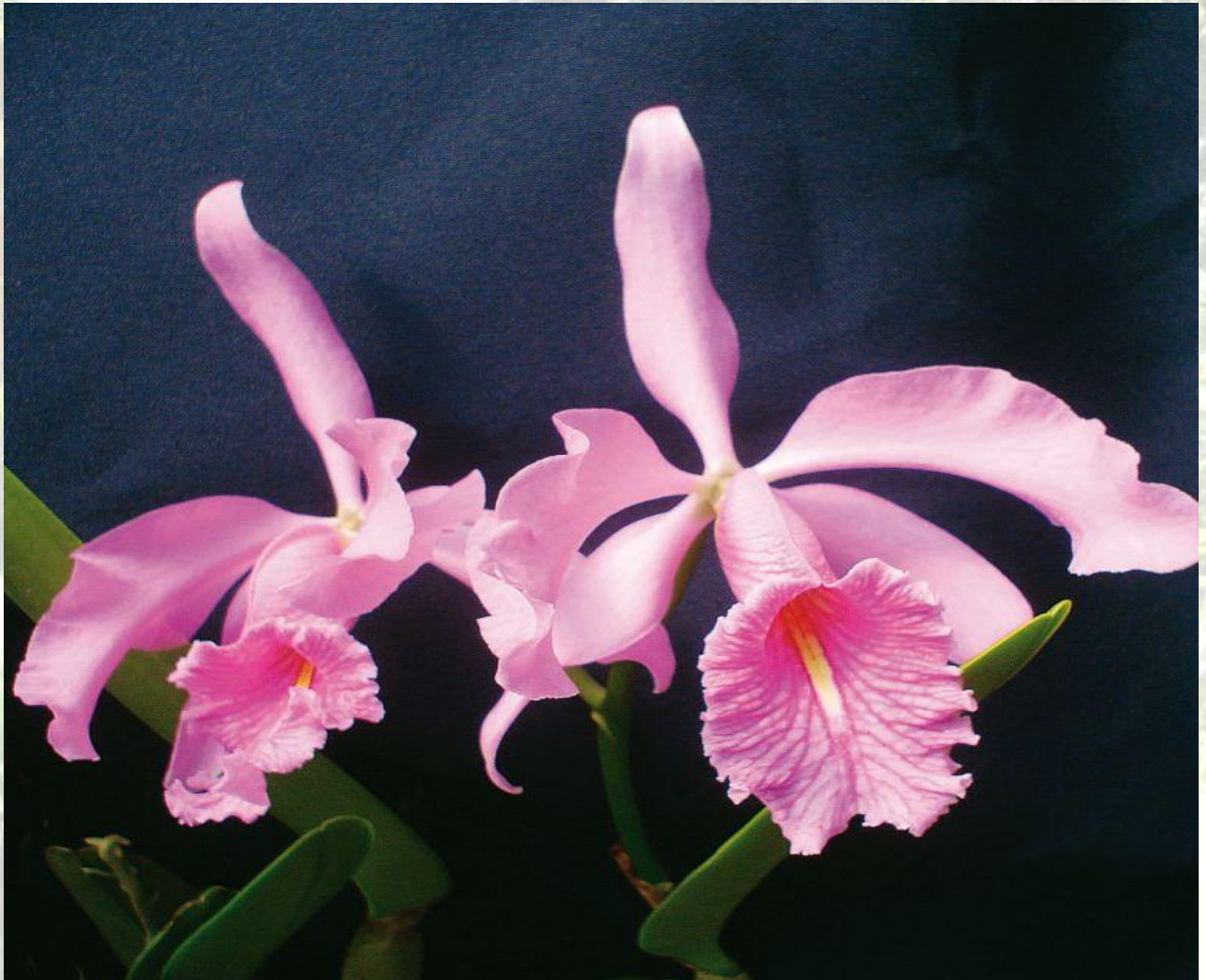
Nombre: Cattleya máxima Lindl. Sitio: Loja. Altitud: 800 – 1800 msnm. Colección del JBRE, 2160 msnm.