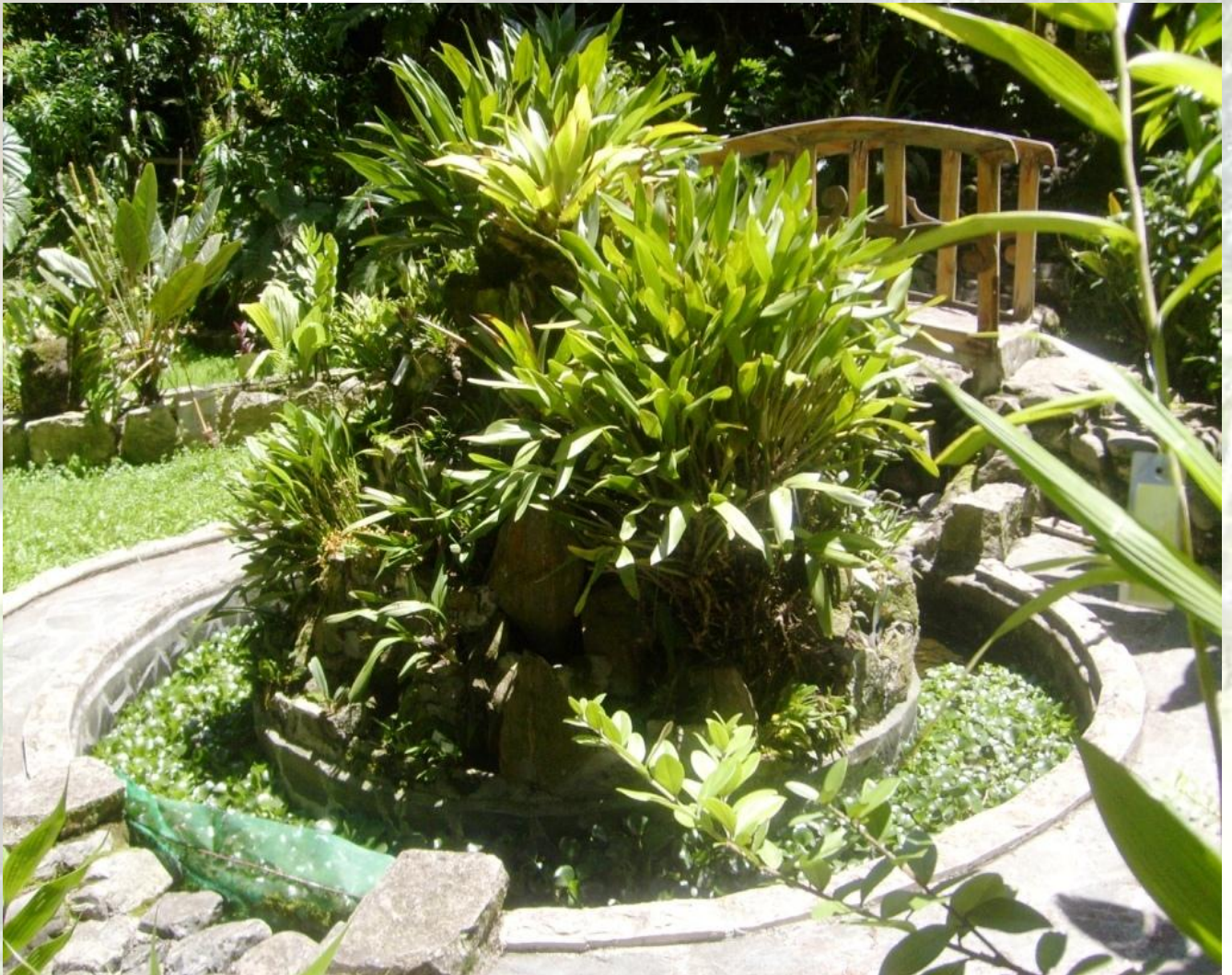
Orquideario del Jardín Botánico Reinaldo Espinosa de la Universidad Nacional de Loja