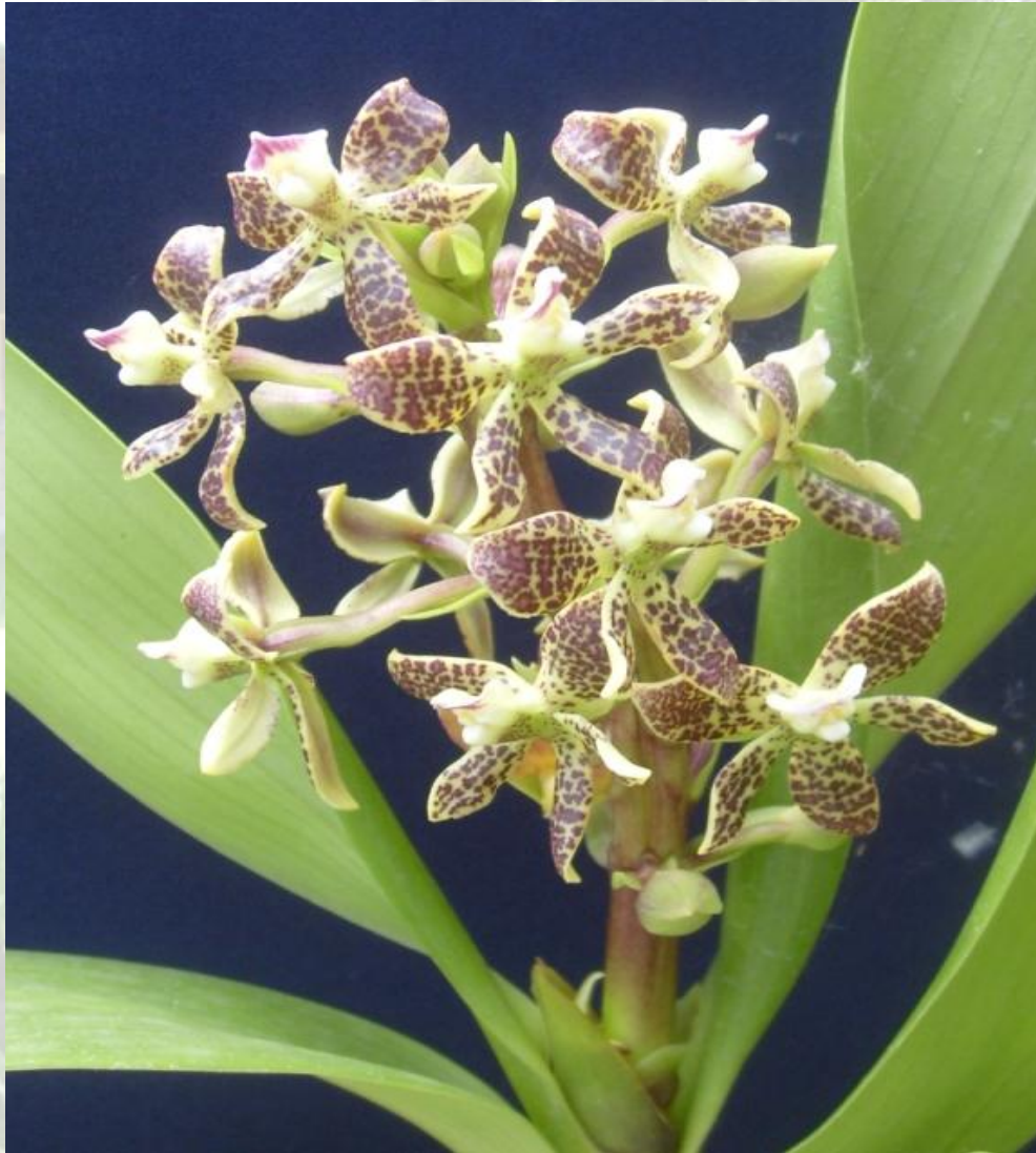
Nombre: Prostechea vespa (Vell.) W.E. Higgins Procedencia: Montañas de Zamora. Altitud: 600 – 1600 msnm. Colección del JBRE, 2160 msnm.