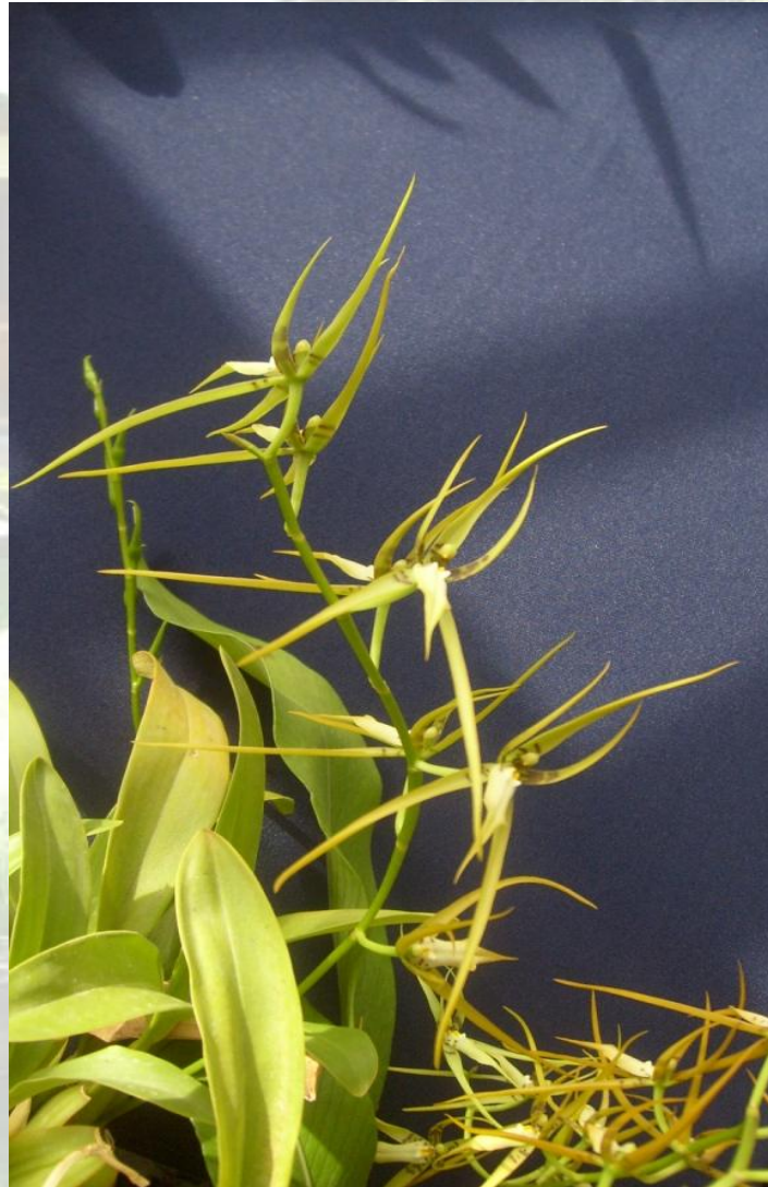
Nombre: Ada glumacea (Lindl.) N. H. Willians Procedencia: Montañas de Zamora. Altitud: 1400 – 2000 msnm. Colección del JBRE, 2160 msnm.