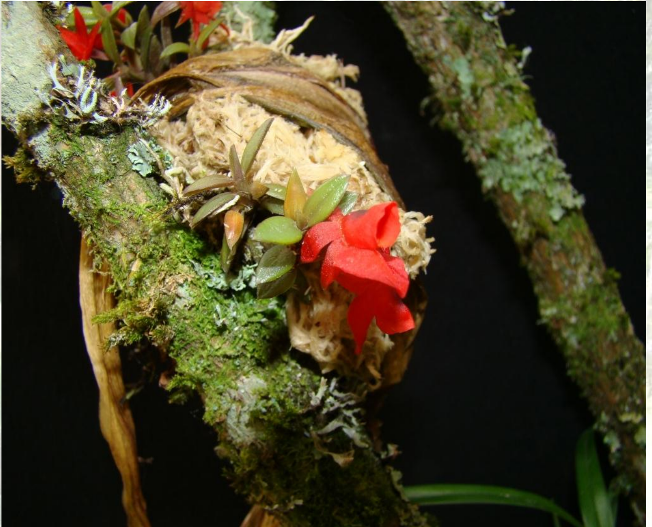
Nombre: Fernandezia ionanthera (Rchb.f. Warsz.) Schltr. Procedencia: Montañas de Loja. Altitud: 2500 – 3200 msnm. Colección del JBRE, 2160 msnm.