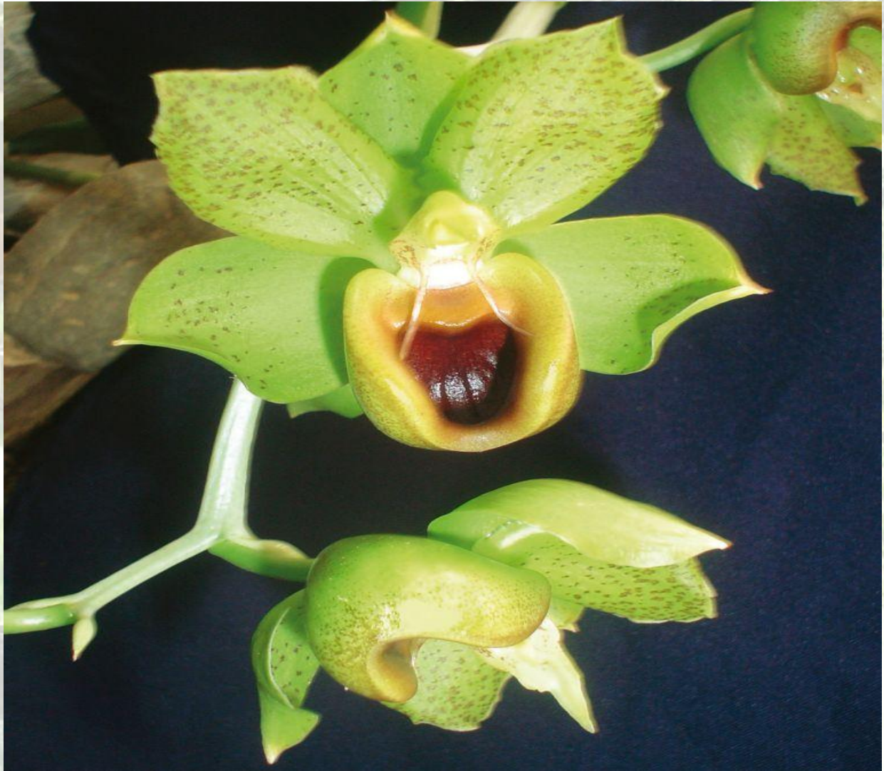
Nombre: Catasetum samaniegoy Dodson Sitio: Montañas de Loja. Altitud: 800 – 1200 msnm. Colección del JBRE, 2160 msnm. Fotografía: Tulio Bustos