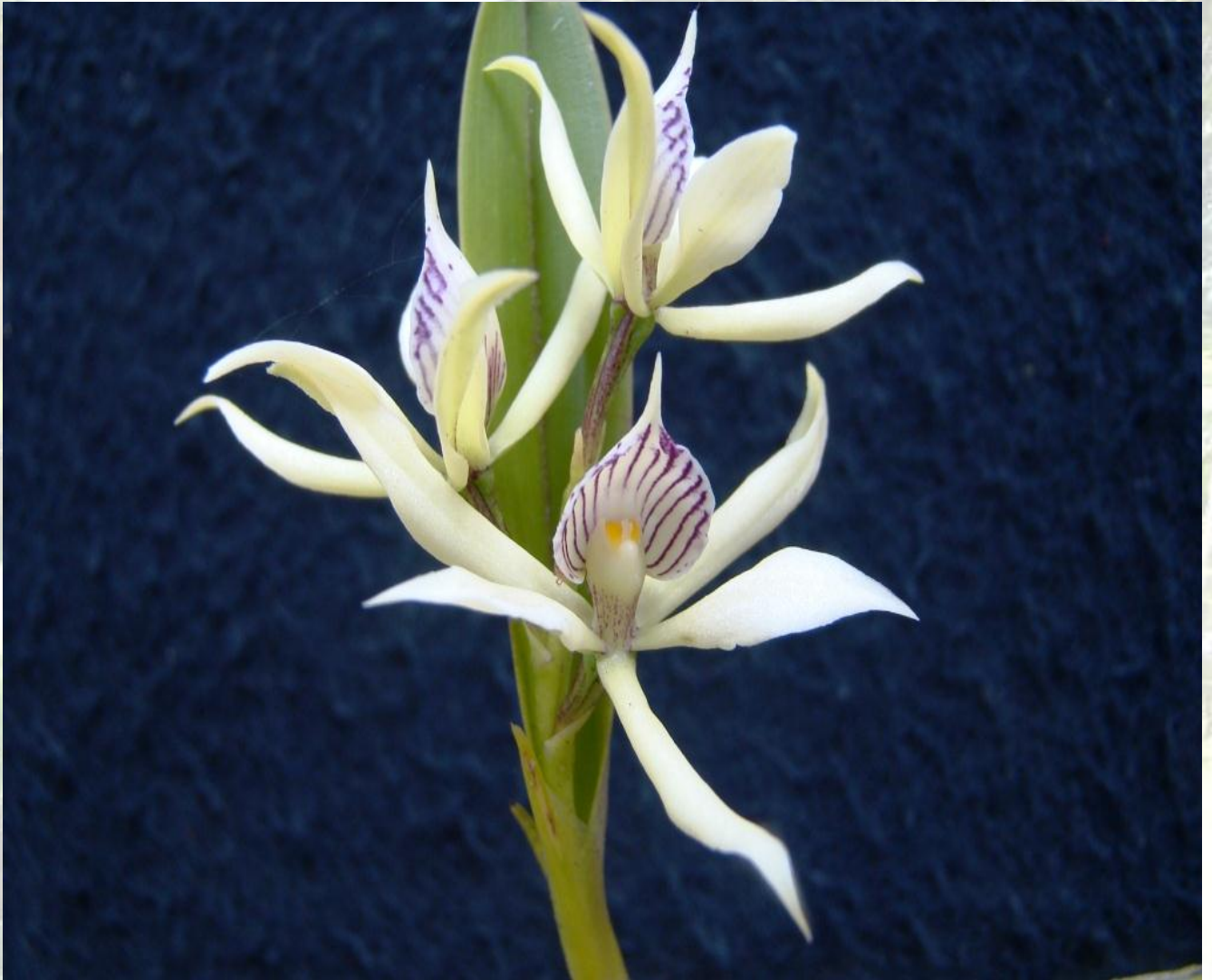
Nombre: Protechea fragrans (Sw.) W.E. Higgins Procedencia: Montañas de Zamora. Altitud: 500 – 1000 msnm. Colección del JBRE, 2160 msnm.