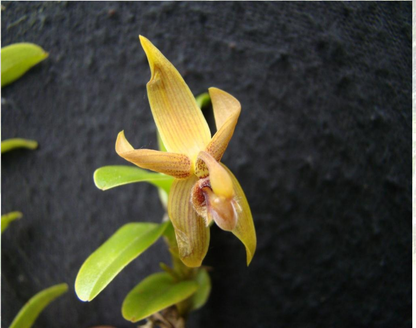
Cyrtidiorchis rhomboglossa (Lehm. & Krzl.) Rauschert. Sitio: Montañas de Loja. Altitud: 2100 – 2500 msnm. Colección del JBRE, 2160 msnm.