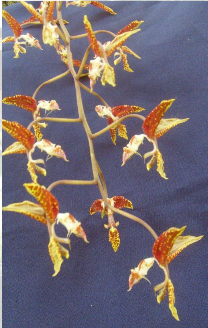
Nombre: Gongora rufescens Jenny Procedencia: Montañas de Zamora. Altitud: 600 – 1400 msnm. Colección del JBRE, 2160 msnm.