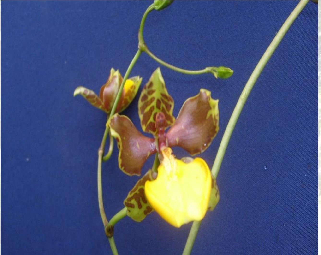
Nombre: Cyrtorchilum loxense (Lindl.) Kraenzl. Procedencia: Montañas de Loja. Altitud: 2400 – 2800 msnm. Colección del JBRE, 2160 msnm.