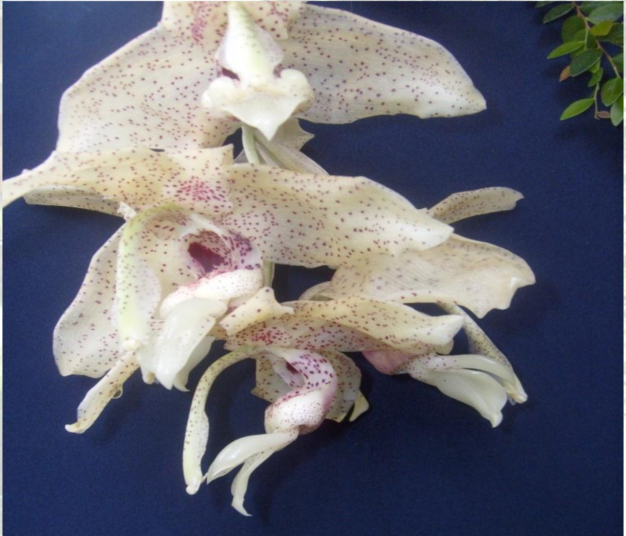
Nombre: Stanhopea florida Rchb. f. Procedencia: Montañas de Zamora. Altitud: 600 – 1400 msnm. Colección del JBRE, 2160 msnm.