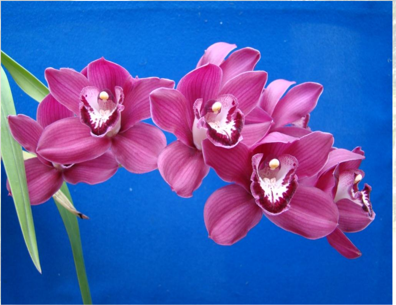
Nombre: Cymbidium híbrido Colección del JBRE, 2160 msnm.