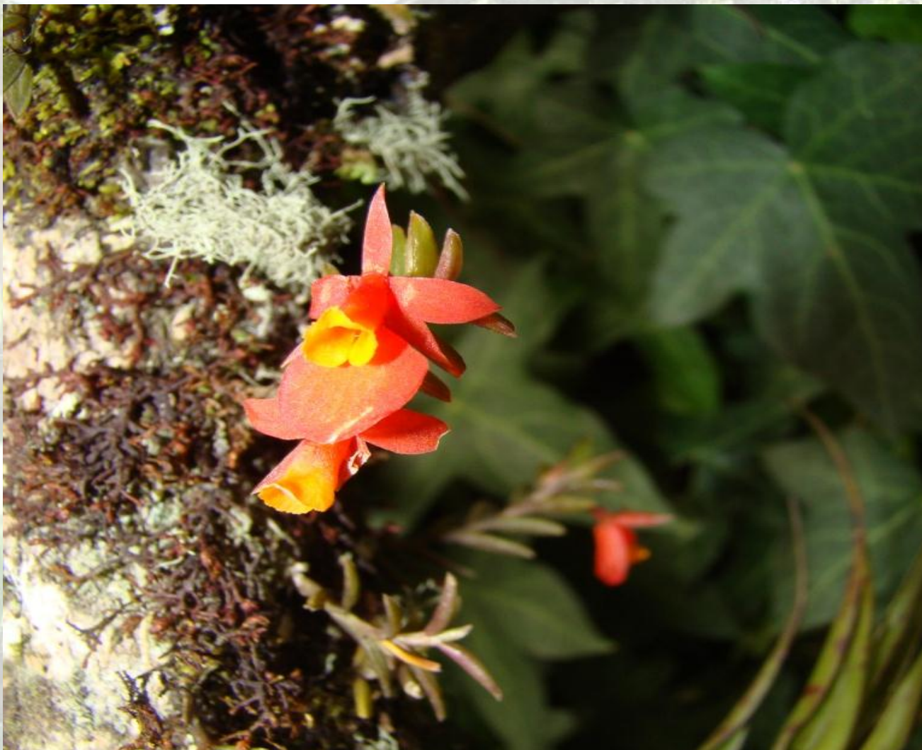
Nombre: Fernandezia subbiflora Ruiz & Pav. Procedencia: Montañas de Loja. Altitud: 2500 – 3200 msnm. Colección del JBRE, 2160 msnm.