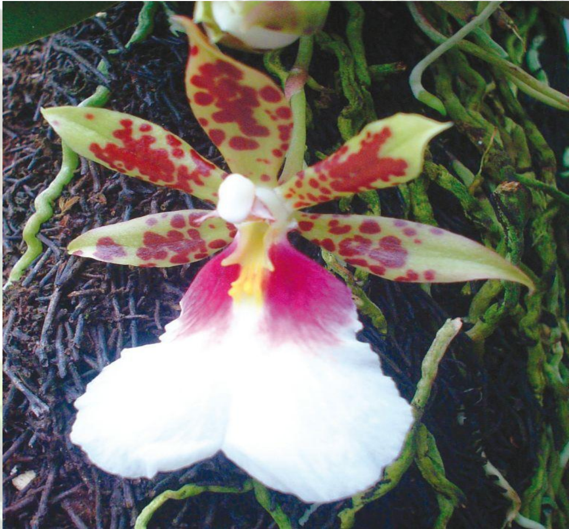
Nombre: Trichocentrum tigrinum Linden & Rchb. f. Procedencia: Montañas de Loja. Altitud: 800 – 1200 msnm. Colección del JBRE, 2160 msnm.