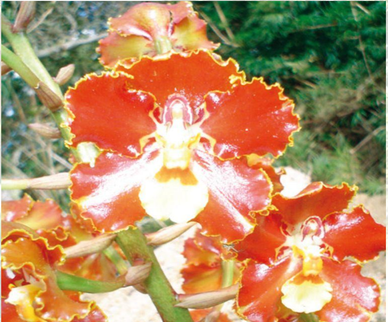
Nombre: Otoglossum brevifolium (Lindl.) Garay & Dunst. Procedencia: Montañas de Loja. Altitud: 2300 – 2700 msnm. Colección del JBRE, 2160 msnm.