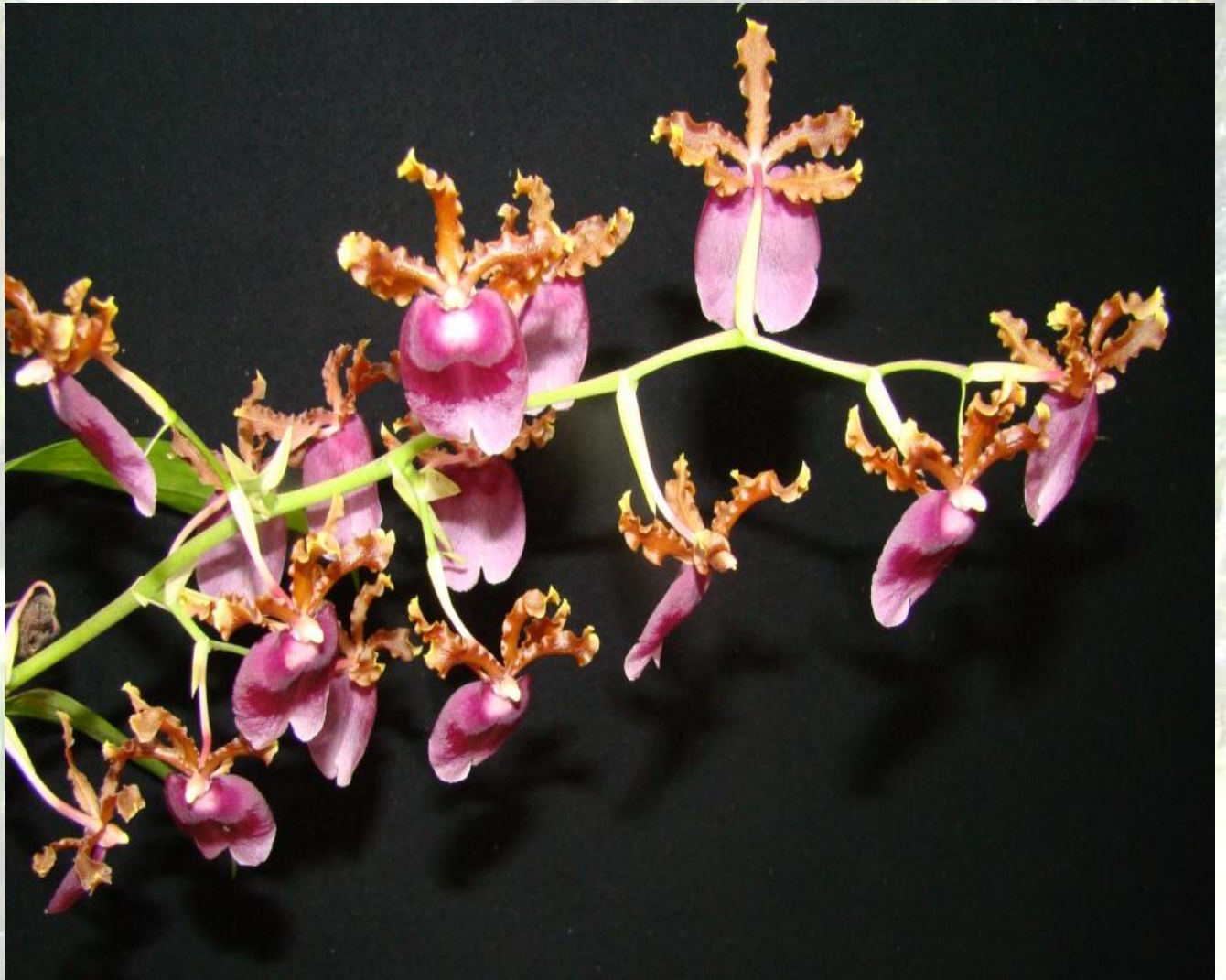
Nombre: Chamaeleorchis warszewiczii (Rchb.f.) Senghas & Lückel Procedencia: Montañas de Zamora. Altitud: 800 – 1400 msnm. Colección del JBRE, 2160 msnm.