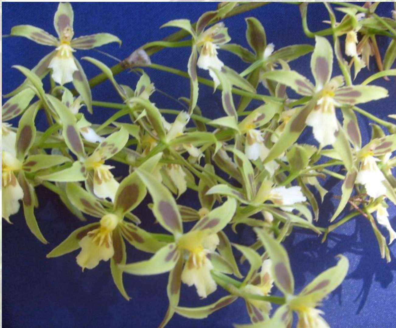
Nombre: Odontoglossum astranthum Linden & Rchb. f. Procedencia: Montañas de Loja. Altitud: 2200 – 2600 msnm. Colección del JBRE, 2160 msnm.