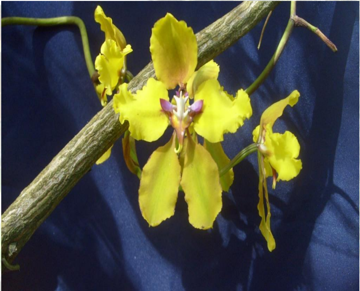
Nombre: Cyrtochilum macranthum (Lindl.) Kraenzl. Procedencia: Montañas de Loja. Altitud: 2000 – 2800 msnm. Colección del JBRE, 2160 msnm.