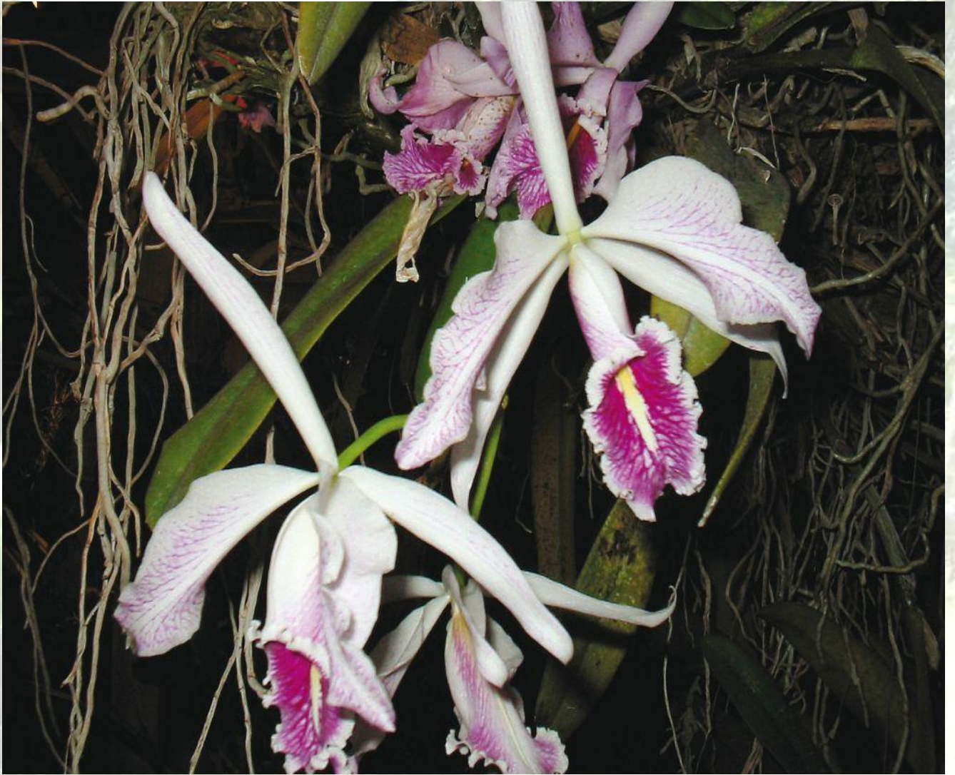
Nombre: Cattleya maxima `Semialba´ Procedencia: Loja. Altitud: 800 – 1400 msnm. Colección del JBRE, 2160 msnm.