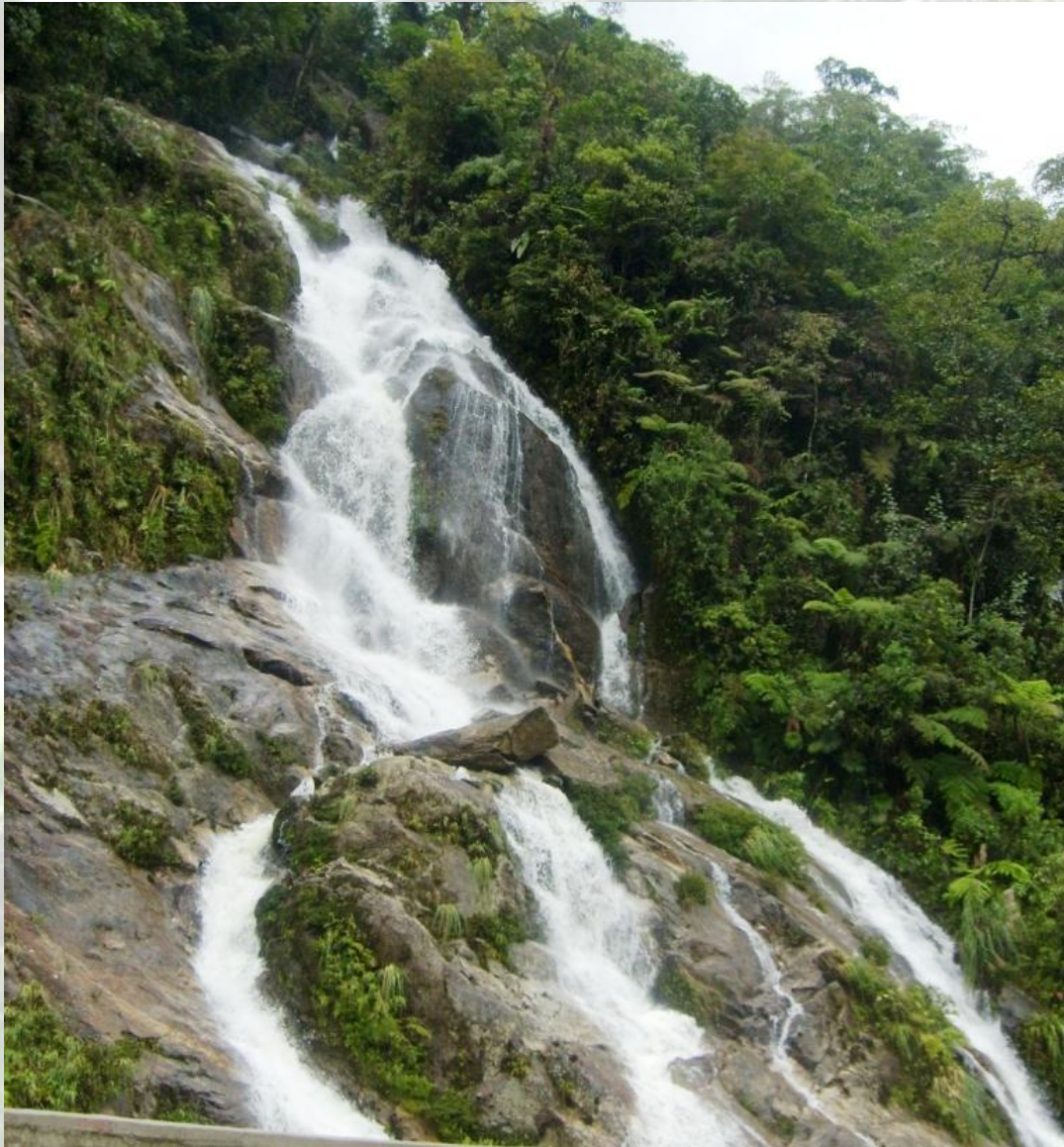
Cascada manto de la novia, ubicada a 20 km de la ciudad de Zamora. Paisaje de incomparable belleza, ahí moran las orquídeas en su entorno vegetal.