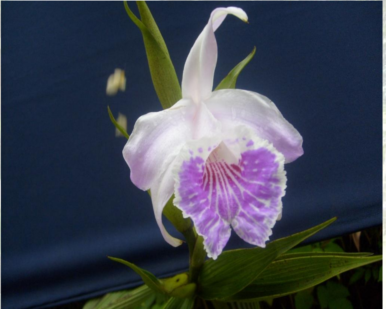
Nombre: Sobralia rosea Poepp. & Endl. Procedencia: Montañas de Zamora. Altitud: 800 – 1600 msnm. Colección del JBRE, 2160 msnm.