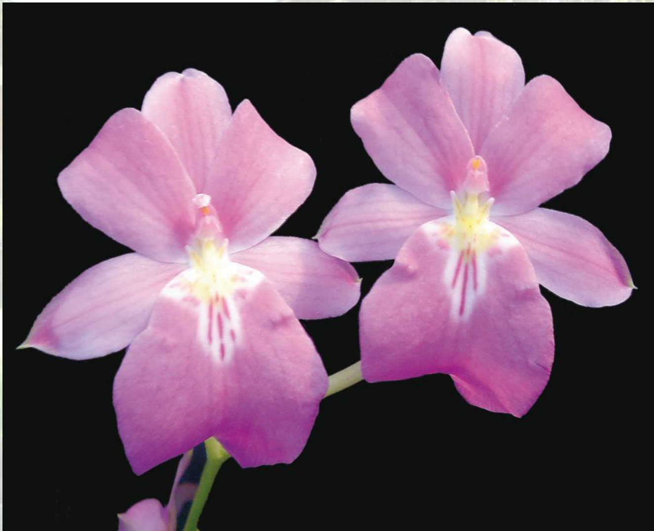
Nombre: Milniopsis vexillaria (Rchb. f.) God. – Leb. Procedencia: Montañas de Zamora. Altitud: 1200 – 2000 msnm. Colección del JBRE, 2160 msnm.