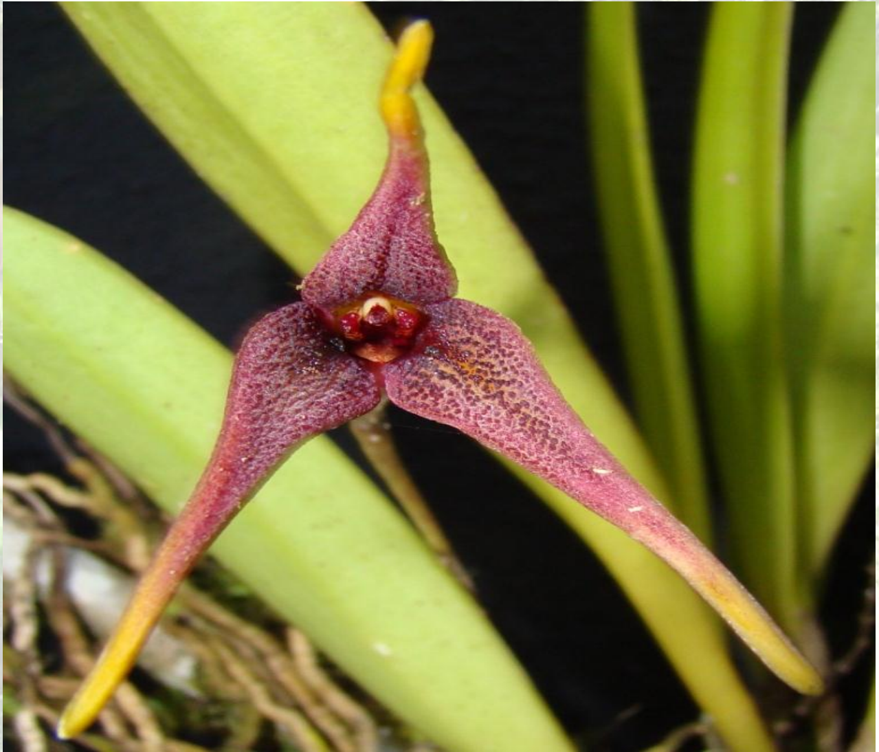
Nombre: Masdevallia sp. Procedencia: Montañas de Loja. Altitud: 2300 – 2800 msnm. Colección del JBRE, 2160 msnm.