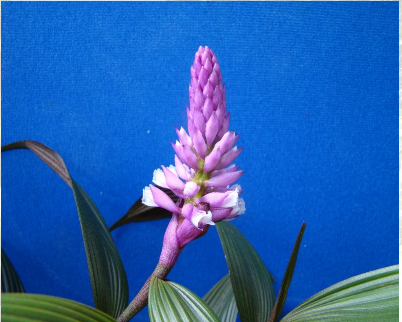
Nombre: Elleanthus robustus (Rchb. f.) Rchb. f. Procedencia: Montañas de Loja Altitud: 2300 – 2900 msnm. Colección del JBRE, 2160 msnm.