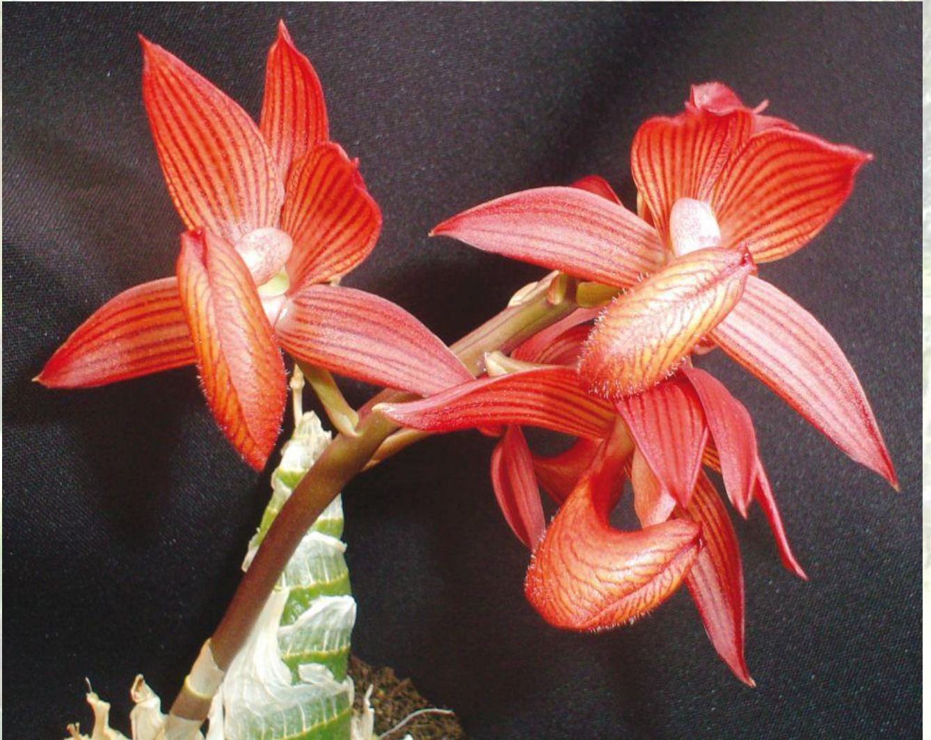
Nombre: Mormodes rolfeanum Linden Procedencia: Montañas de Zamora. Altitud: 600 – 1000 msnm. Colección del JBRE, 2160 msnm.