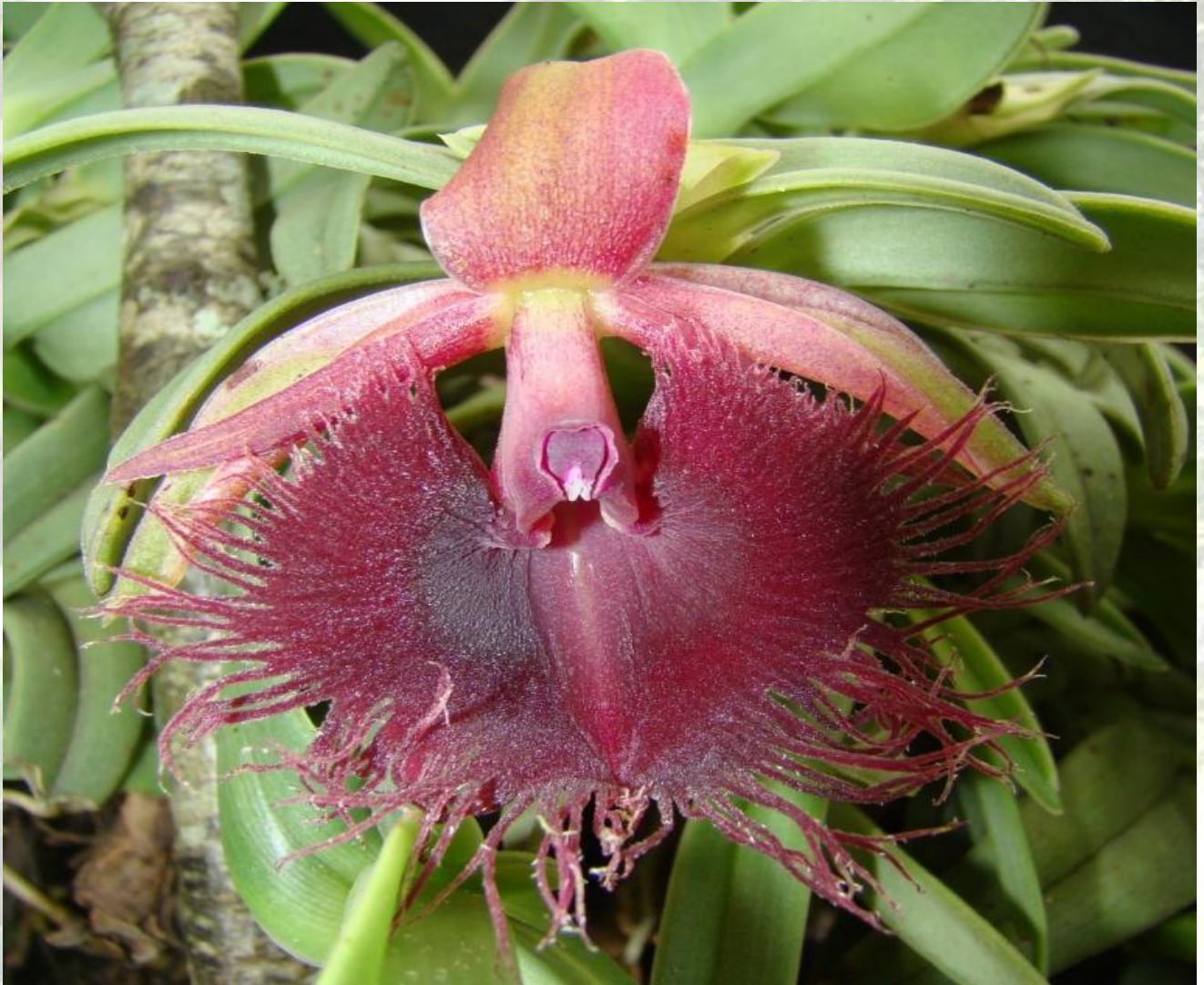
Nombre: Epidendrum medusae (Rcnb. f.) Pfitzer Sitio: Montañas de Loja. Altitud: 2200 – 2700 msnm. Colección del JBRE, 2160 msnm.