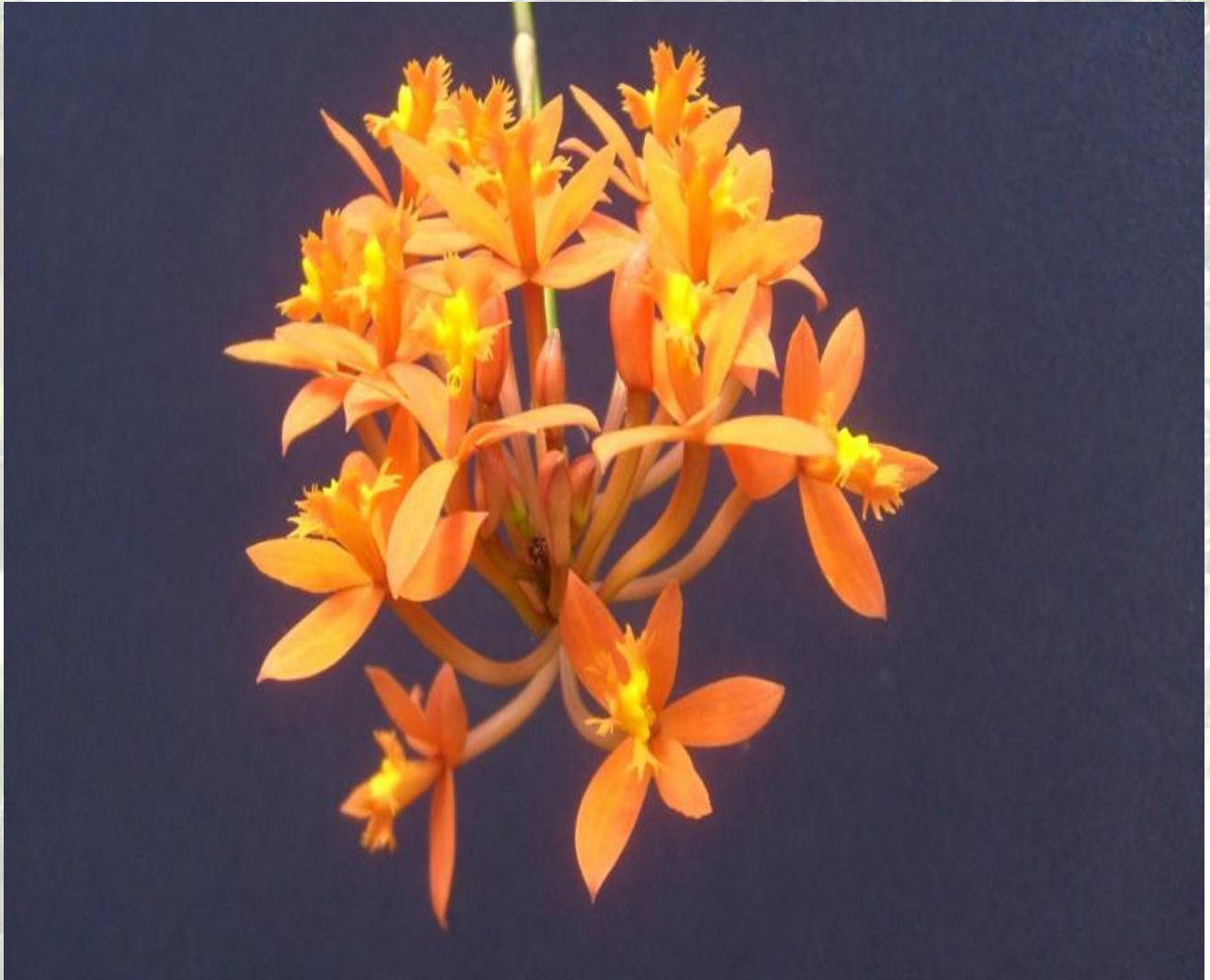
Nombre: Epidendrum elongatum Jaqc. Procedencia: Montañas de Loja. Altitud: 600 – 2400 msnm. Colección del JBRE, 2160 msnm.