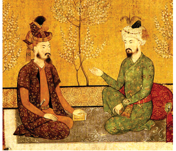
बाबर (सज्जे) आपने पुत्र शहजादा हमायू नाल

काबुल रहन्दां ही गुरू साहब नूं अहसास हो चुक्का सी कि बाबर हुन पंजाब दियां बाकी राजधानियां नूं वी लुटेगा। लगदे जलदी ही साहब नूं खबर मिल गई कि बाबरवानी (बाबर दी फौज) पंजाब वल रवाना हो रही