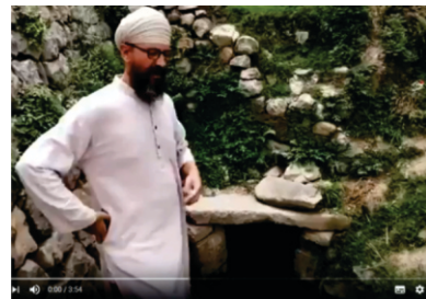
चशमा गुरू नानक हंगू। इक पठान गुरसिक्ख चशमे दे दरशन कराउदा होया

फिर नर्याब विखे चोखी सिक्खी सेवकी हो गई सी। इथे इक जोगी कोल गुरू साहब ठहरे सन जिस ने सिक्खी धारन कीती। इस संत ने सिक्खी दा चोखा प्रचार इलाके विच कीता। इथे गुरअसथान वी हुन्दा सी जिस दी सेवा तीसरे पातशाह सी गुरू अमरदास दी ओलाद विचों भल्ले सिक्खां कोल हुन्दी सी। अज्ज कुझ खबर नही कि