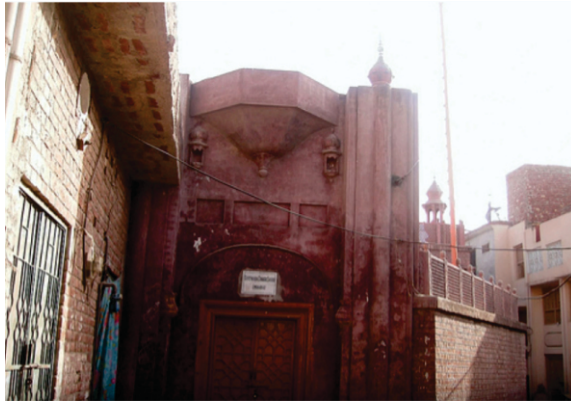
गुरदुआरा चक्की साहब । 1914 विच बनी इमारत दियां तसवीरां। खब्बे 2016 विच अते सज्जे 1932 विच। ध्यान वेखो इमारत ओहो ही है। इट वी मौजूदा भाव वड्डी लग्गी है।