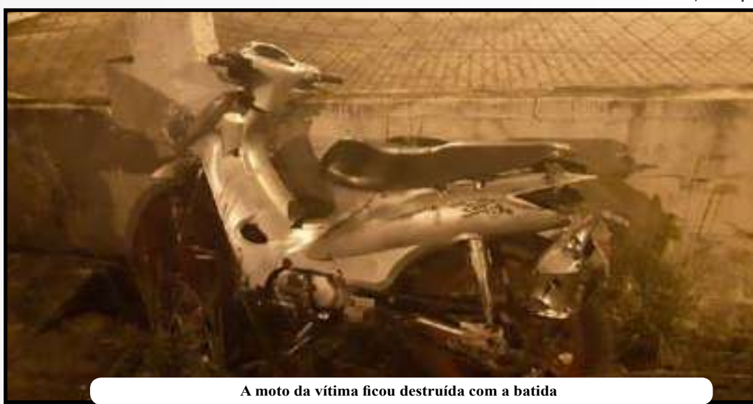
A moto da vítima ficou destruída com a batida

“Ele responderá a um Termo Circunstanciado de Ocorrência (TCO), lavrado pela equipe PRF, em seu desfavor sob a capitulação do art. 309 da Lei 9503/97: Dirigir veículo automotor, em via pública, sem a devida permissão, gerando perigo de dano. Ele deverá comparecer em juízo, quando convocado, para esclarecimentos e procedimentos legais”, explicou a corporação.