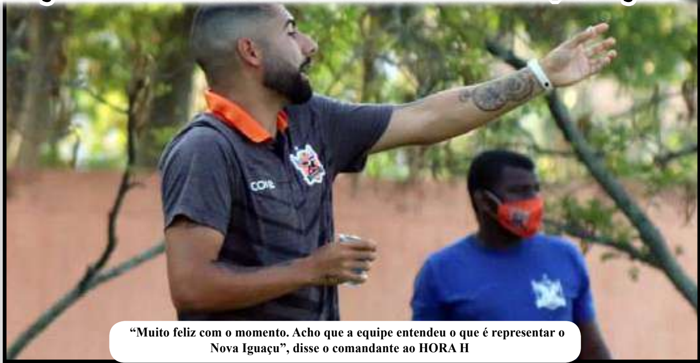
"Muito feliz com o momento. Acho que a equipe entendeu o que é representar o Nova Iguaçu", disse o comandante ao HORA H

"Conseguimos ser uma das melhores defesas de todo campeonato. Estamos vivendo um momento que o nosso sistema ofensivo também vem funcionando, marcando gols em todos os jogos. Conseguimos um 7 a 0