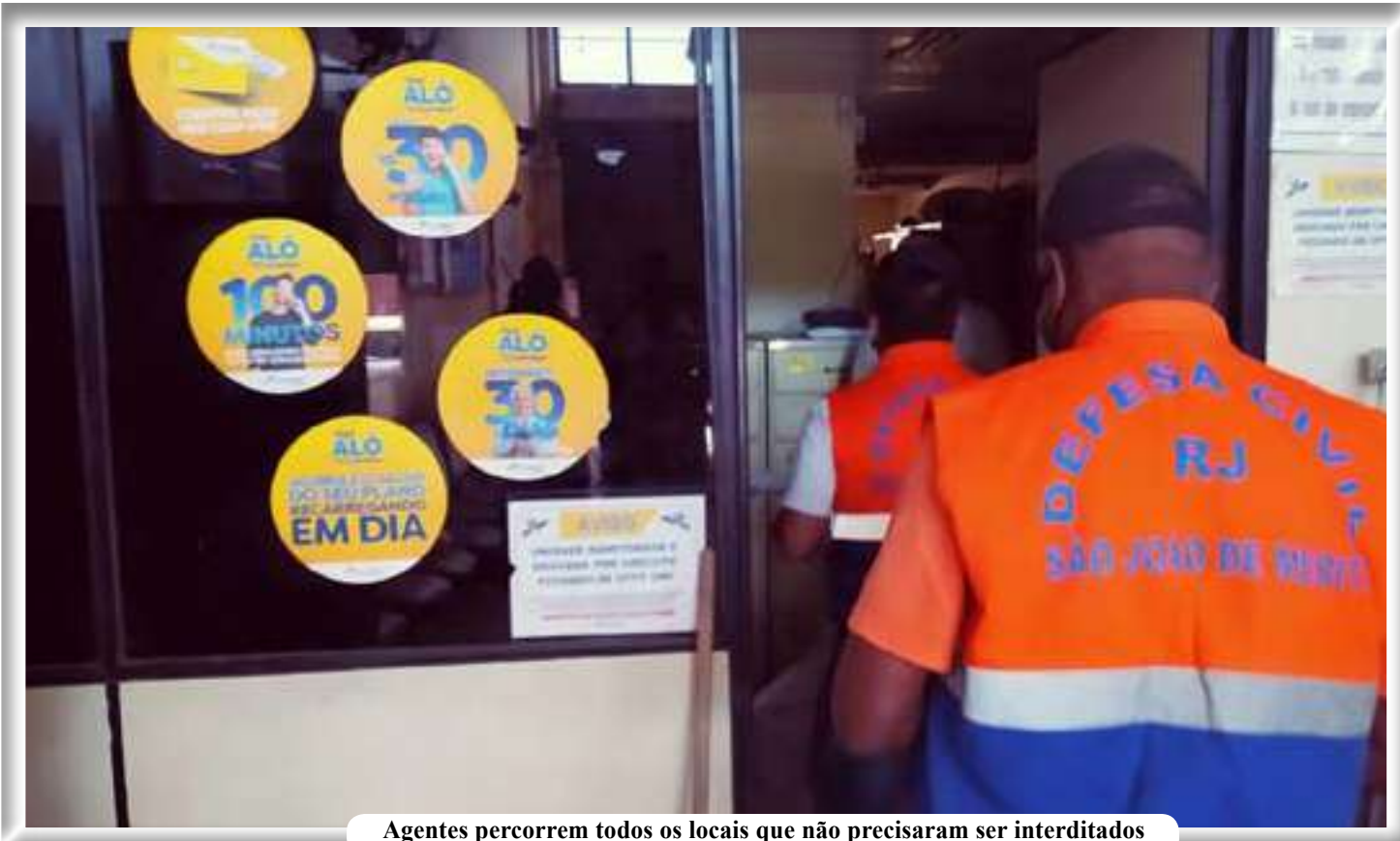
Agentes percorrem todos os locais que não precisaram ser interditados

Devido a explosão, parte da rede elétrica na região foi danificada, técnicos da concessionária de energia Light atuam para restabelecer a energia. Agentes da Secretaria de Transportes organizam o trânsito até a liberação do veículo para remoção e limpeza da pista.