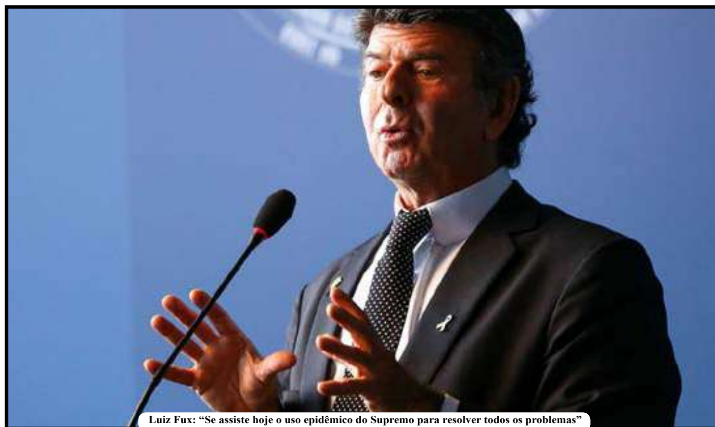
Luiz Fux: “Se assiste hoje o uso epidêmico do Supremo para resolver todos os problemas”

Fux disse que uma das características de uma democracia é o respeito às áreas de competência dos demais poderes. “Por essa razão, embora pareça muito simples, a Constituição estabelece que o Estado brasileiro tem três poderes harmônicos e independentes, sendo que o Judiciário é o único que tem aptidão