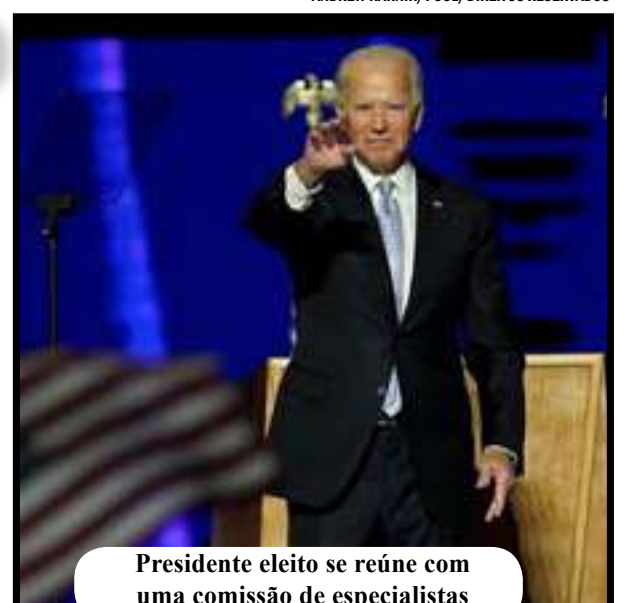
Presidente eleito se reúne com uma comissão de especialistas

O grupo de cientistas e especialistas coordenará a reação à pandemia com autoridades municipais e estaduais, o que inclui como reabrir escolas e empresas com segurança e lidar com as disparidades raciais.