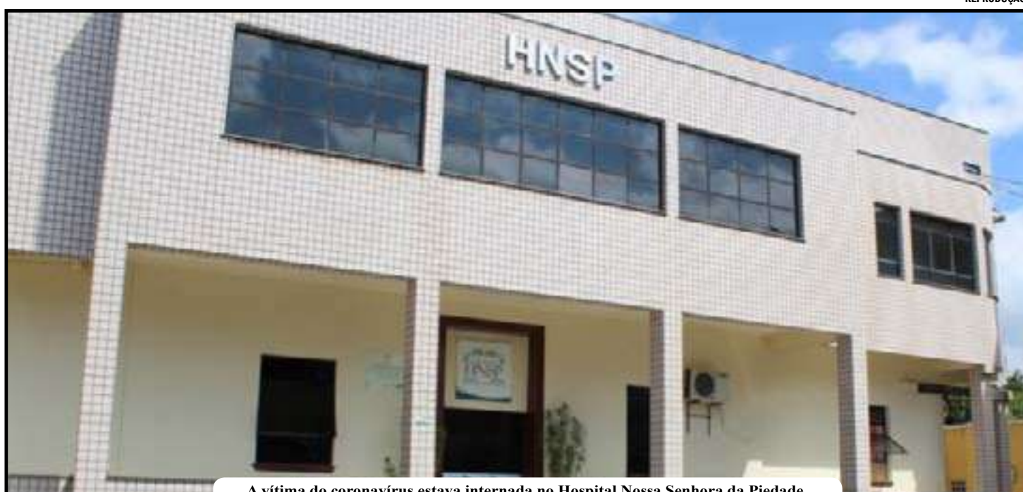
A vítima do coronavírus estava internada no Hospital Nossa Senhora da Piedade

Com esse caso, subiu para 40 o número de