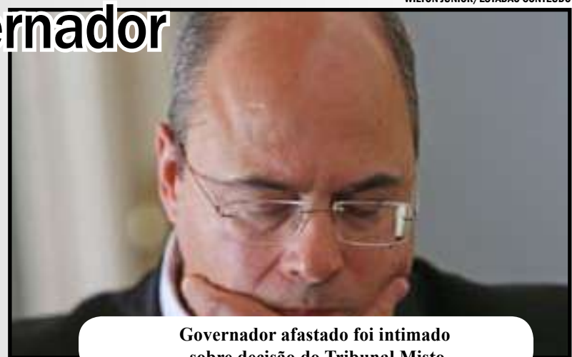
Governador afastado foi intimado sobre decisão do Tribunal Misto

Tribunal Misto, composto por deputados e desembargadores, decidiu por unanimidade dar seguimento ao processo de impeachment de Witzel. Wilson Witzel responde por irregularidades e desvios na área da Saúde.