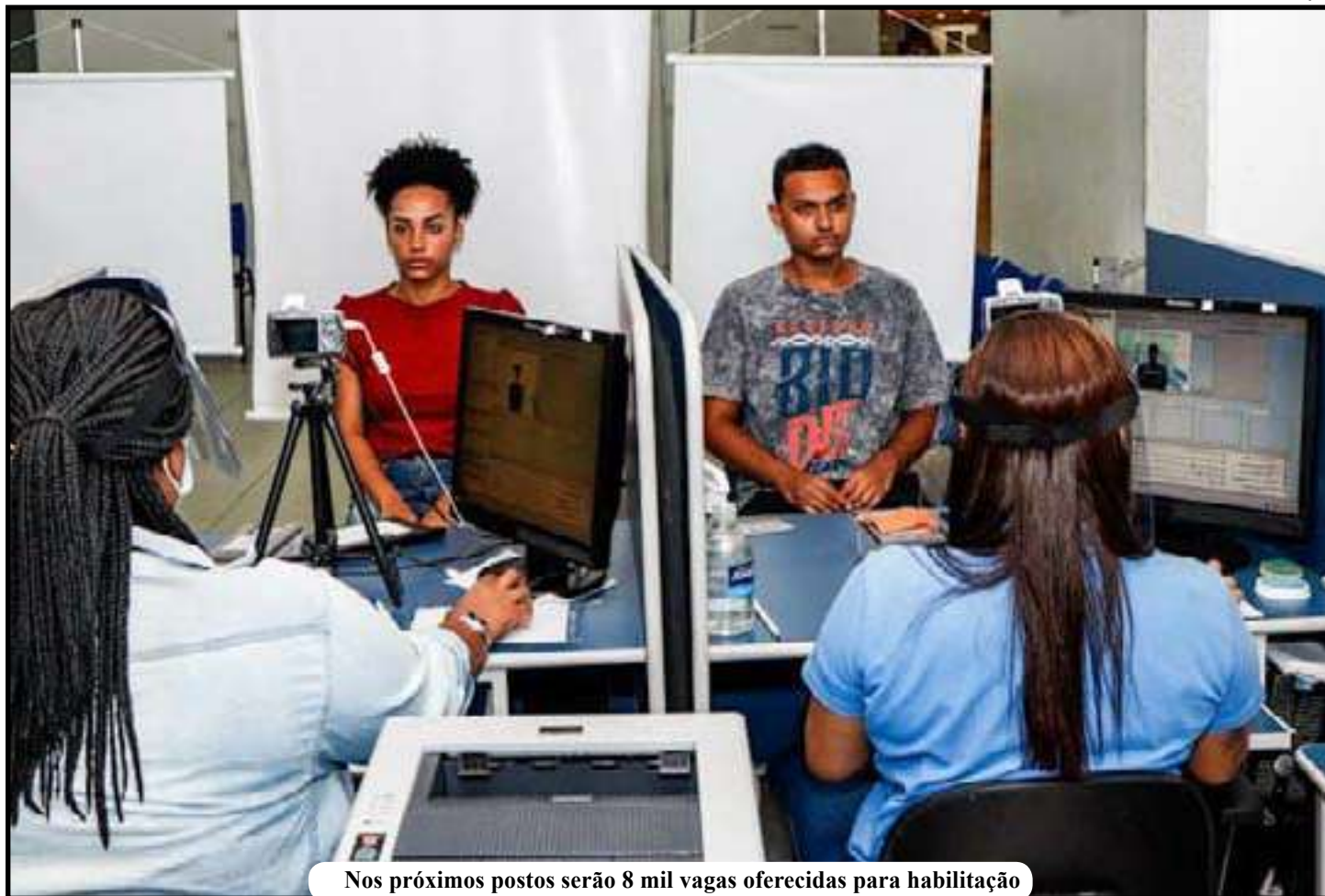
Nos próximos postos serão 8 mil vagas oferecidas para habilitação

Já no próximo sábado (14), na capital e Região Metropolitana serão reabertos os postos de Cantagalo, Centro, Guadalupe (Shopping Guadalupe), Ilha do Governador, Irará (Shopping via Brasil), Magé, Mesquita, Paracambi, Rio Bonito, São Gonçalo (Neves) e Sulacap Shopping. E no interior serão os postos de Araruama, Barra do Pirai, Barra Mansa, Bom Jesus de Itabapoana, Itaguaí, Itaocara, Nova Friburgo, Paraíba do Sul, Resende, Teresópolis e Vassouras.