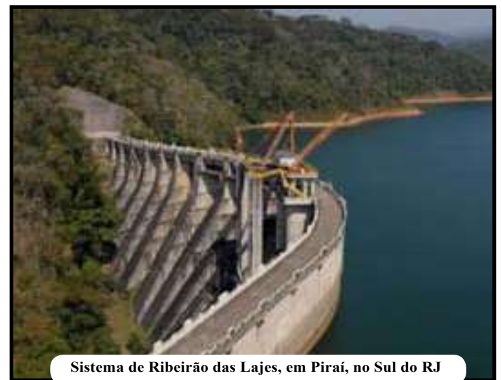
Sistema de Ribeirão das Lajes, em Pirai, no Sul do RJ

Moradores de imóveis que dispõem de sistema de reserva (caixas d'água e/ou cisterna) não devem sofrer desabastecimento. Mesmo assim, a companhia pede que os clientes usem água de forma equilibrada, e adiem tarefas não essenciais que exijam grande consumo. Vale informar que clientes da Ceade podem solicitar o abastecimento por caminhão pipa pelo telefone 0800-282-1195.