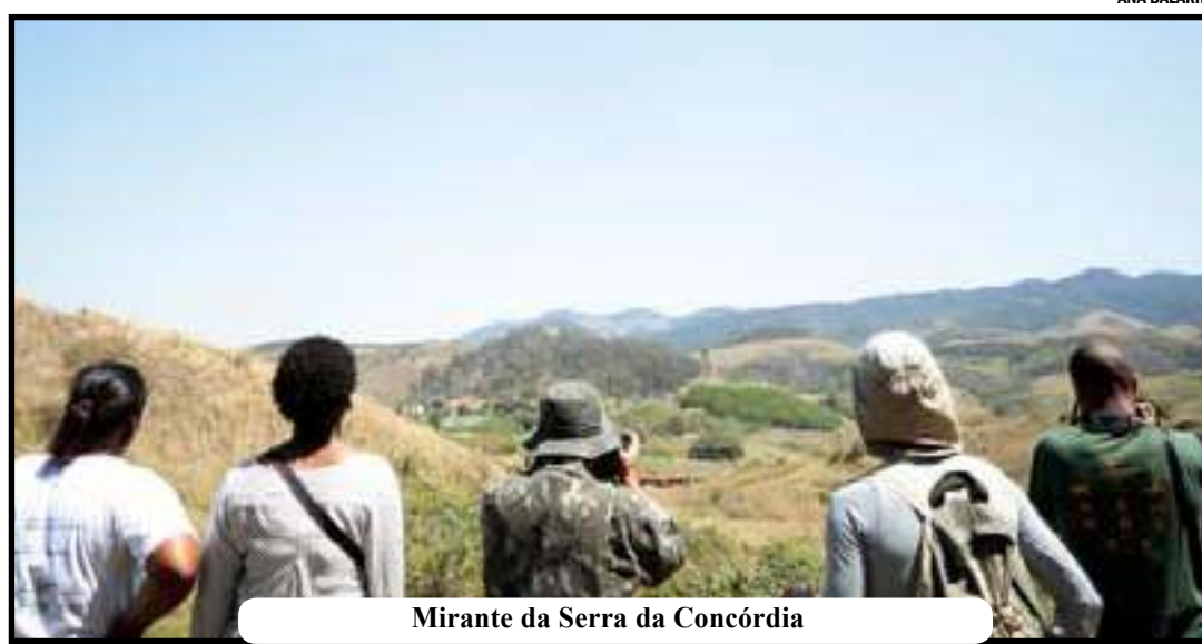
Mirante da Serra da Concórdia

Um evento vai marcar a reabertura na sede do parque, que fica na Rua Barão de Santa Mônica,