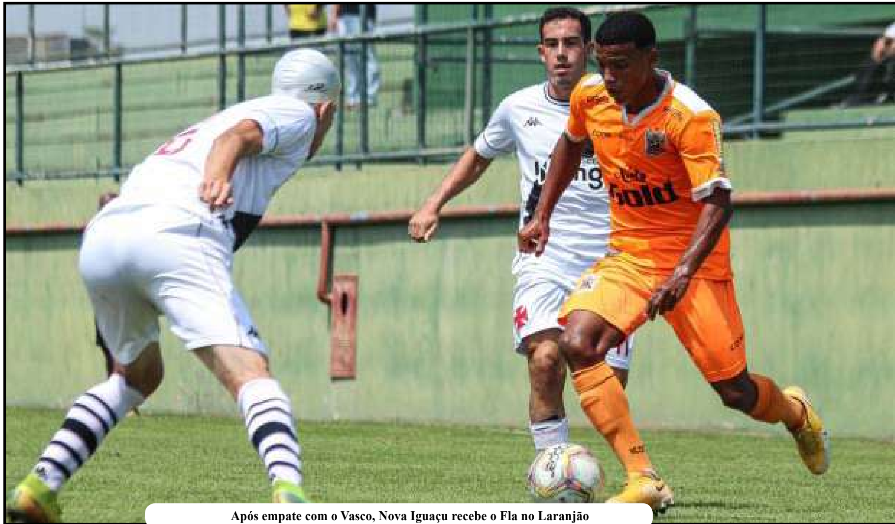
Após empate com o Vasco, Nova Iguaçu recebe o Fla no Laranjão

Volta Redonda, que goleou a Portuguesa por 4 a 1, e Nova Iguaçu, que empatou em 1 a 1 com o Vasco, no Nivaldão, ficaram nos dois primeiros lugares, respectivamente, no Grupo B. O Voltaço receberá o