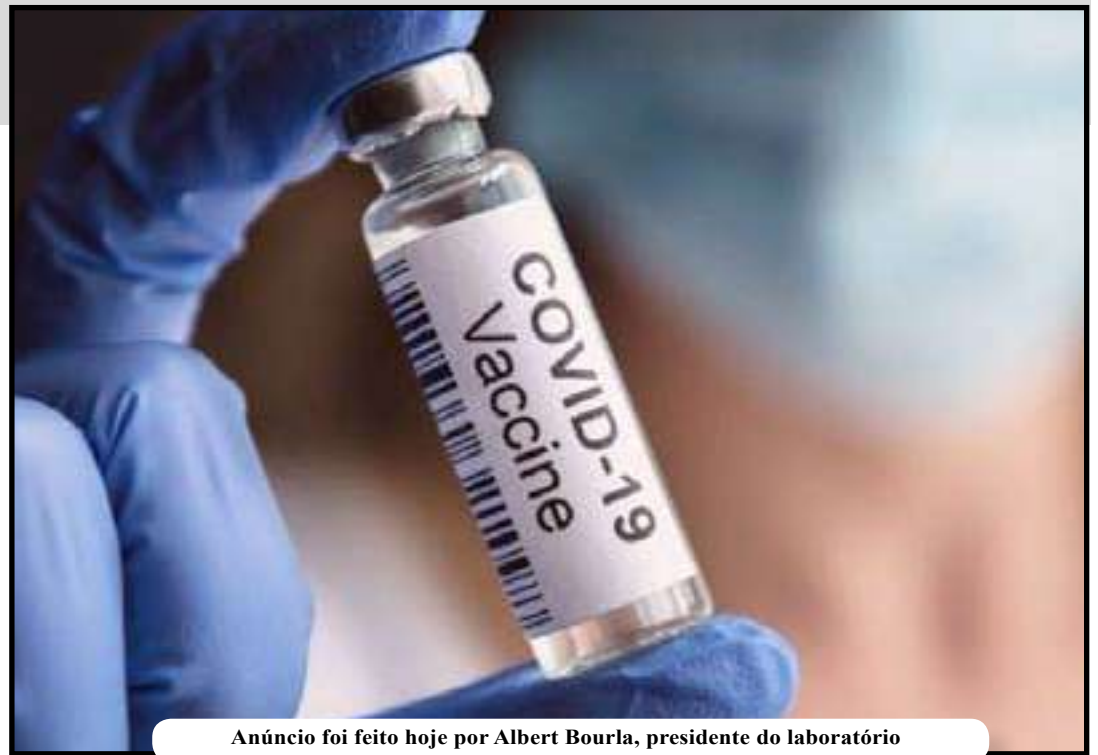
Anúncio foi feito hoje por Albert Bourla, presidente do laboratório

anunciarem dados bem-sucedidos de um ensaio clínico em larga escala com uma potencial vacina contra o novo coronavírus. As empresas disseram que, até o momento, não encontraram nenhuma preocupação de segurança com a candidata a imunizante e que esperam pedir autorização para uso emergencial da vacina nos Estados Unidos (EUA) neste mês.