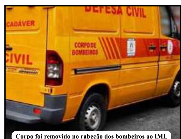
Corpo foi removido no rabeção dos bombeiros ao IML

Segundo o 29º BPM (Itaperuna), o pescoço da mulher foi cortado e uma chave de fenda encravada em seu ouvido. Testemunhas contaram que um homem de 37 anos com jaqueta preta, bermuda escura e chinelo foi visto saindo da casa por volta das 4 horas. O suspeito foi localizado e na residência dele foi