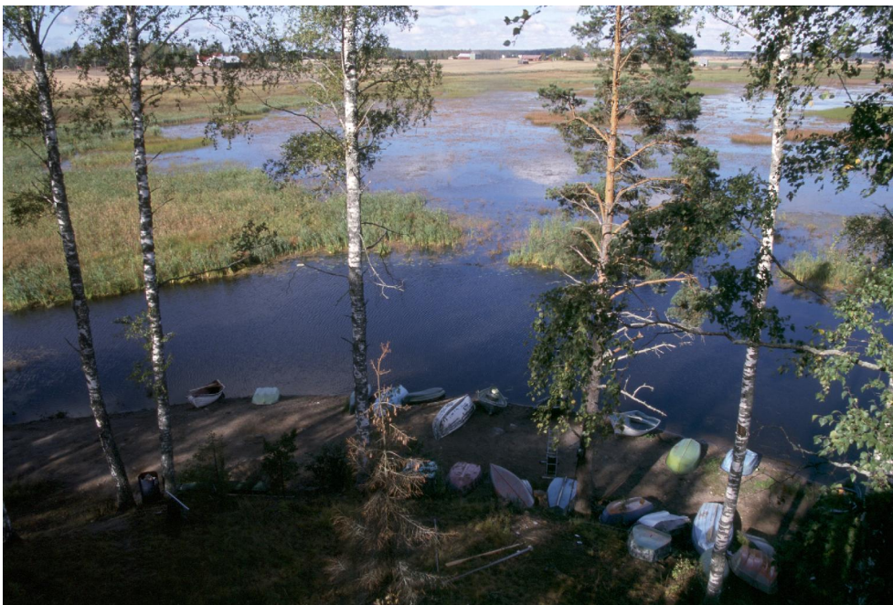
Lintujärviin kohdistuu monenlaisia käyttöpaineita. Kuva Kanteleenjärven lintutornista Pukkilassa.

Lintuvesillä on tyypillisesti runsas vesikasvillisuus, jonka myötä umpeenkasvu usein uhkaa alueita. Linnuston elinympäristöjen turvaaminen pitkällä aikavälillä saattaa edellyttää aktiivisia kunnostustoimia. Lintuvesien kunnostustarpeesta on olemassa kattavat tiedot selvitysten pohjalta (mm. Mikkola-Roos 2003).