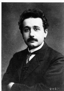
momento llamado Albert Einstein.

En 1905 Nernst es propuesto como director del Instituto de Química Física de Berlín. En su nuevo puesto tiene todos los medios para desarrollar la investigación necesaria para la contrastación de su hipótesis y las consecuencias de la misma. Así al interés por determinar los calores específicos a distintas temperaturas se suma ahora el