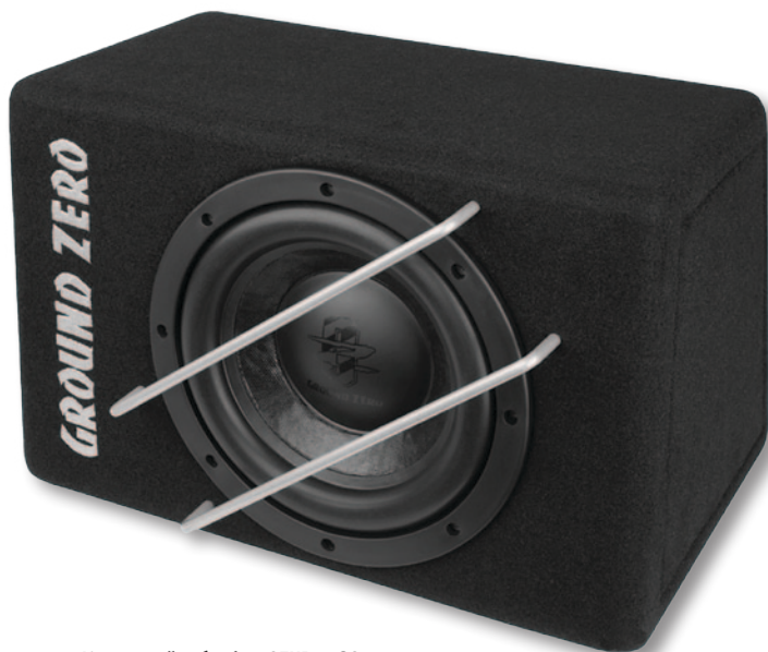
Корпусный сабвуфер GZUB 20SQ

Сабвуферы Uranium GZUW 10SQX (10 дюймов) и GZUW 12SQX (12 дюймов), разработанные с применением технологии Klipfel, отличаются увеличенной мощностью и улучшенным качеством звука. В них применена двойная магнитная система и высококачественные крепежи. Дизайн отличает бумажный пылезащитный колпак с черным матовым покрытием и блестящим логотипом.