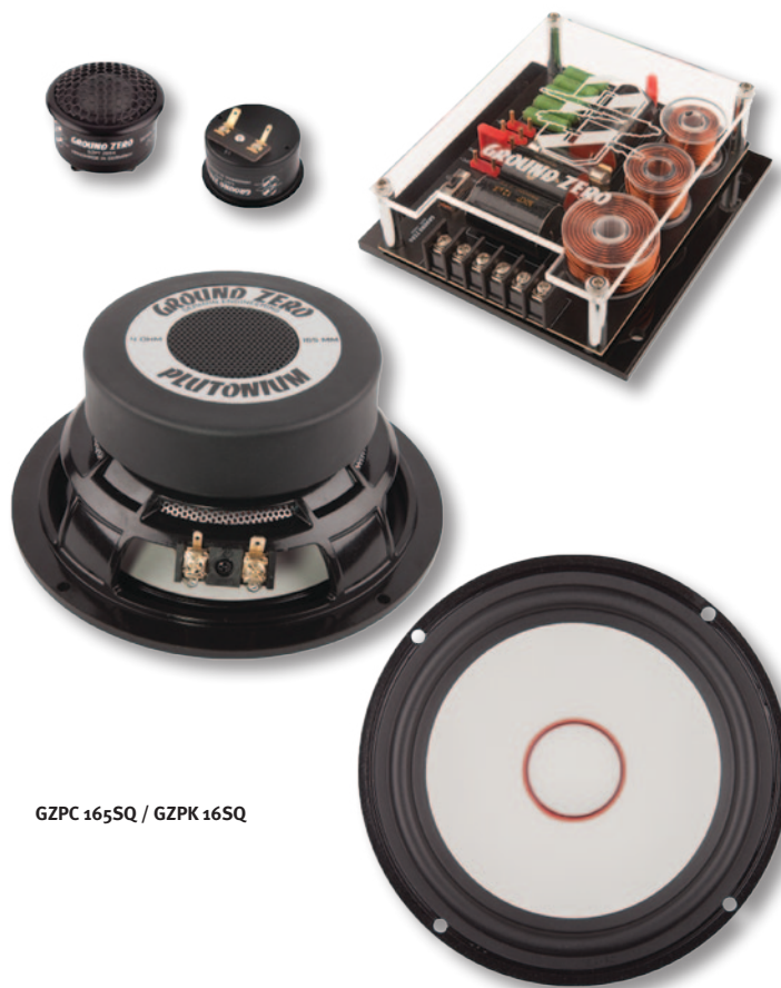
GZPC 165SQ / GZPK 165Q

Сабвуферы Nuclear из ряда GZNW ..XII получили мощную 75-мм ССА звуковую катушку (алюминиевая намотка с медным покрытием), прочный алюминиевый диффузор и наружный U-образный подвес. Модели из ряда GZNW ..XSPL отличаются армированным бумажным диффузором и наружным подвесом в форме V. В серию также входят мощные надежные усилители с поддержкой нагрузки в 1 Ом, оснащенные широкополосными фильтрами с функцией отключения, алюминиевыми радиаторами и позолоченными клеммами.