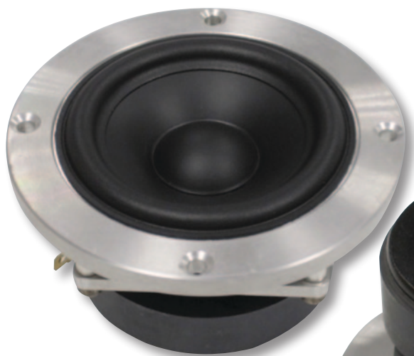
GZPM Reference 80

щен высокотехнологичной корзиной из двойного материала, многослойным диффузором с алюминиевым покрытием и линейризованным приводом. Он подходит для небольших корпусов как закрытого, так и открытого типа. Кроме того, в серии Reference предлагается три типоразмера RCA-кабелей с разъемами из родия, карбоновой оболочкой и проводниками Continuous Casting (OCC) сверхупорядоченной кристаллической структуры.