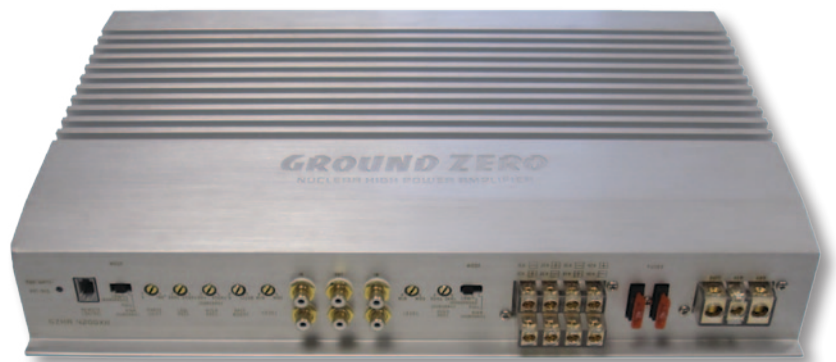
Усилитель GZHA 4200XII