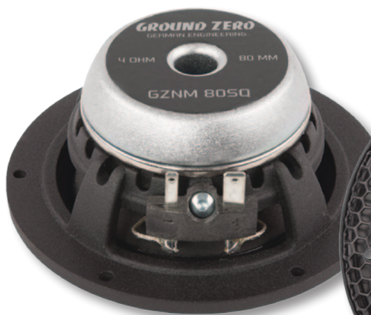
Сабвуфер GZUB 20SQ

В серии Nuclear представлены высококачественные продукты, изготовленные в Германии. Мидренчи имеют бумажный 80-мм диффузор и мощный плоский неодимовый магнит. Компоненты серии представлены как в наборах (вплоть до трехполосного), так и по отдельности.