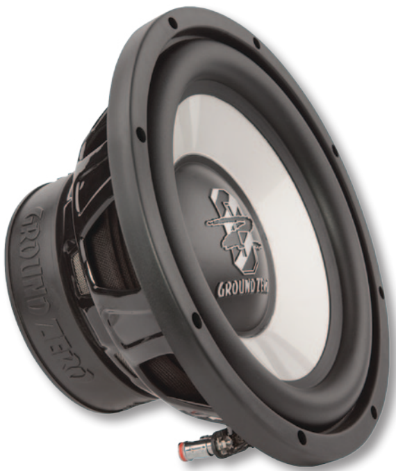
Сабвуфер GZIW 300X