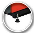
Kazán színtező lábak