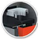
Retorta öntöttvas égőfej