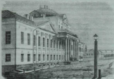
Казандагы Беренче гимназия.

ларның бетле бәздән тегелгәнә 25 тиен. 6) Читек—сәхтияң күннән, ефәк жөй белән бизәкләнгән, кызыл, сары, яшел төстә, 9 тәнкә тора, алтын белән чигелгәнә 18дән 30 сумга кадәр бәйләнә. Оек урынына балтырны юка сөлге белән урылар. 7) Кызыл сәхтияң күннән, алтын жеп белән тегелгән туфли бәясә—7дән 10 сумга кадәр. 8) Хатын-кыз түшен каплап торган, ука белән бизәп, парчадан эшләнгән күкрәкчә—10 тәнкә тора. 9) Ефәктән ука белән каймалап тегелгән, тегзә чаклы төшөп торган, уң якта кульяулык тыгу өчен кесәсе булган (татар хатын-кызы кульяулыкны беркайчан да кулына тотып тормый) камзул 80 сумнан 400 сумга чаклы бәйләнә. 10) Шактый озын жиндә, озын итәклә, укалап парча яисә ефәктән тегелгән жилән байлар өчен 2000 тәнкәгә житә. Хәзер инде жилән модалдан чыгып килә; аның урынын озын жиндә камзул биләп бара; байларның парчадан, ярлыларныкы кытайка яисә кижә мамыктан, эчә төлкә яисә куян тиресеннән астарлап тегелә. 11) Алтын чәчәклә, арканы ябып торган фата (куш жаулык) калфак өстенә беркетеп куела,