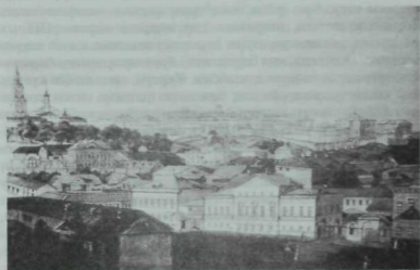
Университет күренеше. Болак ягынан төшерелгән фото.

Эшчән татарларның бакчасында бәрәнге, суган, чөгендер, кишер-кәбестә кебек яшелчәләр мул үстерелеп, кышка сакларга куела.