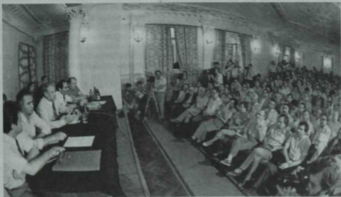
Татарстан язучыларының Россия Югары Советы рәисе Борис Ельцин белән очрашу күренеше. 9 август 1990 ел.