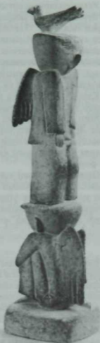
Сак-Сок. 1992 ел. Шамот. К. Жамитев эше.

Укучыларны үгетләп торунун кирәге юк. Әйт кенә—үзләре үк торып йөгәрәчәкләр. Аларга, ни өчендер, дөрестән азат ителү кыйммәт. Аның каравы, Кавый абый аларның мөмкинлекләрен чамалый алды. Белде ул шулай ук нәрсә “ярый”, нәрсә “ярамый”. Әйттик, сентябрь аенда балалар хезмәтен бәрәнге-чөгендер алуда кулланы—хәтта ай буге да—ярый. Шулу ук балаларны трактор арбасына утыртып, дөресрәге, дынгычлап төяп (баскан килеш!) чокырлы-авыш юллардан нинди дә булса эшкә алып йөрүләр, яисә шулу ук урман кисүләр (олы-олы агачлар була дигән сүз бит) балалар өчен каттый тыелган—шуна күрә ярамый булып чыга. Шунда берәр хәл килеп чыкса? Аның, дөресен әйткәндә,