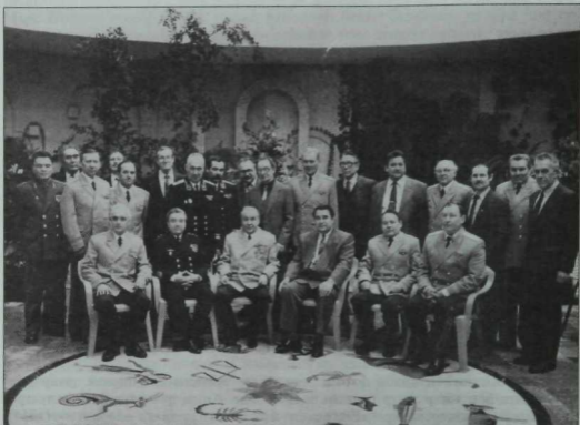
Татар генераллары бергә жылыгач (араларында безнең язучылар һәм журналистлар да бар). Мәскәү. 1993 ел.