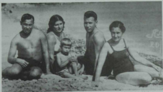
Муса Жәлил һәм Галин Кашшаф гаиләләре белән Кара диңгез буенда. Ялта, 1940 ел.