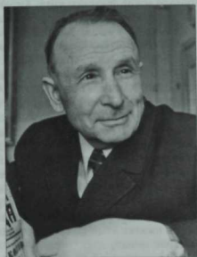
Сибгат Хәким. 1973 ел.