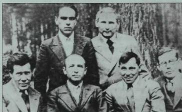
Ватан сугышы баиланырга бер ел калганда алынган рәсем. Сулдан уңга—Хәсән Туфан, Әхмәт Исхак, Сибгат Хәким, Шәйхи Маннур, Муса Жәлил, Әхмәт Фәйзи. Васильево ял йорты. 1940 ел.