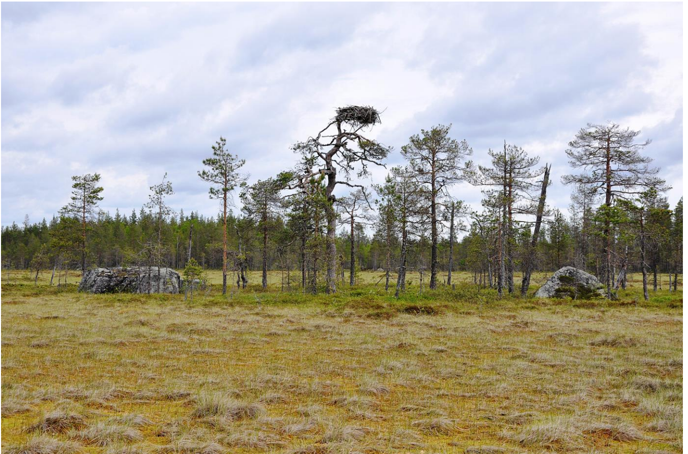
Kuva 9. Seläntauksen soihin kuuluva Pihtiputaan Niskakankaanneva

Luonnosvaiheen jälkeen tehdyt muutokset: Luonnonsuojelulailta toteutetut tai toteutettavaksi tarkoitetut alueet merkittiin kaavaan SL-merkinnällä. Lisäksi kaikki Natura-alueet osoitetaan kaavakartalla erillisellä nat-merkinnällä, mikä korostaa ja edistää Natura-alueiden huomioon ottamista. Maakuntakaava ei todennäköisesti merkittävästi heikennä alueen Natura-arvoja.