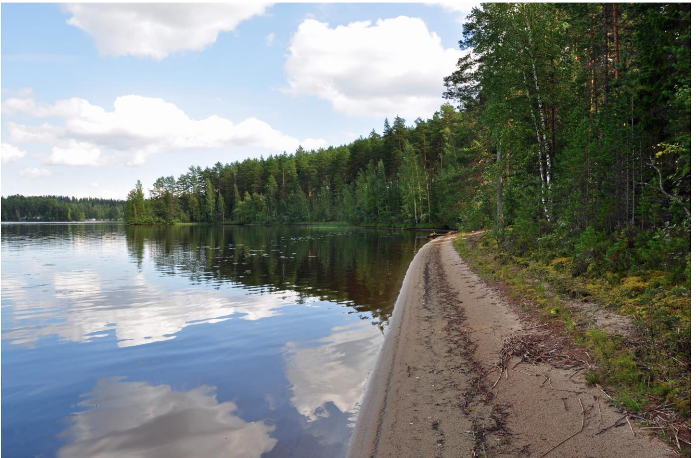
Kuva 7. Jämsän Kankarisveten työntyvän Rasuanniemen hiekkarantaa

Luonnosvaiheen jälkeen tehdyt muutokset: Luonnonsuojelulailla toteutetut tai toteutettavaksi tarkoitetut alueet merkittiin kaavaan SL-merkinnällä. Lisäksi kaikki Natura-alueet osoitetaan kaavakartalla erillisellä nat-merkinnällä, mikä korostaa ja edistää Natura-arvojen (mm. liito-orava) huomioon ottamista. Maakuntakaava ei todennäköisesti merkittävästi heikennä alueen Natura-arvoja.