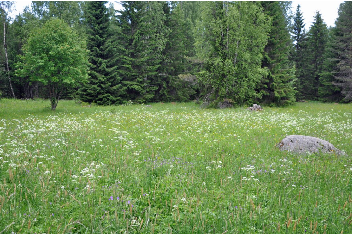
Kuva 8: Pihtiputaan Makkaran niitty

Luonnosvaiheen jälkeen tehdyt muutokset: Luonnonsuojelulailailla toteutetut tai toteutettavaksi tarkoitetut alueet merkittiin kaavaan SL-merkinnällä. Lisäksi kaikki Natura-alueet osoitetaan kaavakartalla erillisellä nat-merkinnällä, mikä korostaa ja edistää Natura-alueiden huomioon ottamista. Kaavasta poistettiin kaikki turvetuotantoalueet. Turvetuotannon poistaminen ei suoraan vaikuta nykytilanteeseen, mutta kaava ei enää tue turvetuotantoa ko. alueilla, mikä voi tulevaisuudessa vähentää mahdollisten haitallisten vaikutuksien syntymistodennäköisyyttä mm. veden laatuun ja siitä riippuvaisen eliöstön esiintymiseen (mm. saukko). Maakuntakaava ei todennäköisesti merkittävästi heikennä alueen Natura-arvoja.