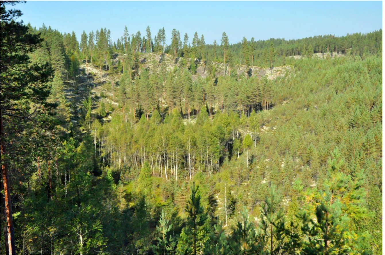
Kuva 2. Laukaan Hietasyrjänkangas