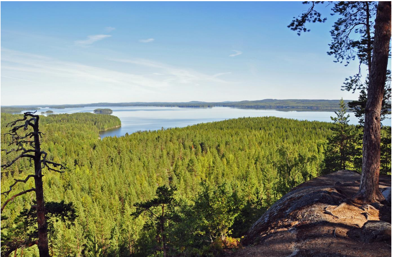
Kuva 3. Laukaan Hyppäänvuorelta avautuva maisema

Luonnosvaiheen jälkeen tehdyt muutokset: Luonnonsuojelulailla toteutetut tai toteutettavaksi tarkoitetut alueet merkittiin kaavaan SL-merkinnällä. Lisäksi kaikki Natura-alueet osoitetaan kaavakartalla erillisellä nat-merkinnällä, mikä korostaa ja edistää Natura-alueiden huomioon ottamista. Kaavasta poistettiin kaikki arvokkaat geologiset muodostumat. Koska maisema-alueella ei ole vielä virallista valtakunnallista statusta, alue muutettiin maakunnalliseksi. Geologisten muodostumien poistamisen jälkeen kaava ei tue alueen luontoarvojen säilymistä enää yhtä voimakkaasti, mutta kallioalueen valtakunnallinen arvo ei kuitenkaan häviä. Maakuntakaava ei todennäköisesti merkittävästi heikennä alueen Natura-arvoja.