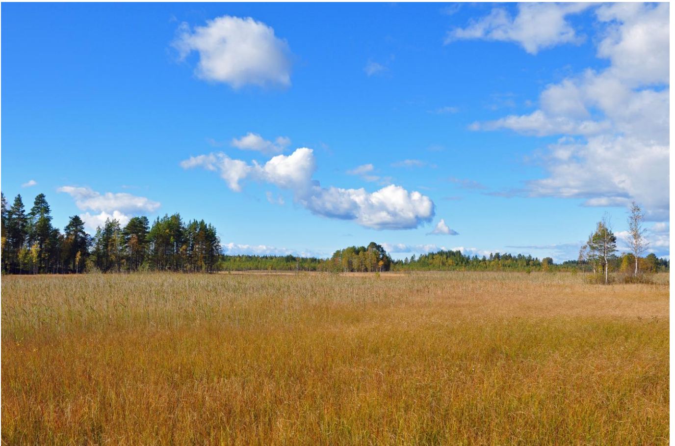
Kuva 10. Konneveden Isosuo

Luonnosvaiheen jälkeen tehdyt muutokset: Luonnonsuojelulailta toteutetut tai toteutettavaksi tarkoitetut alueet merkittiin kaavaan SL-merkinnällä. Lisäksi kaikki Natura-alueet osoitetaan kaavakartalla erillisellä nat-merkinnällä, mikä korostaa ja edistää Natura-alueiden huomioon ottamista. Maakuntakaava ei todennäköisesti merkittävästi heikennä alueen Natura-arvoja.