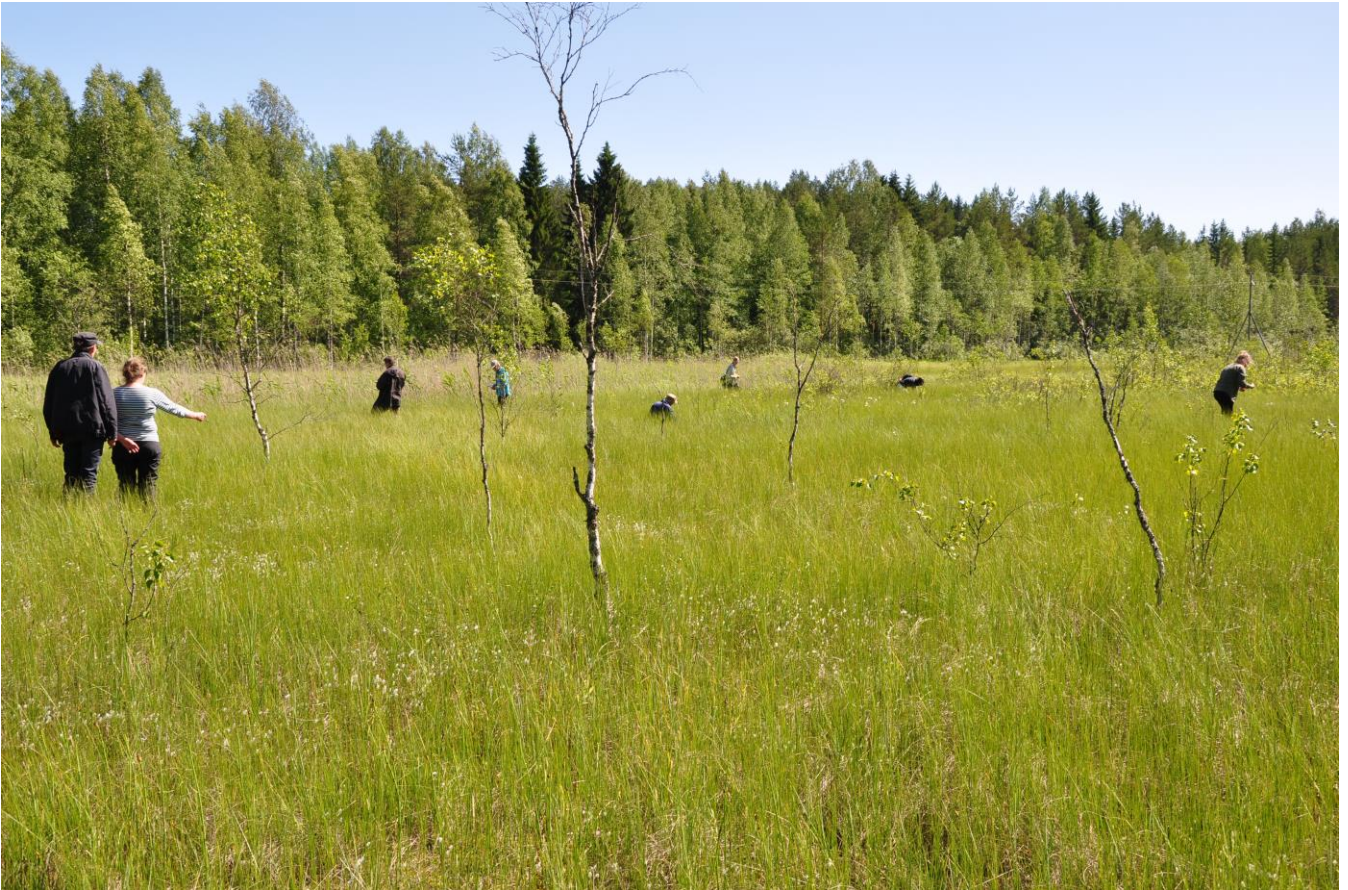
Kuva 1. Konneveden Ylä-Tankosen suo