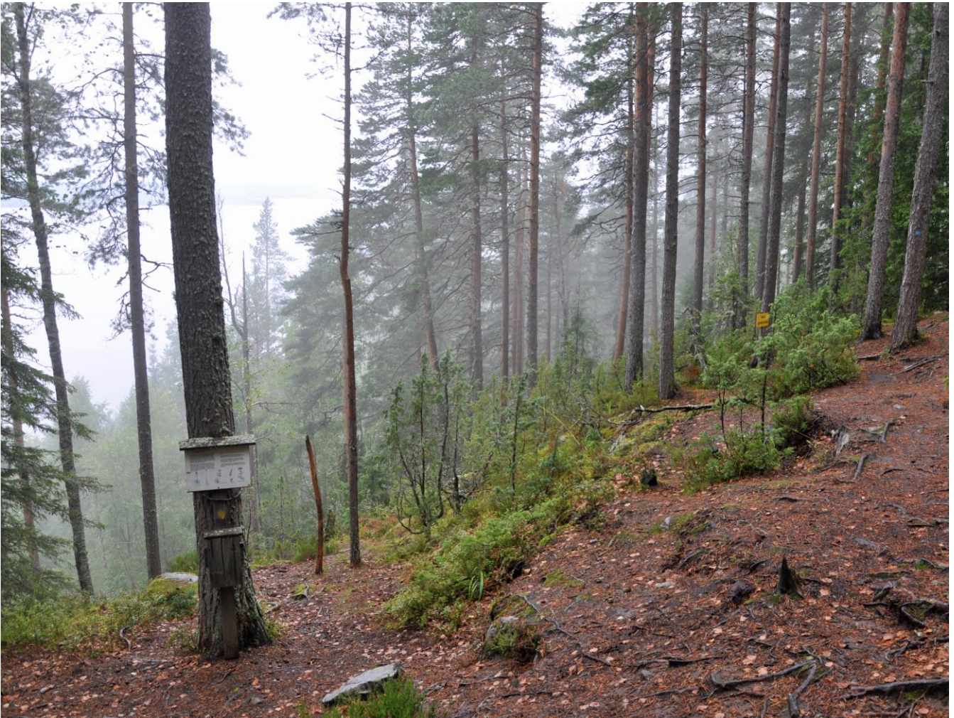
Kuva 6. Jyväskylän Vaarunvuorten Vaarunjyrkkä