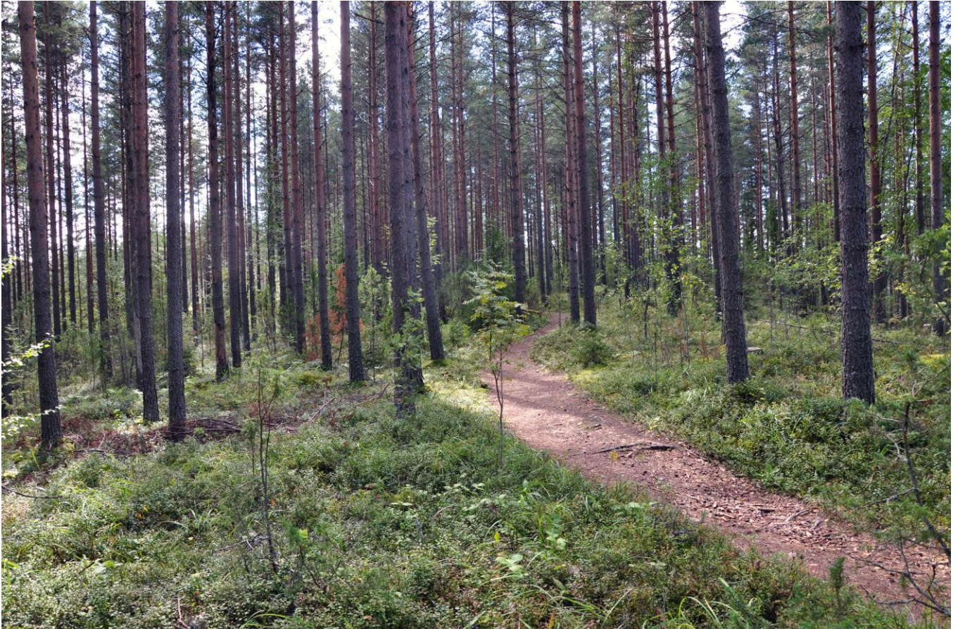
Kuva 4. Muuramenharju on yksi Keski-Suomen valtakunnallisesti arvokkaista harjuista

Luonnosvaiheen jälkeen tehdyt muutokset: Luonnonsuojelulla toteutetut tai toteutettavaksi tarkoitetut alueet merkittiin kaavaan SL-merkinnällä. Lisäksi kaikki Natura-alueet osoitetaan kaavakartalla erillisellä nat-merkinnällä, mikä korostaa ja edistää Natura-alueiden huomioon ottamista. Kaavasta poistettiin kaikki arvokkaat geologiset muodostumat ja Muuramenharjun S-merkintä. Poistamisen jälkeen kaava ei tue alueen luontoarvojen säilymistä enää yhtä voimakkaasti, mutta harjualueen valtakunnallinen arvo ei kuitenkaan häviä ja harjuarvojen säilyminen on varmistettu nat-merkinnällä. Maakuntakaava ei todennäköisesti merkittävästi heikennä alueen Natura-arvoja.