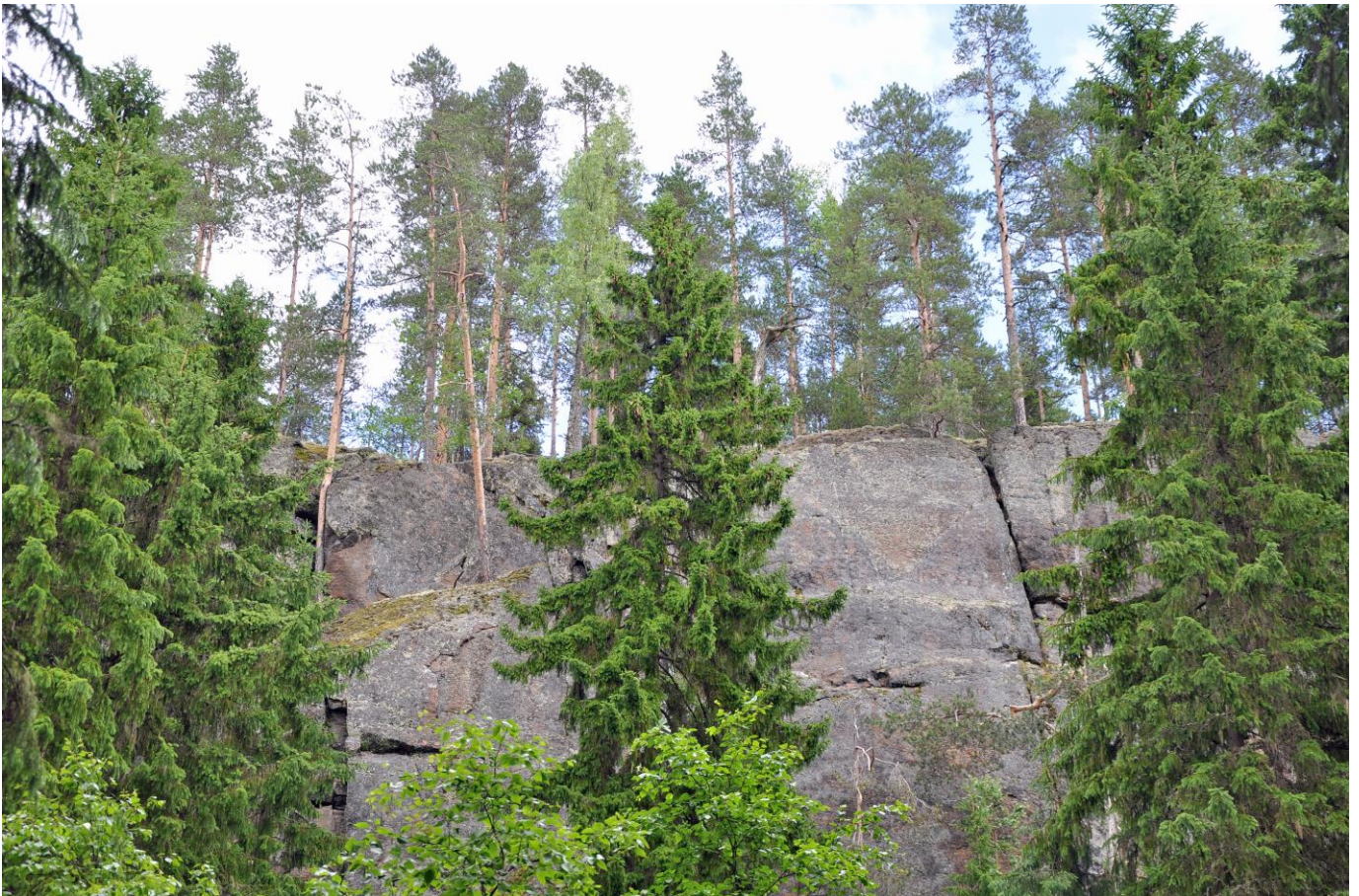
Kuva 11. Viitasaaren Karoliinan portaiden jyrkkää kallioseinämää

Luonnosvaiheen jälkeen tehdyt muutokset: Luonnonsuojelulailla toteutetut tai toteutettavaksi tarkoitetut alueet merkittiin kaavaan SL-merkinnällä. Lisäksi kaikki Natura-alueet osoitetaan kaavakartalla erillisellä nat-merkinnällä, mikä korostaa ja edistää Natura-alueiden huomioon ottamista. Kaavasta poistettiin kaikki arvokkaat geologiset muodostumat. Poiston jälkeen kaava ei tue alueen luontoarvojen säilymistä enää yhtä voimakkaasti, mutta kallioalueiden valtakunnallinen arvo ei kuitenkaan häviä. Maakuntakaava ei todennäköisesti merkittävästi heikennä alueen Natura-arvoja.