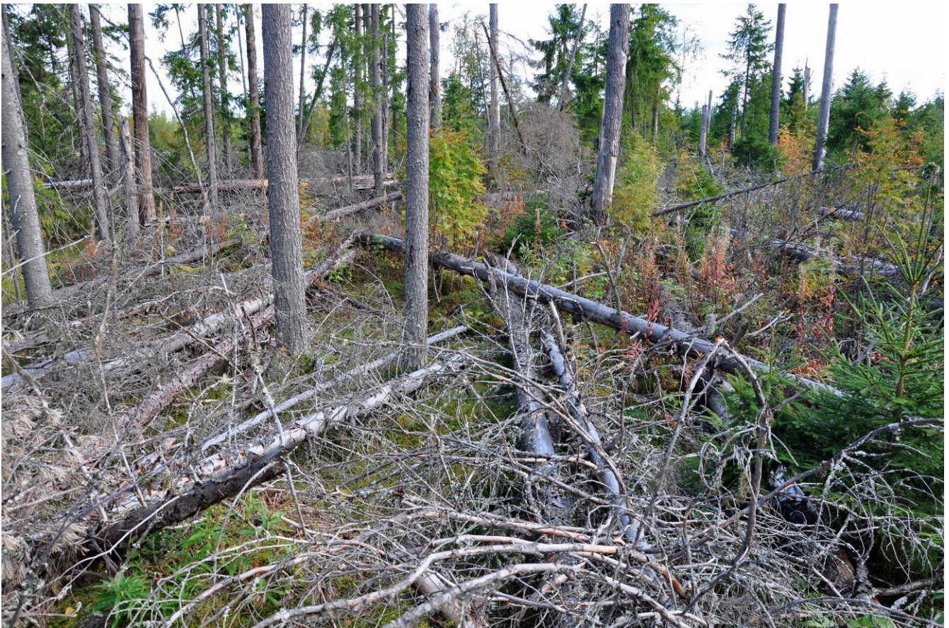
Kuva 5. Konneveden Kytömurronsuon vanhojen metsien kohde on myrskytuhoaluetta

Luonnosvaiheen jälkeen tehdyt muutokset: Luonnonsuojelulailla toteutetut tai toteutettavaksi tarkoitetut alueet merkittiin kaavaan SL-merkinnällä. Lisäksi kaikki Natura-alueet osoitetaan kaavakartalla erillisellä nat-merkinnällä, mikä korostaa ja edistää Natura-alueiden huomioon ottamista. Saarijärven reitin valtakunnallista maisema-alueita pienennettiin, koska laajennuksella ei ole vielä virallista statusta. Laajennusalue merkittiin maakunnallisesti arvokkaaksi maisema-alueeksi. Muutokset eivät vaikuta alueen Natura-arvioinnin tarveharkintaan.