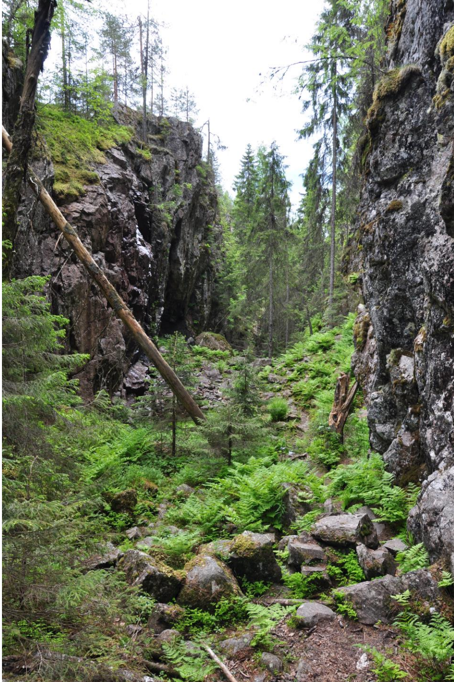
Kuva: Hitonhauta, Laukaa