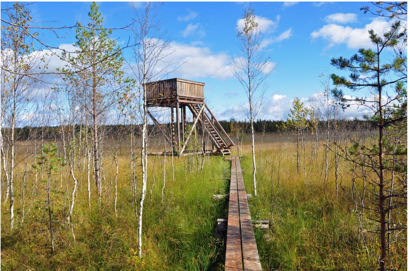
Kuva 15. Konneveden Pieni-Selkiäisen laidalla oleva lintutorni

Luonnosvaiheen jälkeen tehdyt muutokset: Luonnonsuojelulailla toteutetut tai toteutettavaksi tarkoitetut alueet merkittiin kaavaan SL-merkinnällä. Lisäksi kaikki Natura-alueet osoitetaan kaavakartalla erillisellä nat-merkinnällä, mikä korostaa ja edistää Natura-alueiden huomioon ottamista. Maakuntakaava ei todennäköisesti merkittävästi heikennä alueen Natura-arvoja.