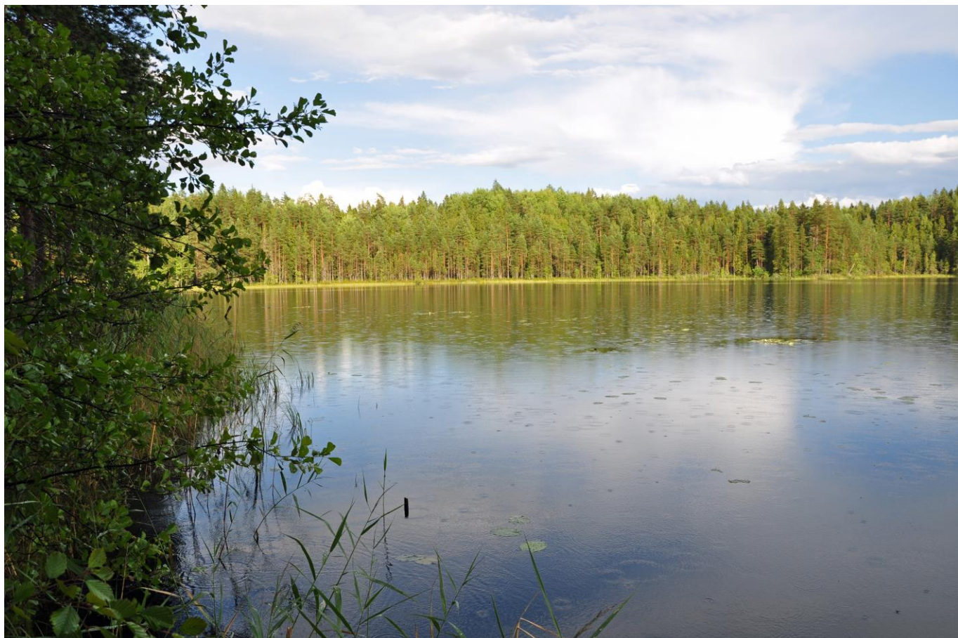
Kuva 12. Jyväskylän Särkijärven Natura-alueita

Luonnosvaiheen jälkeen tehdyt muutokset: Luonnonsuojelulailalla toteutetut tai toteutettavaksi tarkoitetut alueet merkittiin kaavaan SL-merkinnällä. Lisäksi kaikki Natura-alueet osoitetaan kaavakartalla erillisellä nat-merkinnällä, mikä korostaa ja edistää Natura-alueiden huomioon ottamista. Kaavasta poistettiin kaikki arvokkaat geologiset muodostumat. Poiston jälkeen kaava ei tue alueen luontoarvojen säilymistä enää yhtä voimakkaasti, mutta kallioalueen valtakunnallinen arvo ei kuitenkaan häviä. Maakuntakaava ei todennäköisesti merkittävästi heikennä alueen Natura-arvoja.