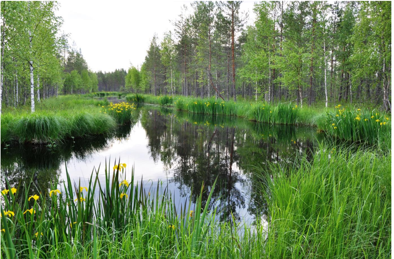
Kuva 14. Konneveden Honkanevan läpi virtaa Lapunjoki

Luonnosvaiheen jälkeen tehdyt muutokset: Luonnonsuojelulailla toteutetut tai toteutettavaksi tarkoitetut alueet merkittiin kaavaan SL-merkinnällä. Lisäksi kaikki Natura-alueet osoitetaan kaavakartalla erillisellä nat-merkinnällä, mikä korostaa ja edistää Natura-alueiden huomioon ottamista. Maakuntakaava ei todennäköisesti merkittävästi heikennä alueen Natura-arvoja.