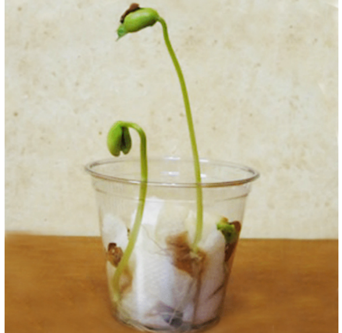
En este visor de semillas, las semillas de frijol se colocaron entre la toalla de papel húmeda y el costado del vaso.