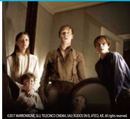
©2017 MARROWBONE, SLU; TELECINCO CINEMA, SAU; RUIDOS EN EL ATICO, AIE. All rights reserved.