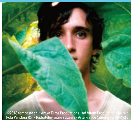
©2018 tempesta srl - Amka Films Productions - Ad Vitam Production - INM - Pola Pandora RSI - Radiotelevisione svizzera - Arte France Cinema - ZDF/ARTE