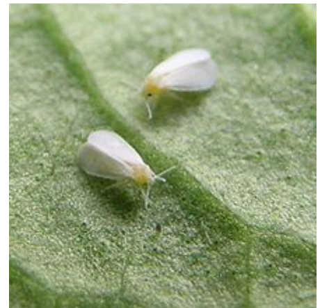
Weißer Fliege , einer der tierischen Schädlinge der Fuchsien

Fuchsien, die optimale Kulturbedingungen haben, werden nur selten von Krankheiten und Schädlingen befallen. Grauschimmelfäule ( Botrytis cinera ) tritt jedoch auf, wenn die Luftfeuchtigkeit zu hoch ist. Dann bilden sich in Nähe des Bodens an den Stängeln braun-schwarze und faulige Stellen, die dazu führen können, dass ganze Zweigpartien absterben. Befallen werden Fuchsien auch von dem sogenannten Fuchsienrost , einer Pflanzenkrankheit, die durch den Rostpilz Pucciniastrum epilobii f. sp. palustris ausgelöst wird. Er nutzt Weidenröschen als Zwischenwirt . Daher sollte diese Pflanzengattung nicht in der Nähe von Fuchsien kultiviert werden. Der Befall kann dadurch festgestellt werden, dass sich an der Blattunterseite gelb-braune bis rostrote Sporen zeigen. Fuchsien sind für diesen Pilz besonders dann empfindlich, wenn bei niedrigen Raumtemperaturen eine zu hohe Luftfeuchtigkeit herrscht.