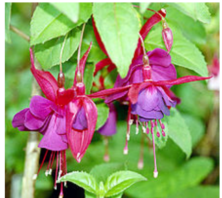
Gefüllte Blüte einer Fuchsienart