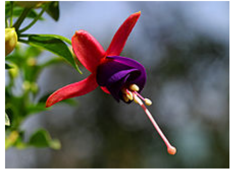
Fuchsien-Blüte: die leuchtend roten Kelchblätter sind zurückgebogen. Die Kronblätter sind von purpurner Farbe

Im Gartenbau wird meist die vegetative Vermehrung über Stecklinge bevorzugt. Fuchsienstecklinge wurzeln schnell, wenn die Bodenwärme 18 bis 20 Grad Celsius beträgt. In kommerziellen Gärtnereien stehen die Vermehrungsbeete deswegen gelegentlich auf beheizten Pflanztischen. Die Stecklinge müssen vor Zugluft, praller Sonne und Verdunstung geschützt werden. Ihre Bewurzelungsgeschwindigkeit erhöht sich, wenn die Luftfeuchtigkeit hoch ist. Als Vermehrungssubstrat wird ein nährstoffarmes Torf-Sand-Gemisch (üblicherweise im Verhältnis 2:1) verwendet. Eine erfolgreiche Wurzelbildung zeigt sich in der Wiederaufnahme des Triebspitzenwachstums, also der Bildung neuer Blätter und der Streckung des Sprosses. Bei hoher Luftfeuchtigkeit und Raumtemperatur bewurzelte Stecklinge müssen danach an