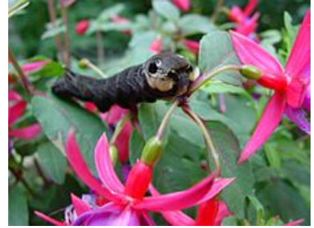
Raupe des Mittleren Weinschwärmers auf einer Fuchsienpflanze

Von den verschiedenen Blattlausarten befällt vor allem die Grüne Pfirsichblattlaus ( Myzus persicae ) Fuchsien. Da die Läuse den Pflanzen Zellsaft entziehen, entstehen Blattverkrüppelungen oder Blattkräuselungen und die Blätter vergilben. Von den Spinnmilben befällt Tetranychus urticae Fuchsien. Auch sie stechen das Blattgewebe an und saugen den Zellsaft aus. Erkennbar ist ein Befall an weiß-gelblichen Blattflecken. Unter den Wanzen sind es vor allem die Trübe Feldwanze und die Grüne Futterwanze , die an den Fuchsienpflanzen zu starken Schädigungen führen. Auch hier führt das Entziehen von Zellsaft durch die Saugtätigkeit der Wanzen zu einer Blattverkrüppelung. Betroffen sind jedoch vor allem Knospen , die von diesen Wanzen besonders gerne angebohrt werden. Schaumzikaden richten dagegen an den Pflanzen nur wenig Schäden an, trotzdem kommt es gelegentlich durch andere Zikadenarten zu Fraßschäden an den Pflanzen. Zu größeren Fraßschäden kann es dagegen durch die Raupe des Mittleren Weinschwärmers kommen. Die bis zu acht Zentimeter langen Raupen sind sehr gefräßig. Bevorzugte Futterpflanzen sind allerdings weniger Fuchsien, sondern die zur gleichen Familie gehörenden Weidenröschen und Nachtkerzen . Hier ist das Risiko eines Befalls geringer, wenn diese Pflanzen nicht in der Nähe der Fuchsien wachsen.