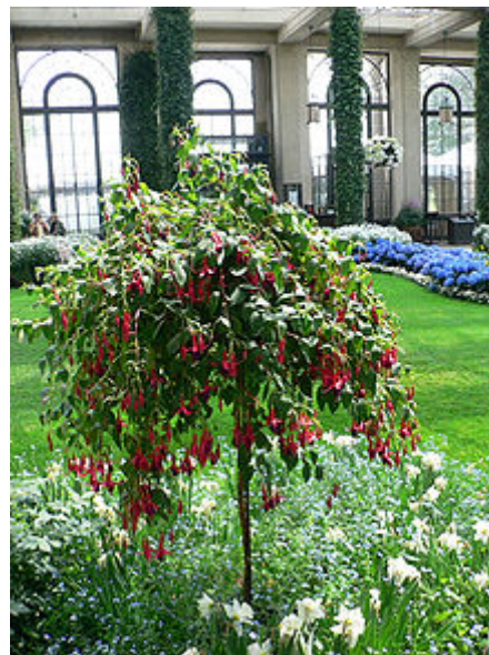
Fuchsien-Stamm – besonders beliebt auf Terrassen

Nur sehr wenige Arten und Sorten der Fuchsie eignen sich für die Kultur im Zimmer. Die meisten Arten leiden unter der zu geringen Luftfeuchtigkeit in zentralbeheizten Räumen. Ebenfalls unverträglich ist es für die Pflanzen, wenn sie auf einer Fensterbank stehen, unter der sich ein Heizkörper befindet. Sie vertragen außerdem keine direkte Sonnenbestrahlung, müssen jedoch sehr hell stehen. Bewährt hat sich dagegen die Methode, die Fuchsientöpfe in größere Übertöpfe zu stellen, die mit feuchtem Torf oder einem anderen wasserspeicherndem Substrat angefüllt sind. Damit entsteht rund um die Pflanze ein ausreichend luftfeuchtes Mikroklima. Die Blüten von Fuchsien scheiden außerdem große Mengen von zuckerhaltigem Nektar aus, der das Mobiliar beschädigen kann. Der Nektar tropft auch auf die Laubblätter, wo er eine klebrige Masse hinterlässt. Im Freien wird diese Schicht vom Regen weggespült. In Gewächshäusern und Wohnräumen müssen die Blätter dagegen regelmäßig mit Wasser besprüht und gereinigt werden.