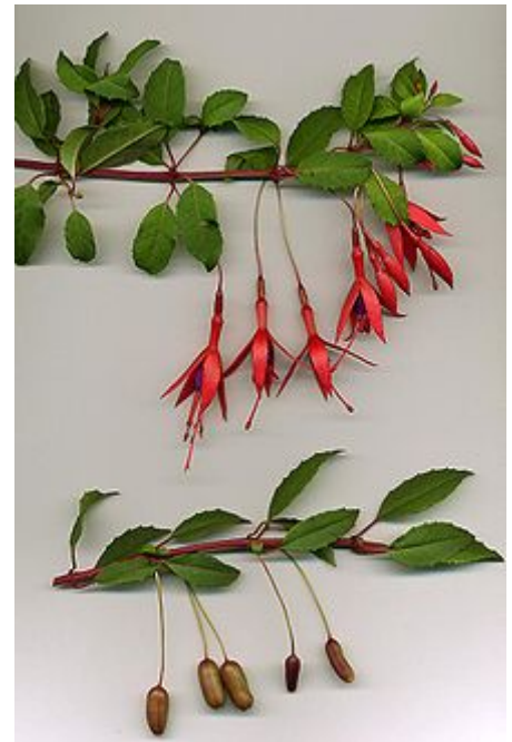
Die Scharlach-Fuchsie ( Fuchsia magellanica ), Elternpflanze zahlreicher Fuchsienhybriden

Die von Plumier entdeckte und beschriebene Fuchsia triphylla war nicht als lebende Pflanze nach Europa gelangt. Auf seiner Rückreise hatte er Schiffbruch erlitten und dabei alle gesammelten Pflanzen verloren. Seine Aufzeichnungen, die die Grundlage für sein 1703 veröffentlichtes Buch Nova Plantarum Americanum Genera bildeten, waren mit einem anderen Schiff nach Europa gesandt worden. Zwischen 1728 und 1732 hatte der schottische Botaniker William Houstoun zwar Samen dieser Art gefunden und nach Großbritannien geschickt. Die daraus gezüchteten Pflanzen gingen jedoch alle wieder verloren. Erst 1873 wurde sie an ihrem erstmaligen Fundort in Santo Domingo durch Thomas Hogg wiedergefunden und erneut wurden Samen gesammelt. Die Kew Gardens zogen aus diesen Samen Pflanzen. Sie ist seitdem in Fuchsien-sammlungen von Privatpersonen und Botanischen Gärten vertreten. Bedeutender als die Kultivierung als reine Art ist jedoch ihr Anteil bei der Züchtung von sogenannten Traubenblütigen Fuchsien, die alle Fuchsia-triphylla -Hybriden sind.