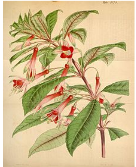
Fuchsia denticulata , Abbildung