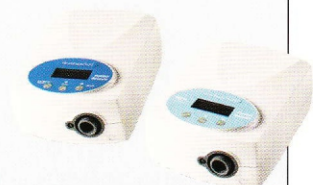
GoodKnight 425 Bi-Level-Serie