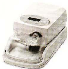
GoodKnight H 2 O ist kompatibel mit: