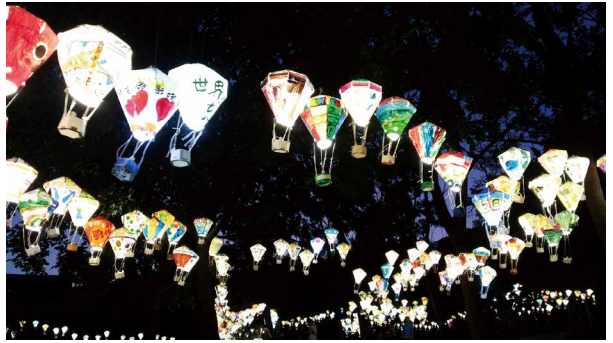
夜晚的鐵花村，一盞盞熱氣球小燈籠。

湖水清澈見底的琵琶湖，在微風吹拂下使湖面起陣陣漣漪，水面倒映著周遭綠意的森林與藍天白雲，加上周邊木棧道跟湖面搭配起來宛如一幅天然的畫作，湖水就像一面清澈的鏡子映照著天空的美麗，能清楚看見湖水裡有海草和小魚快樂的悠游，湖畔兩旁樹木蒼翠挺拔，漂亮極了，是旅人來這裡必拍照的景點。