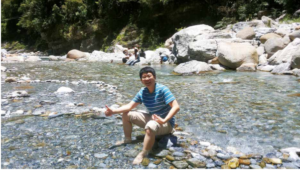
悠閒地走在砂卡礑溪水間。