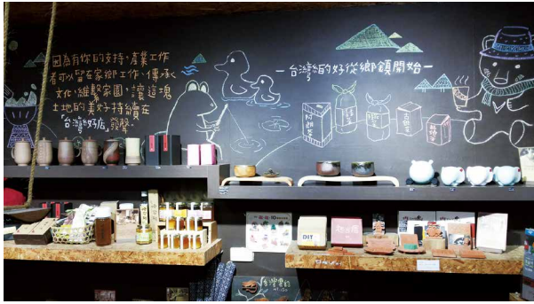
鐵花村音樂聚落一隅。