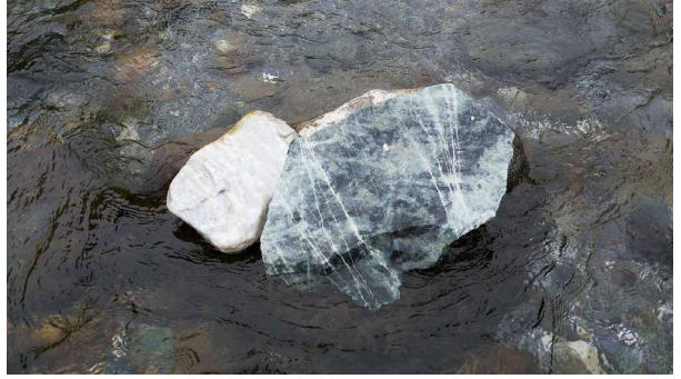
白鮑溪的豐田玉石。

同時，在砌石護岸中，於石頭空隙置入有機土，讓植物植生，孔隙也提供小動物棲息；並興設、改良魚道，讓魚群可以逆流回家；整個治理規劃，除了防災目的外，更為當地野生動植物打造一個安全穩固的家。