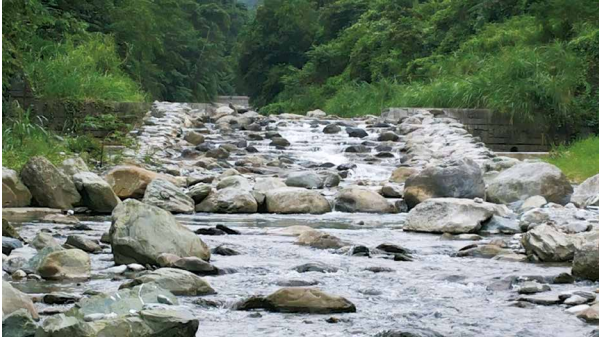
溪水清澈見底又冰涼的白鮑溪。