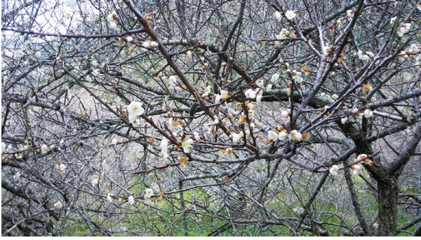
南橫東段海端鄉的梅花綻放。