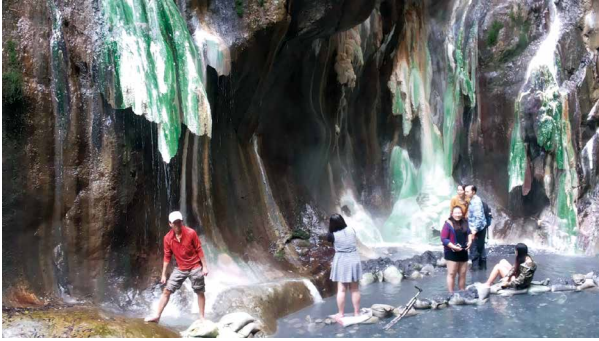
翡翠色自然畫作的栗松溫泉。