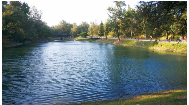
臺東森林公園之琵琶湖。

湖水清澈見底的琵琶湖，在微風吹拂下使湖面起陣陣漣漪，水面倒映著周遭綠意的森林與藍天白雲，加上周邊木棧道跟湖面搭配起來宛如一幅天然的畫作，湖水就像一面清澈的鏡子映照著天空的美麗，能清楚看見湖水裡有海草和小魚快樂的悠游，湖畔兩旁樹木蒼翠挺拔，漂亮極了，是旅人來這裡必拍照的景點。