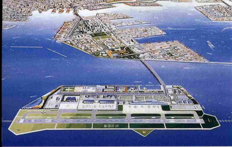
2005年の開港をめざして建設が進む神戸空港

す。WHOが神戸にありますが、飛行機という機動力がなければ、医療産業都市として恥ずかしいです。