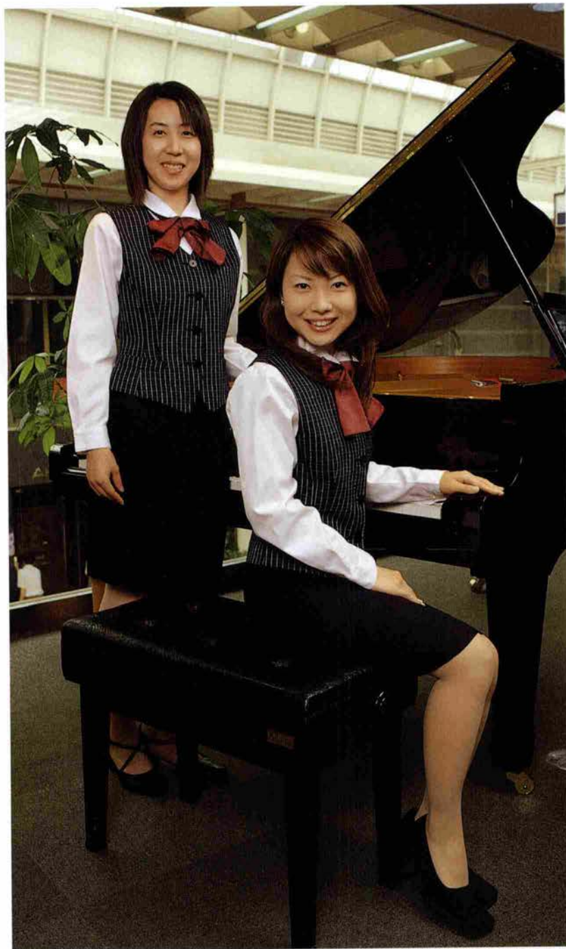
ヤマハミュージック神戸 神戸店にて