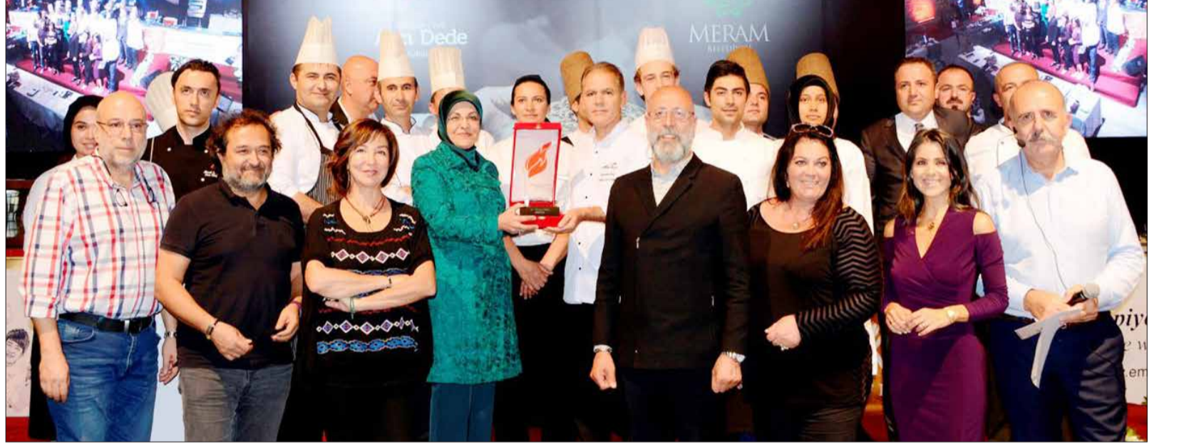
Ateşbâz-ı Veli Aşçı Dede Mutfak Kültürü Günleri, etkinlikleri kapsamında Selçuklu Dönemi Mutfak Sanatları Yarışması, yurt içi yurt dışından seçkin jüri üyelerinin değerlendirmesiyle yapıldı.

Meram Belediyesi ve Anadolu Halk Mutfacı Demeği iş birliğiyle düzenlenen Ateşbâz-ı Veli Aşçı Dede Mutfak Kültürü Günleri, farklı etkinliklerle sürüyor. Etkinlikler kapsamında özel olarak tasarlanan Tarihi Tantavi Amban'ında yapılan Selçuklu Dönemi Mutfak Sanatları Yarışması, yurt içi yurt dışından seçkin jüri üyelerinin değerlendirilmesiyle yapıldı.