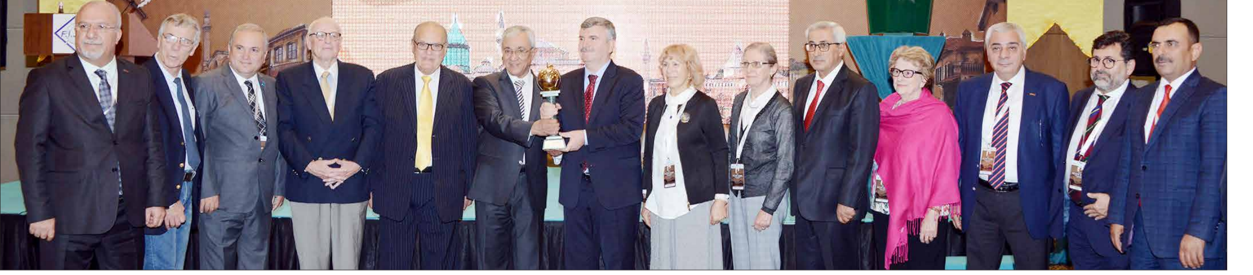
Dünya Turizm Yazarları ve Gazeteciler Derneği (FİJET) tarafından, tarihi ve kültürel değerlere sahip çıkılması nedeniyle Konya'ya verilmesi kararlaştırılan Altın Elma (The Golden Apple) ödülü düzenlenen törenle takdim edildi.