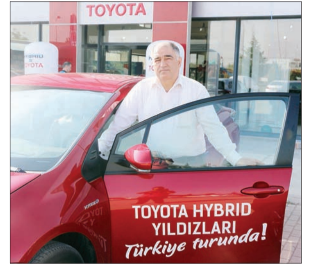
Türkiye'de de hibrit teknolojisini geniş kitlelere yakından tanıtmak isteyen Toyota, etkinliklere devam ediyor

Çarak, "Hibrit bataryası ile çalışan elektrikli motor ve benzin ile çalışan motorun uyum içerisinde kullanıldığı hibrit teknolojisini kısa ve orta vadede çözüm olarak gören Toyota, öncüsü olduğu bu teknolojinin Türkiye'de de daha çok bilinir olmasını sağlamak amacıyla 2017'yi 'Toyota Hibrit Yılı'