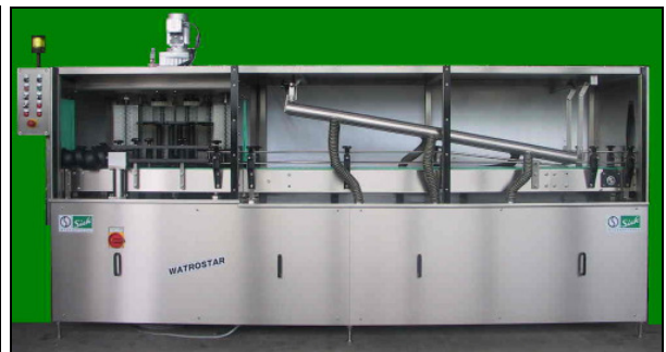
Trockentunnel kombiniert mit Waschmaschine