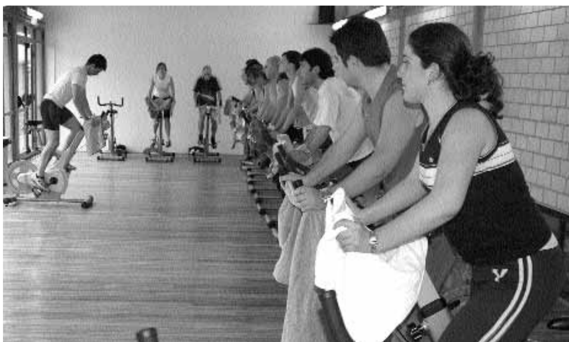
Iladan jarrita pedalei eragiten 'spining' ikasleak Hernaniko kiroldegian.