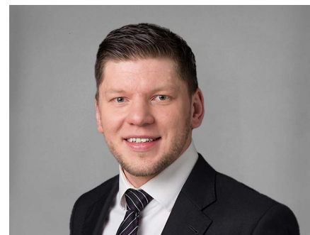
Sebastian Skipper Catering & Partyservice

info@metzgereikuenzli.ch www.metzgereikuenzli.ch