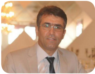
N: Azad Kurdî

Mafên mirovan bi giştî weke bingeha azadî, dad û aştîyê li cîhanê tê dîtin û berçavgirtin. Armanç jê dabînkirina jiyana ewle, serbest, dûr ji hemû çewisandin û zilmekê ye. Mafên mirovan pêk tê ji hemû mafên mirovî yên takekesî û giştî weke siyasî, huqûqî, aborî, civakî û kultûrî ku dewletên xwedî serwer divê wan biparêzin. Parastina mafê mirova weke yek ji pîvanên sereke yên demokratîkbûna dewletan tê dîtin.