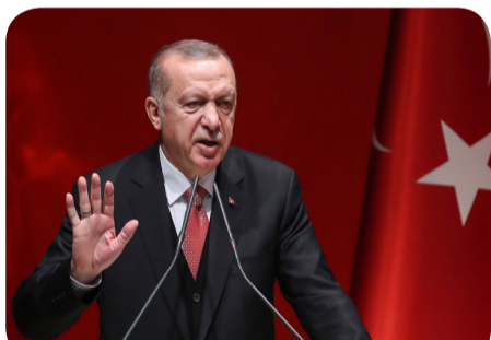
Recep Tayyip Erdoğan: