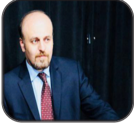
N: Areş Salh Çalakvanê Siyasî

Piştî şoreşa Jîmayê derkevt neteweyên bideşt çawa dikarin di nav siyaseta Îranê de rol bilîzin û bibin hevênêk ji bo guherîkariyan di Îranê de. Lê, tiştêk din jî xuya bû ku em mîna hêza siyasî ya gelê Kurd dibe ku nîrx û girîngiyê bidin bi vê yekê. Û ji bo me jî derkevt ku em mîna gelê Kurd û neteweyên bideşt nikarin bi tena serê xwe bi bê amadebûna Tehranê rejîma Îranê biherifînin.