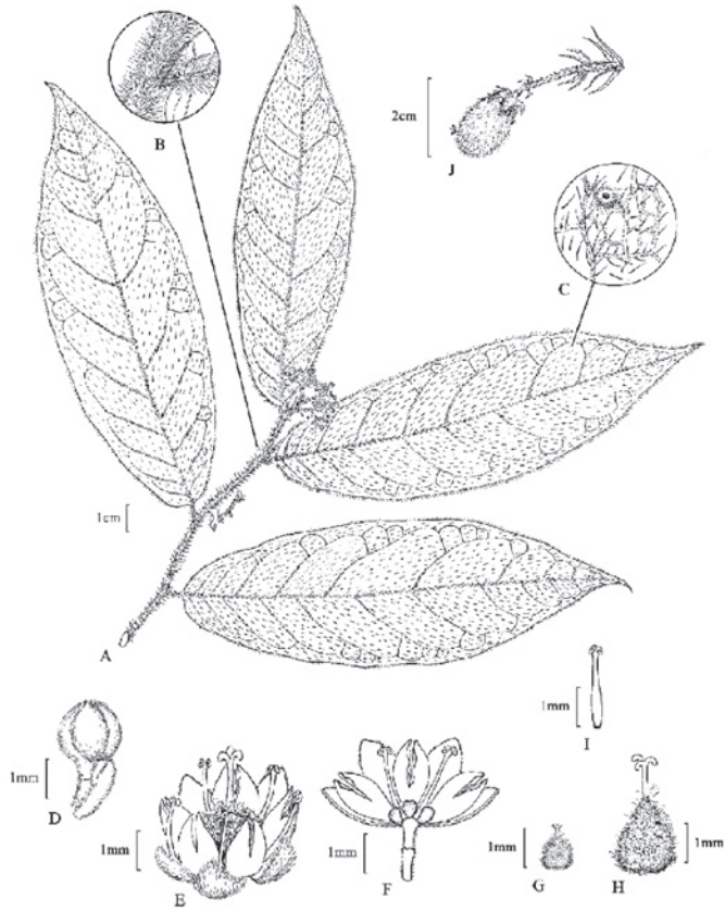
Fig. 2. Dichapetalum reliquum Kriebel & Al. Rodr. (Kriebel & Rodríguez 3419). - A. Hábito. - B. Estípula. - C. Glándula en el envés de la hoja. - D. Botón floral. - E. Flor hermafrodita. - F. Corte longitudinal de flor hermafrodita. - G. Ovario de flor masculina. - H. Ovario de flor hermafrodita. - I. Estambre. - J. Fruto.

Prance, G.T. 1996. Additions to Neotropical Dichapetalum . Kew Bull. 50: 213-219.