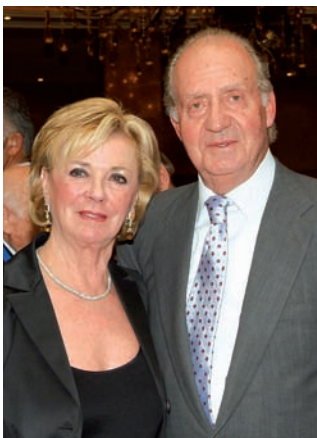
Liz Mohn y el Rey Don Juan Carlos en 2007.

Durante el congreso se entregó el Premio Fundación Bertelsmann, que, dividido en dos modalidades, reconoce las iniciativas impulsadas por jóvenes españoles y el trabajo de aquellas instituciones que fomentan la cultura emprendedora. También se hizo público un importante manifiesto impulsado por la Fundación Bertelsmann y sus socios en el Congreso, con el cual se ha lanzado un importante mensaje a la sociedad española a favor de la juventud y su potencial de compromiso y capacidad emprendedora, que han de ser incentivados y apoyados por el conjunto de agentes sociales.