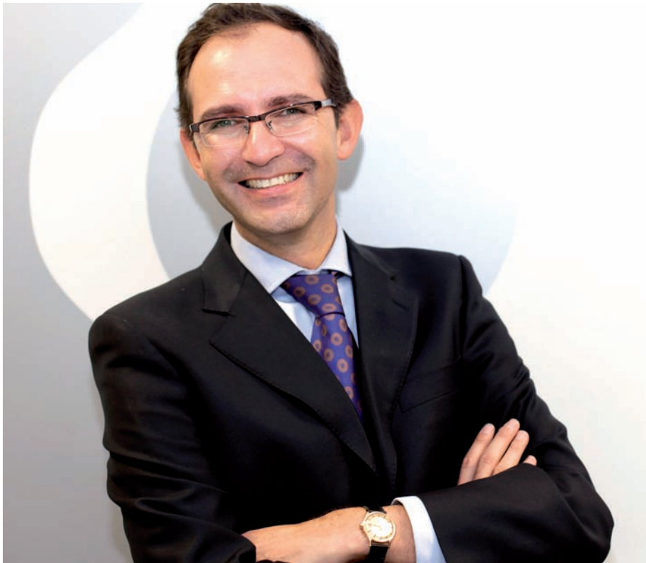
JOSÉ IGNACIO FERNÁNDEZ VERA, DIRECTOR GENERAL DE FECYT