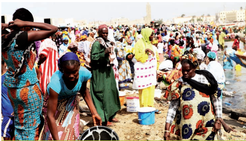
Proyecto en Senegal de Alianza por la Solidaridad.

“Uno de los puntos más delicados al abordar una fusión entre fundaciones es el de los patronatos. Pero si se alinean las sensibilidades el puzzle acaba encajando”