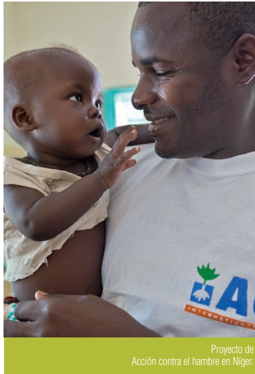
Acción contra el hambre